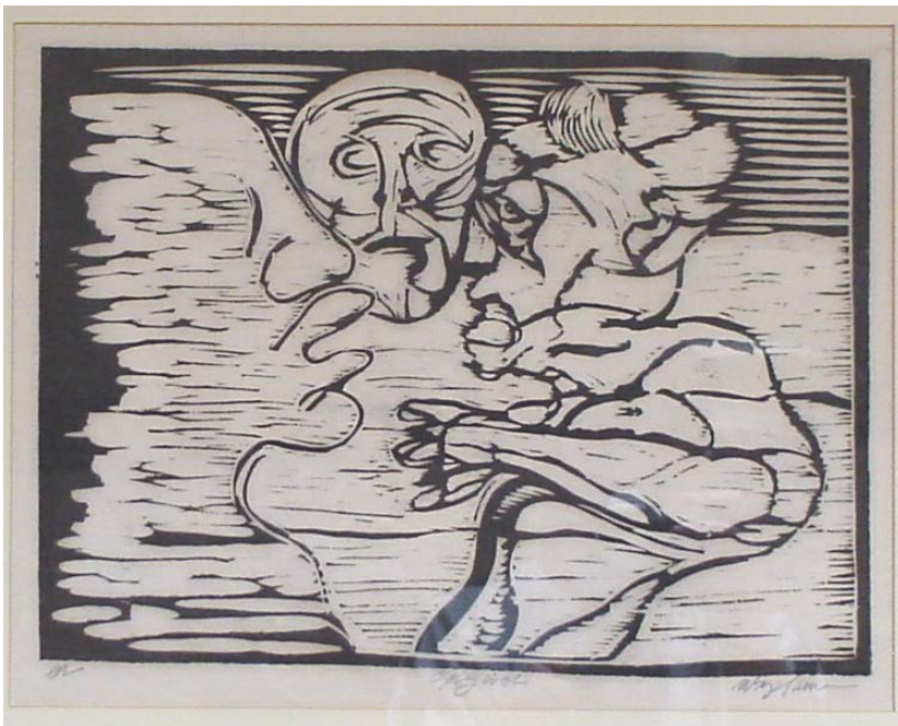
(Kunstner: Svend Wiig-Hansen)