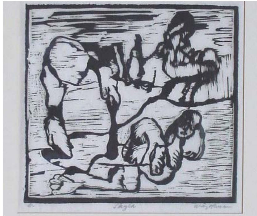
(Kunstner: Svend Wiig-Hansen)