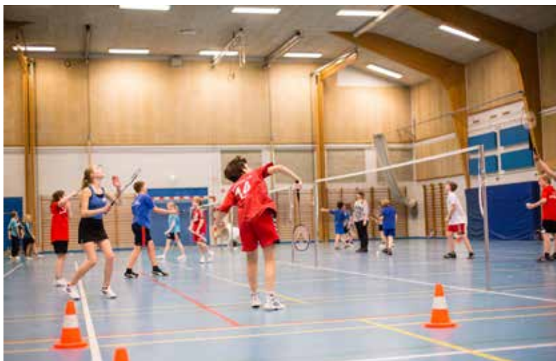
Til højre: SdU tilbyder flere idrætscamps, skoler og aktivitetstilbud, hvor mindretallets unge mødes og tilbringer tid sammen. Her badmintonskole i 2013.