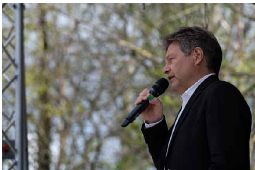
Vicekansler Robert Habeck fremhæver turneringens europæiske perspektiv.

Turneringen er en stor sportsbegivenhed, der kombinerer fair konkurrence og spændingen ved en sportsfestival med hensynet til de oprindelige nationale mindretal. På og uden for banen handler det om fairplay, respekt, tolerance og international forståelse.