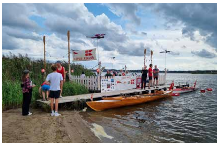
Slesvig Roklub stillede op ved Slien, hvor interesserede fik et indblik i klubbens aktivteter.