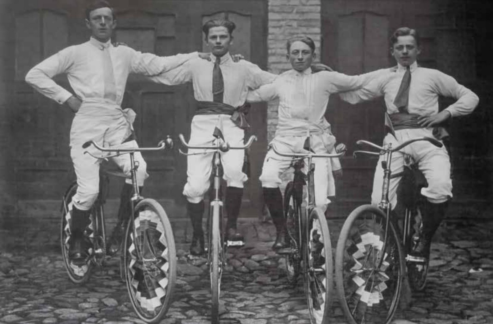
For oven: Fire unge mænd fra Slesvig Ungdomsforening på deres cykler i 1927.