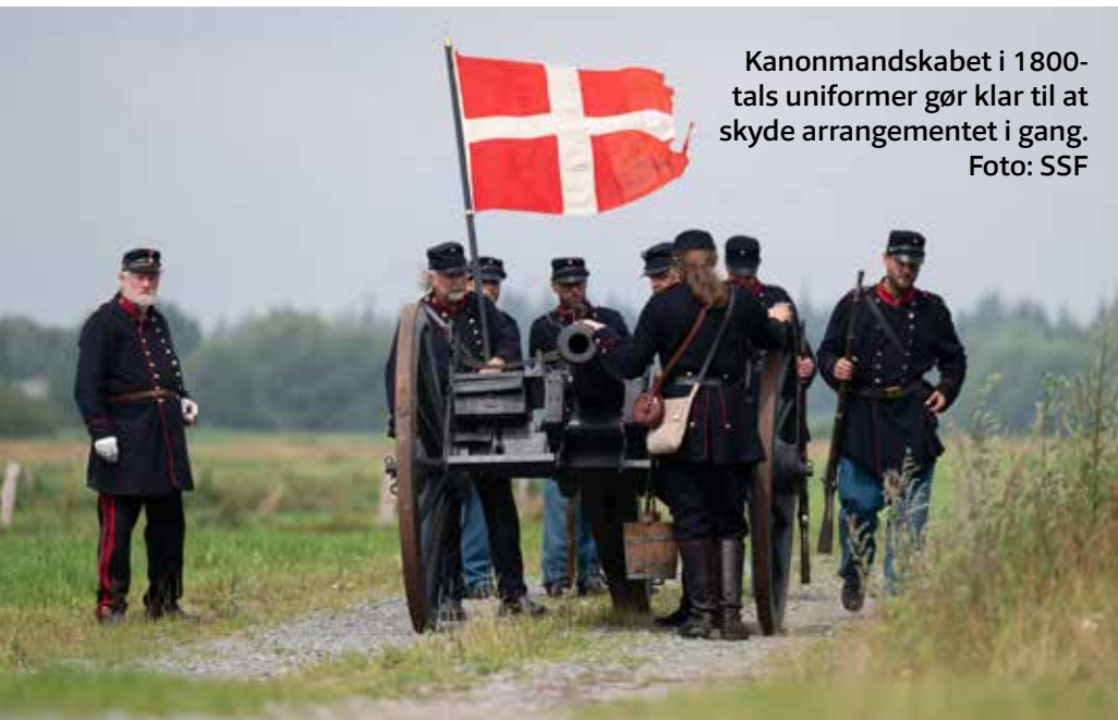
Kanonmandskabet i 1800-tals uniformer gør klar til at skyde arrangementet i gang.

Det er et vigtigt spørgsmål, for markeringen skulle tage højde for mange ting: Den skulle vise respekt for de mange faldne og sårede. Den skulle vise den militærhistoriske og politiske side. Og sidst men bestemt ikke mindst skulle den minde mennesker i grænselandet om, hvad der følger med krig, splittelse og konflikter.