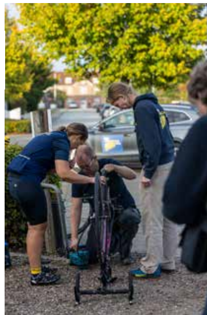
Alle cykler gennemløber et sidste check, inden rytterne starter på første etape.