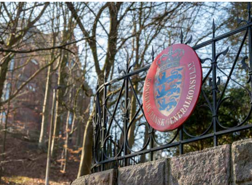
Generalkonsulatet er en afdeling af ambassaden i Berlin.

- Her er en stor gruppe mennesker, der ikke bare taler både dansk og tysk flydende, men også forstår begge kulturer, samfund og måder at tænke på, siger generalkonsulen.