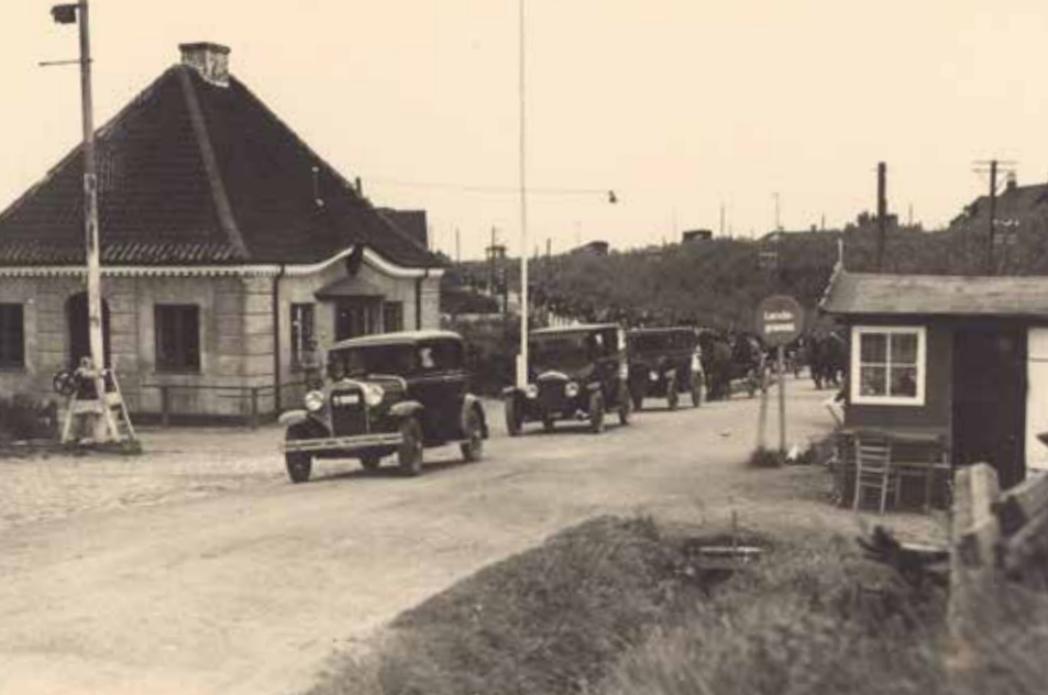
Biler kører over grænsen ved Padborg.

somt. Medlemstallet i Den Slesvigske Forening – som SSF hed den gang - voksede fra 3000 til 75.000 i 1948. Elevtallet i de danske sko-