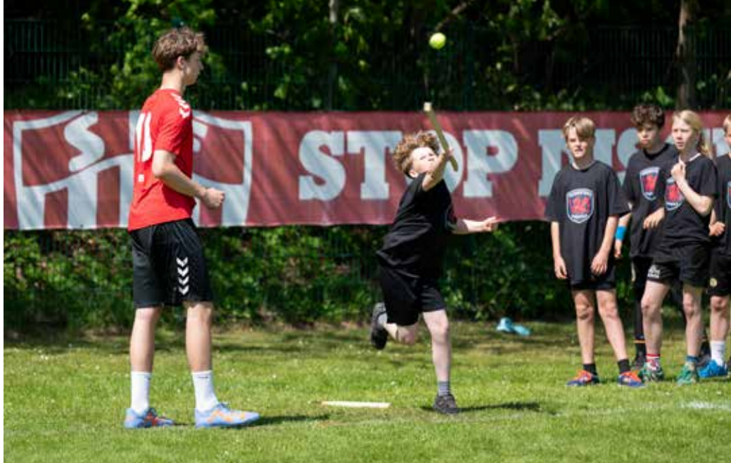
Intense kampe og god stemning var i højsædet.

Stævnet hylder den uofficielle danske national- sport.