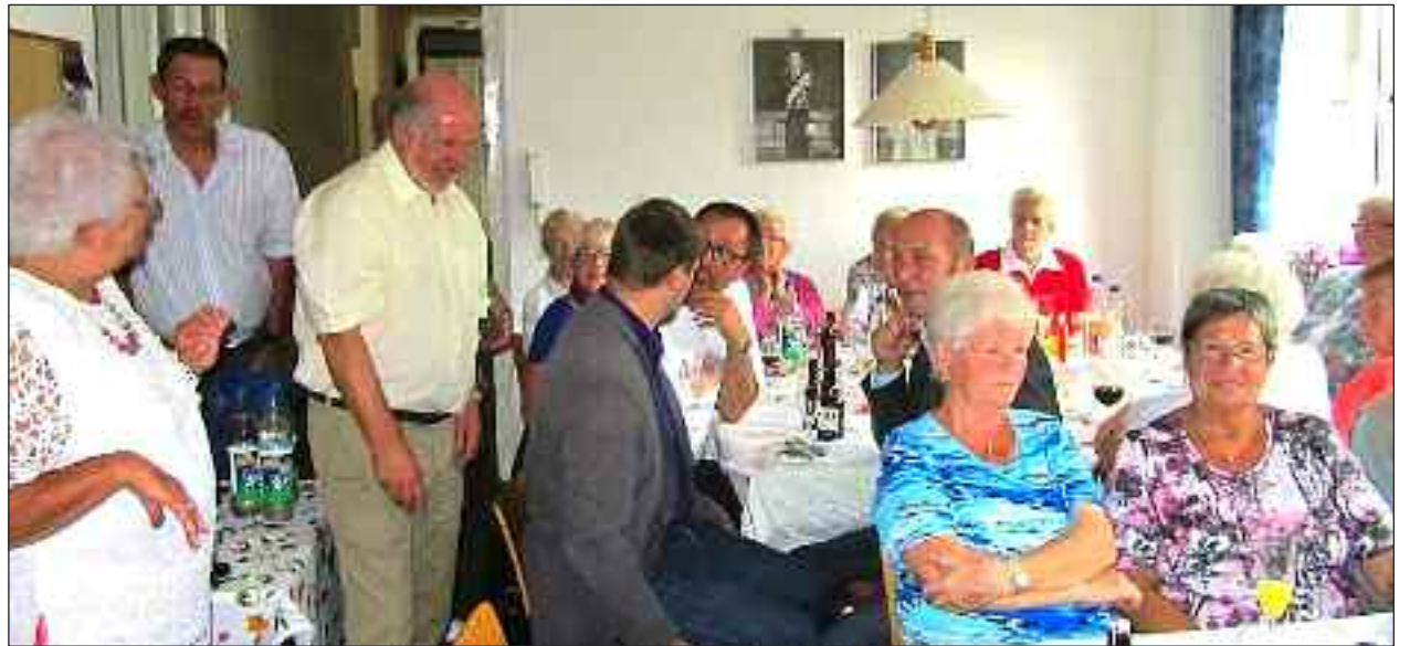
Fuldt hus i klubben i lørdags.