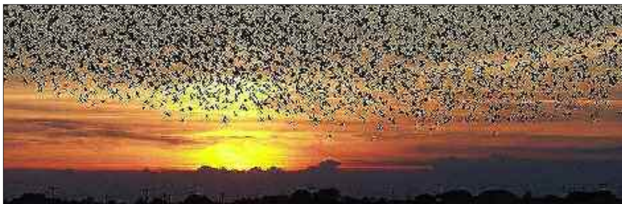
Med SSF til »sort sol« i Tøndermarsken.