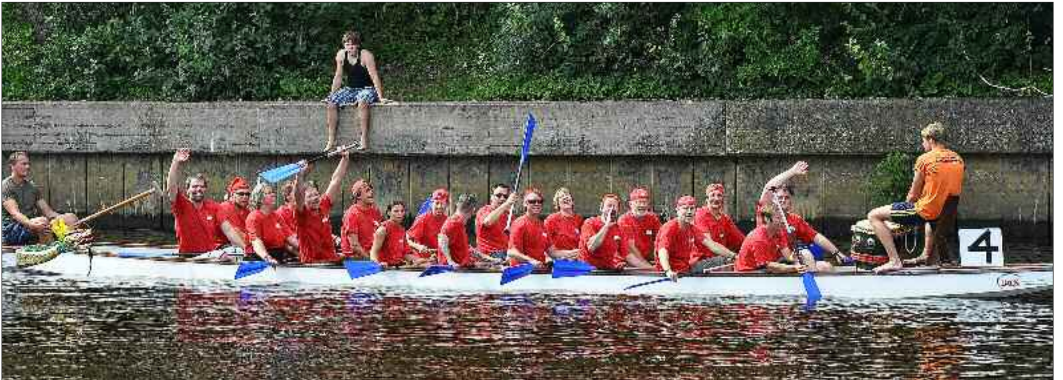
Humøret og kampgejsten fejlede intet i den danske dragebåd.