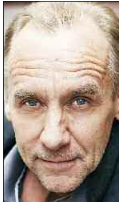
Håkan Nesser.