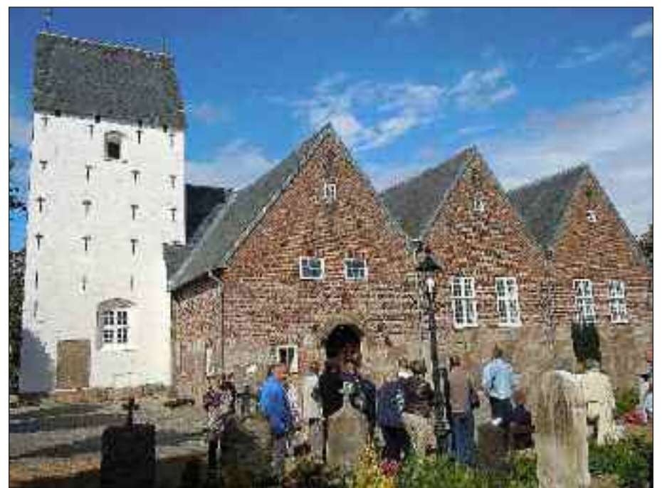
Gæsterne fra Flensborg konfronteres med Toftlund Kirkes noget usædvanlige sydside i tysk herregårdsstil.