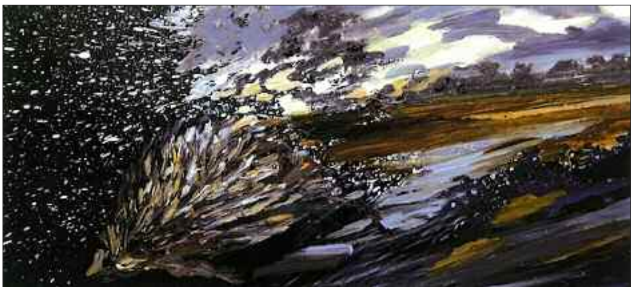
Finn Have: »Tusmørke«.