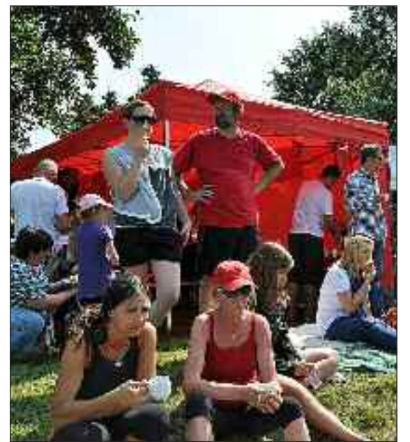
Det røde telt og fans' ene.