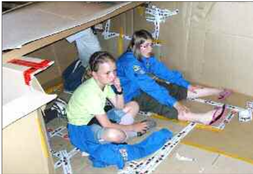
Pilte-piger i gang med at bygge deres slumby.