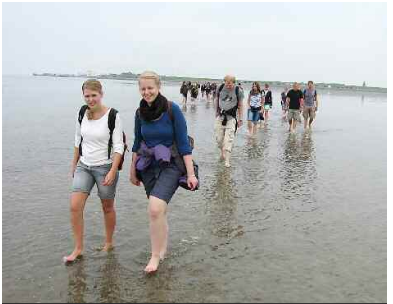
Zu Beginn der Wattwanderung nach Oland und Langeneß war es noch trocken.