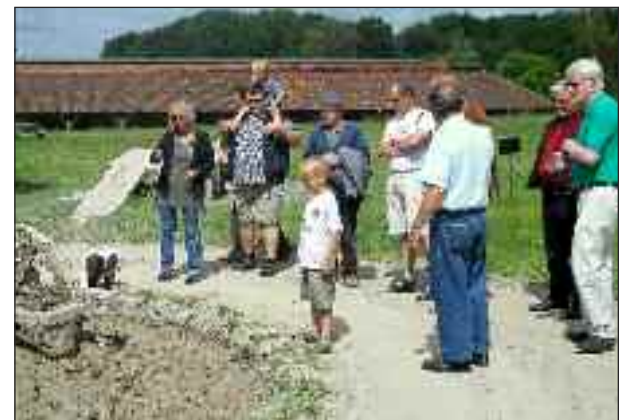
Æltemøllen var hestetrukket.