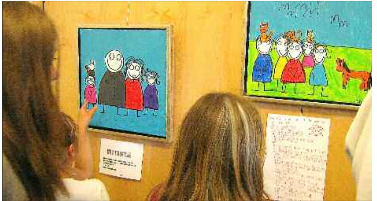
Børnekunst - godawlinger.