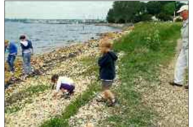
Både ung og gammel lagde mærke til de vandslebne teglrester.

var en oplevelse for sig. Der blev vist film om teglproduktionen, man så hestetrukne æltemaskiner, arbejdsboliger gennem tiderne og var endog inde i en teglværkssovn – som dog var slukket. Se flere fotos på www.syfo.de . ph