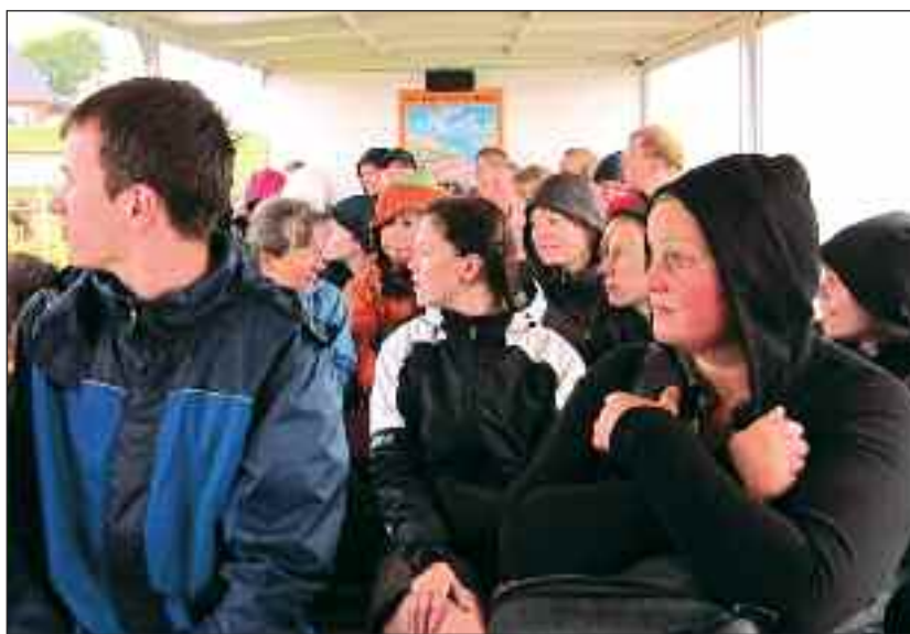
Mit dem „Hallig-Express“ erkundeten die Studierenden die Hallig Langeneß.