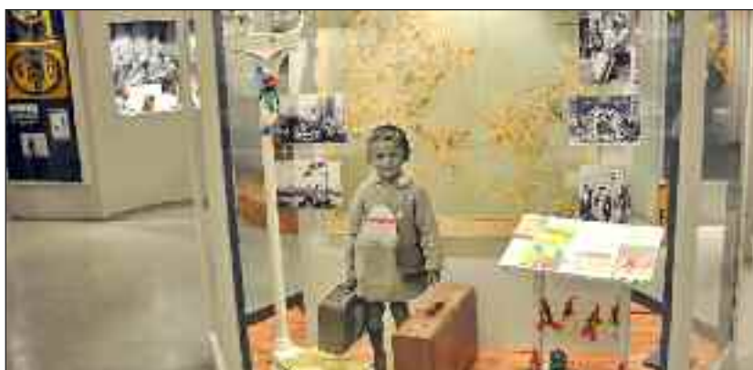
En af monterne på mindretalsudstillingen - feriebarnejsjerne dengang og nu.