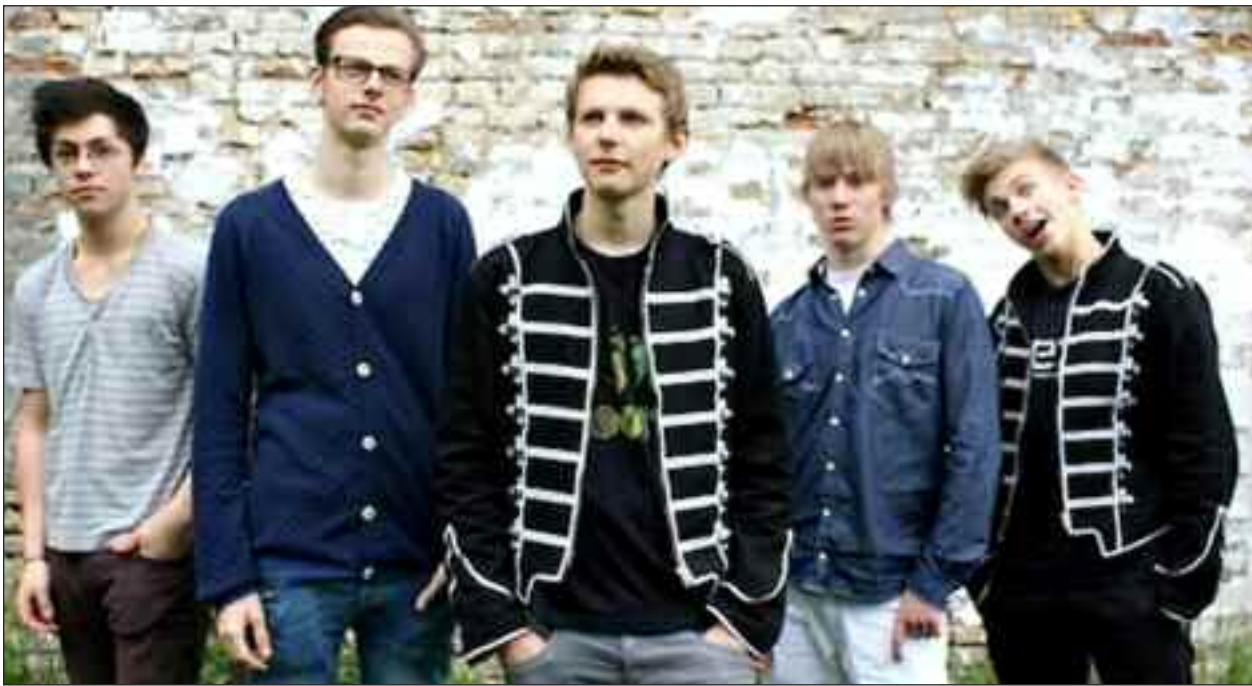
Elephant Doubt spiller i gården ved Friisk Hüs.