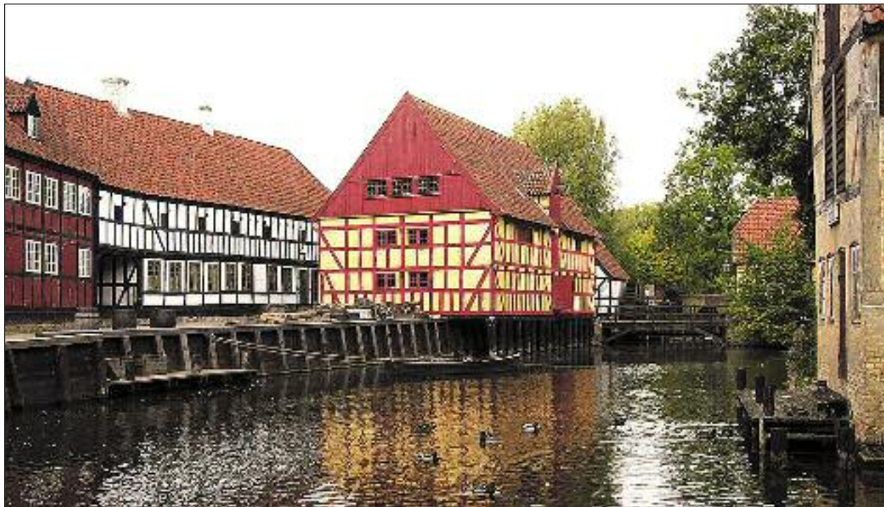
Der er frit valg for dem, der tilmelder sig Århus-turen: Den Gamle By...