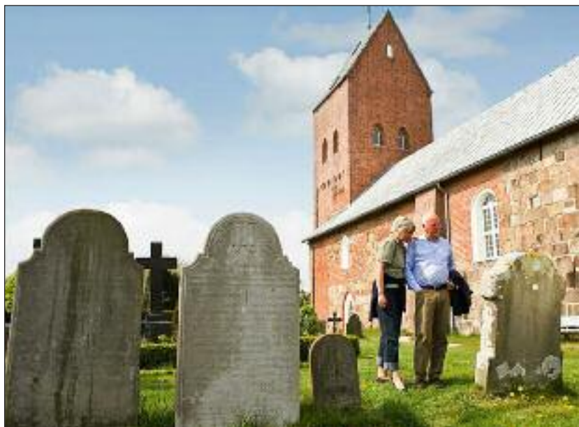
Før venter på slesvigerne - her Sønderende/Süderende kirke.