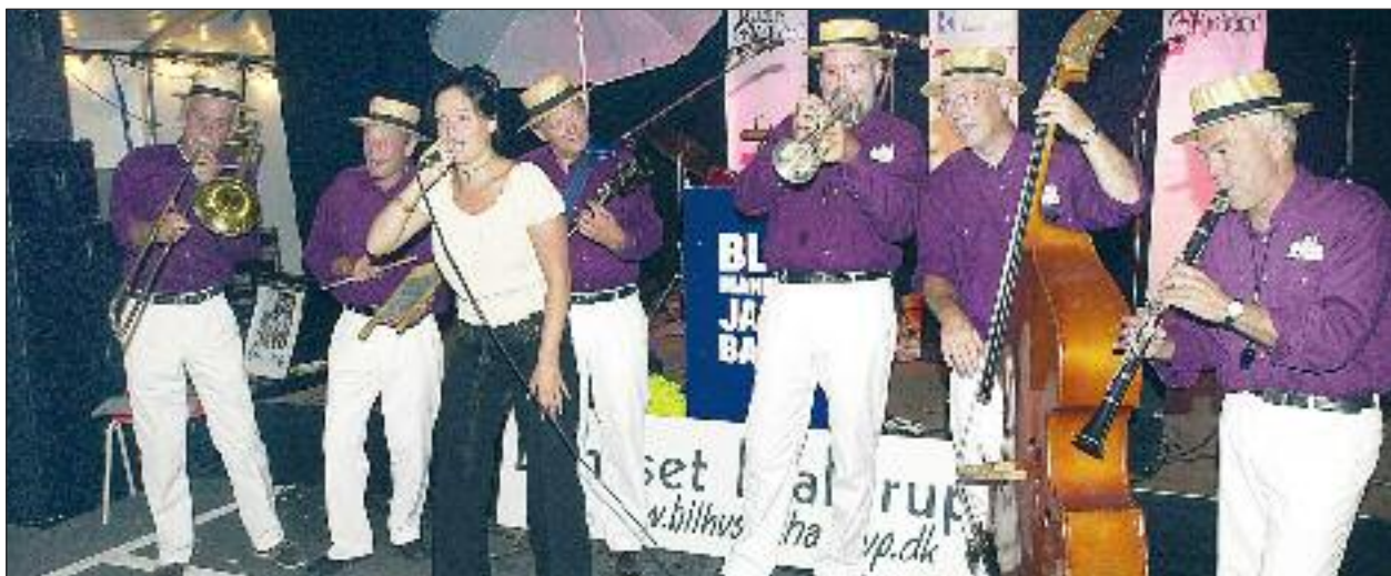
Blå Mandag Jazzband.