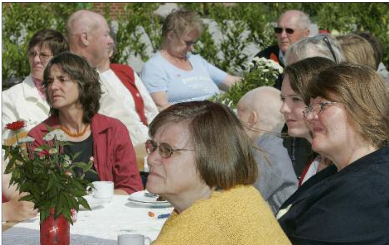
Arrangørerne håber på godt vejr og fremmøde, som her ved et tidligere arrangement.