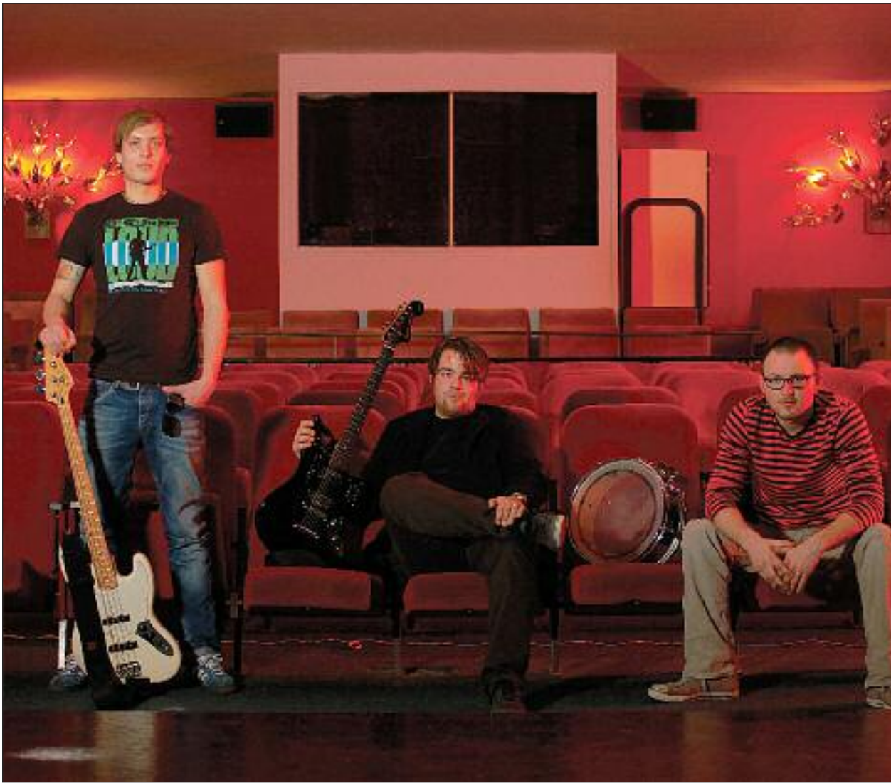
Supersymetry aus Südschleswig - eines von 21 Acts.