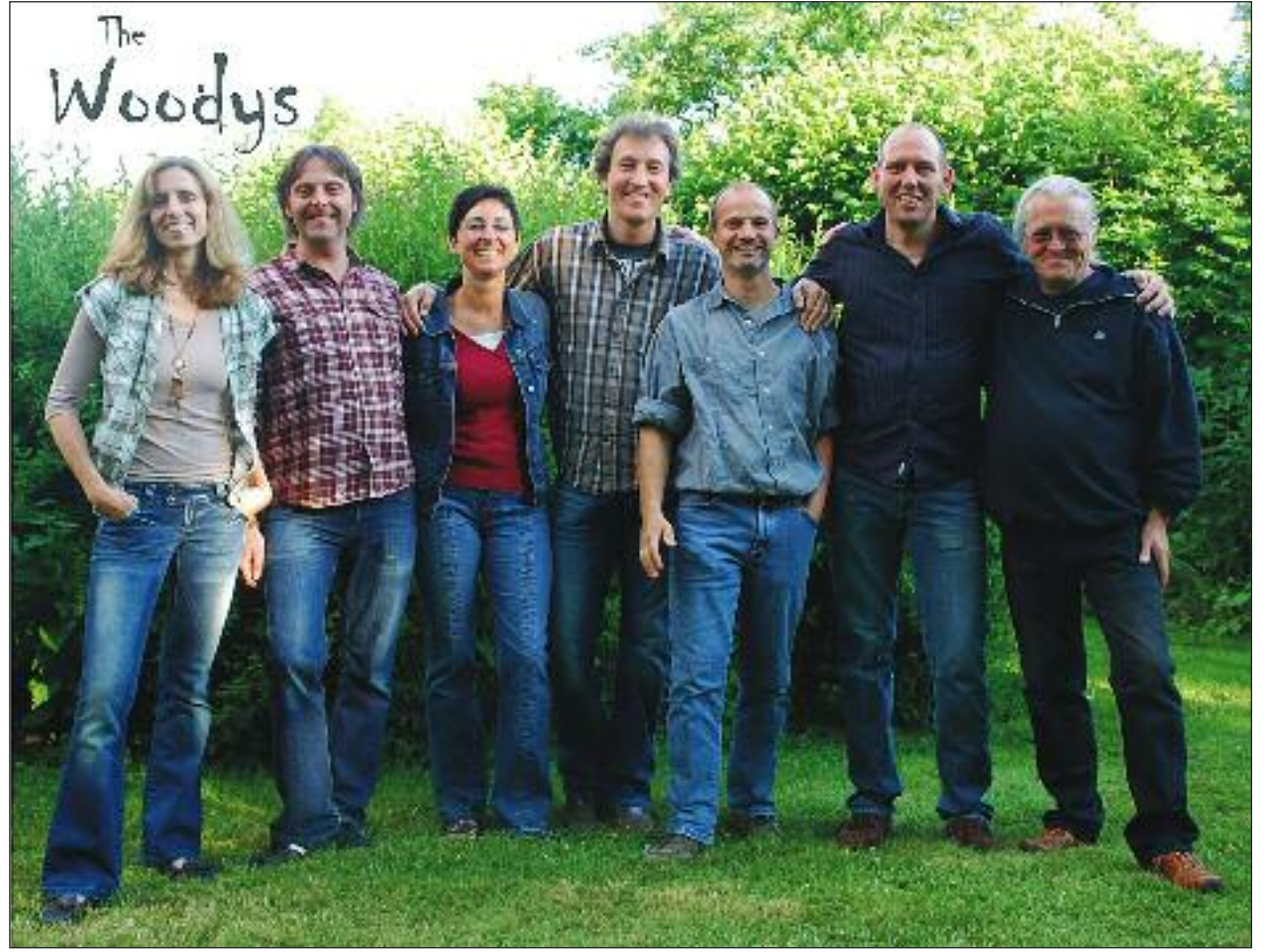
The Woodys aus Nordangeln.