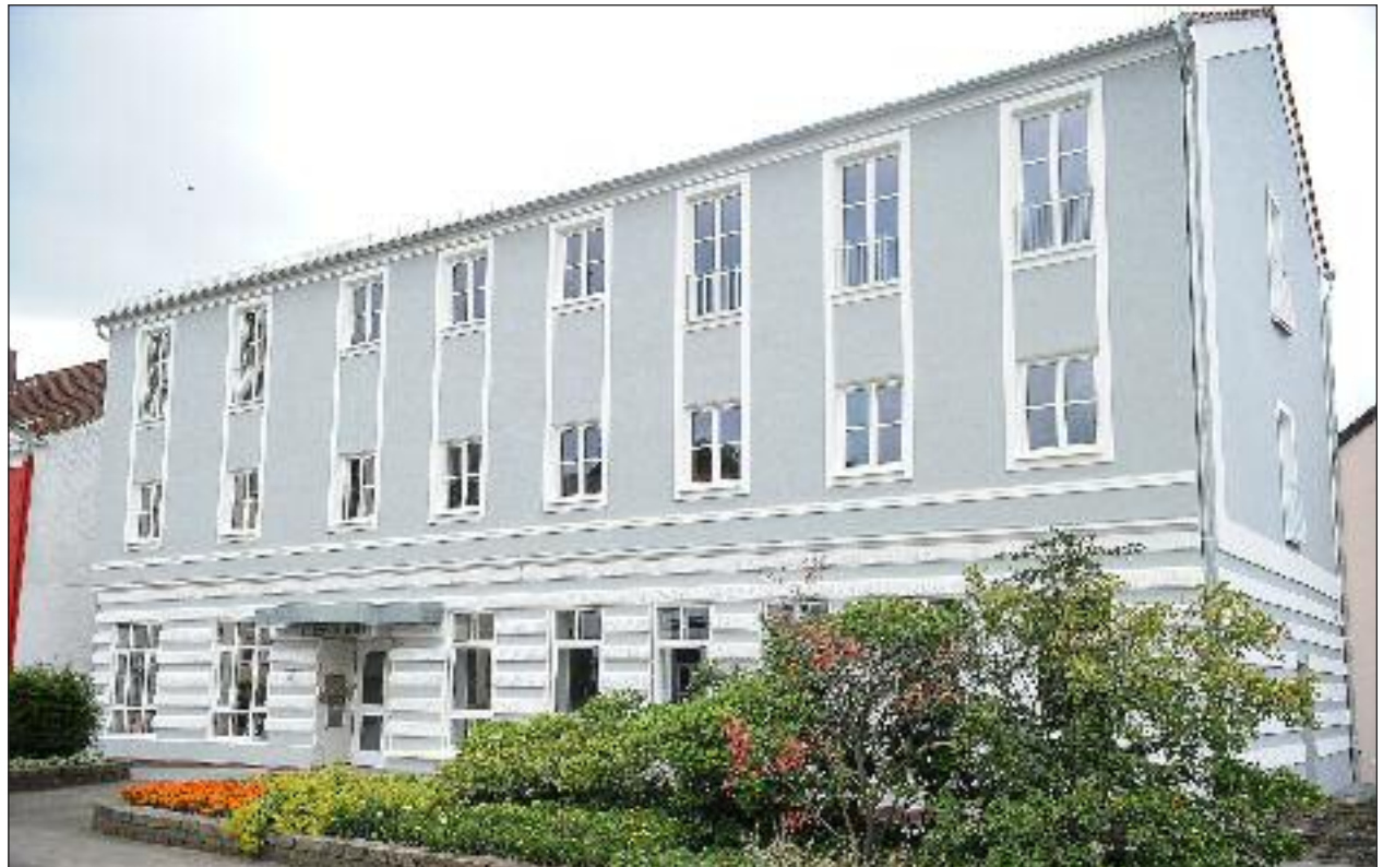
Slesvighus, et hus med traditioner, er efter års tvangspause nu igen et af dansk kulturs stærkeste og centralt placerede, synlige bastioner i Slesvig by og Gottorp amt.