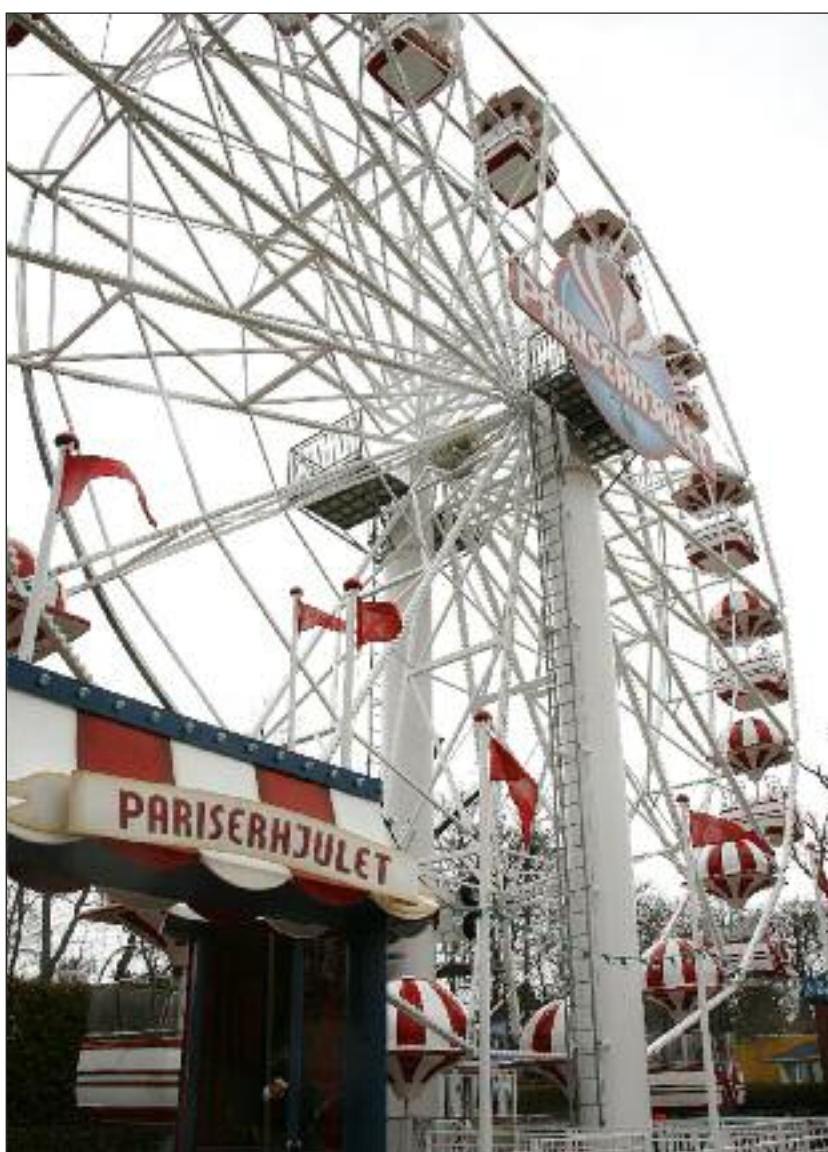
... eller Tivoli Friheden - her Pariserrhjulet.