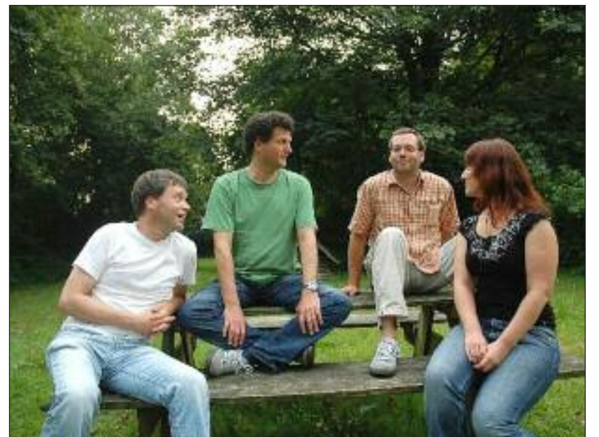
Pearlz on Gazz aus Flensburg.

Repertoire eigener Songs, aber auch Coverversionen u. a. von Led Zeppelin gespielt. Baltic Blues Connection spielen unter dem Motto Rhythm meets Blues Titel aus allen Stilarten