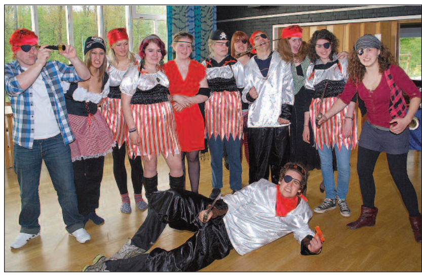
% ' ( * #