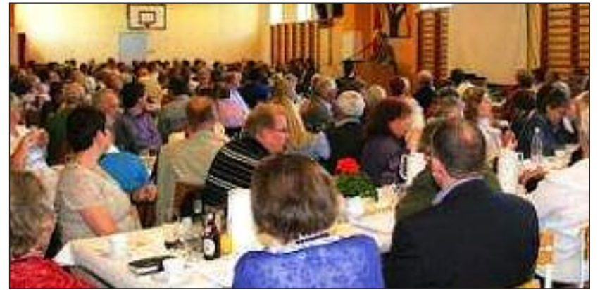
Fra Kirkedagen på Gottorp-Skolen.