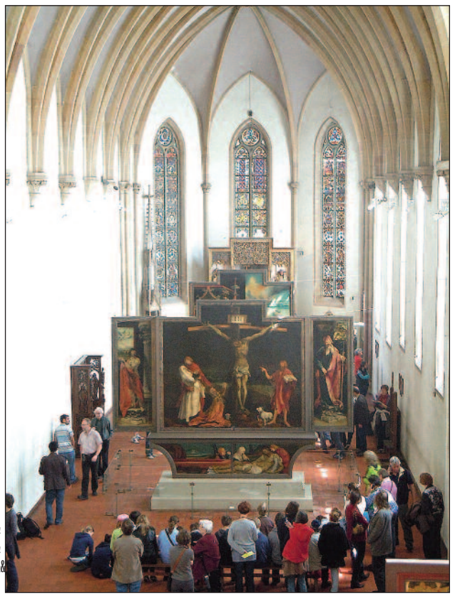
% )% $ % & ' ( ) * + , - . / : ; < = > ? @ A B C D E F G H I J K L M N O P Q R S T U V W X Y Z [ \ ] ^ _ ` { | } ~

4=2@=>? ; 3< 683 ; /2 0:3C 23? =C3? </MA3A 7 @=&A63<OB75 =0 23? (/BO3? ; 32 5=2 A?2 A? /A B24=?@93 23< 72E:7 @93 5/ ; :3 OE :753@= ; 23? =5@P 0:3C A?2 A? /A 9M?3 4=?0? @67<3<@ C/ <2A/ :2 C32 ' 16/46/B@3< <A3?3@3?323 9/ < :L@ 3< 4E:2753?3 03?3A<7<5 4?/ AB?3< >P C=? @E2@3@C75 @93 97793@ 683 ; ; 3@23 DDD 29@ 4= : 9397793< 29 6C=? 23 @/ : 9:7993 >P 1' 3A ' 93AI =5 23?34A3? >P 1 B?=>/ AB? 7 /:C?@4=2@=>?1