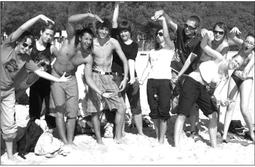
! " $ % & ' ( ) * + , - . / : ; < = > ? @ A B C D E F G H I J K L M N O P Q R S T U V W X Y Z [ \ ] ^ _ ` { | } ~