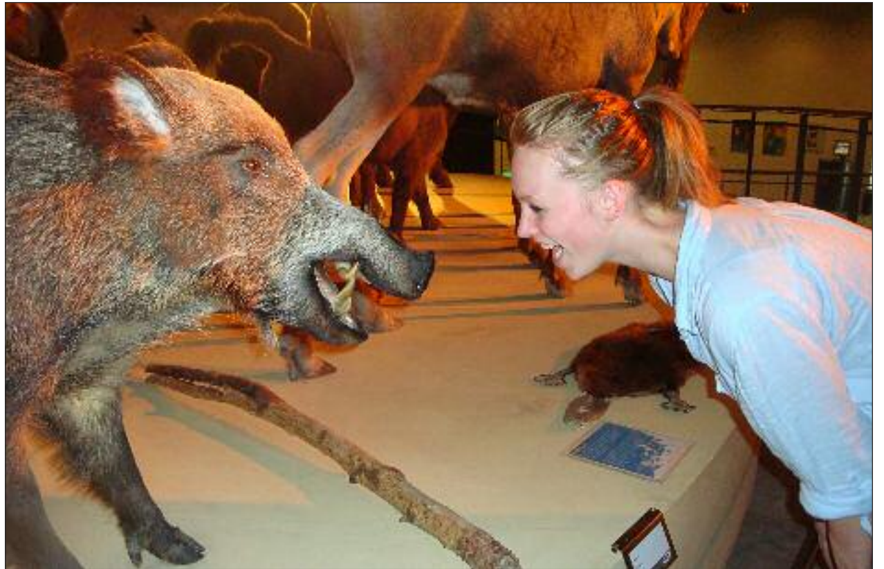
Man kan sagtens være modig, når dyret er udstoppet.