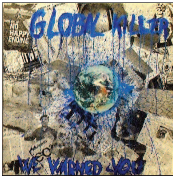
% )% $ % & #