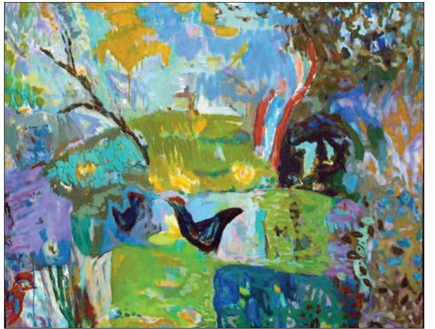
& $ % ' ( ) * + , - . / : ; < = > ? @ A B C D E F G H I J K L M N O P Q R S T U V W X Y Z [ \ ] ^ _ ` { | } ~

- $#( ( . /<35P?23< NO3<?P >?L @3<A3?3? 4? / ; /8 =5 4?3 ; A? : 8B <7 A?2/5 @M<2/5 @/ ; ; 3< ; 32 ?L<@34=?3<7<53< NO3<?P 9B<@B2@A? :7<53< J O &# ' # K &# ' # K &# ' # G ; 32 43? <7@37<5 4?32/5 23< ; /8 9: *755= R6?<@3< 3<@3< :3<@0=?5 B<</? M6?<@3< 3<@3< 'M<23? 0=?5 =5 &/@ ; B@ M6?<@3< $96= ; N?6B@ B2@A? :3? ; /:37? 5?/479 @9B: > AB? 93?/ ; 79 =5 4=A=5?/47 ) 2@A? :7<53< ?B ; ; 3? 3< ?L993 A3 ; /3? @= ; 4 39@ ?7<27<5