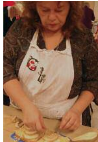
Er der nu nok ost på?