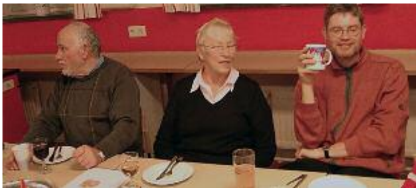
Værsgo, maden er serveret.