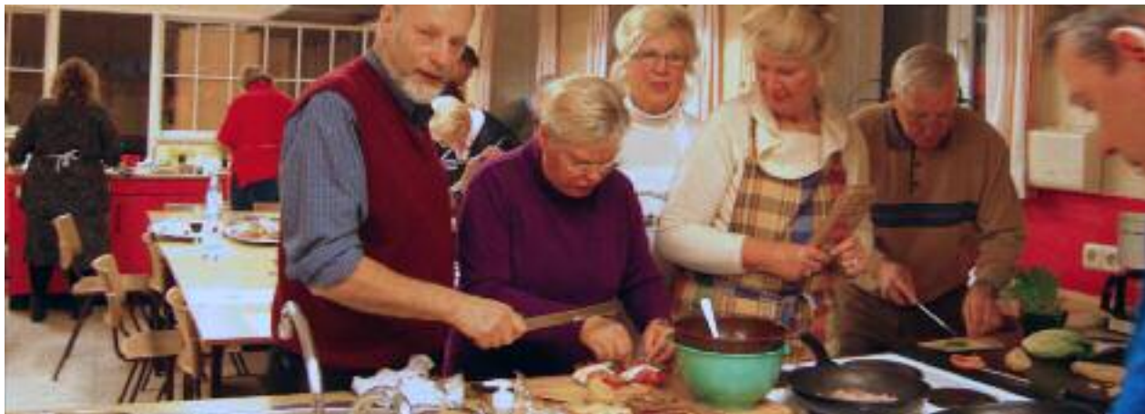
Mange kokke i arbejde.