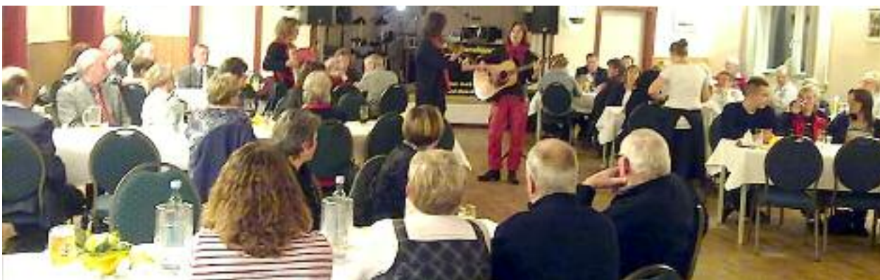
Tre søde piger fra Silkeborg underholdt.