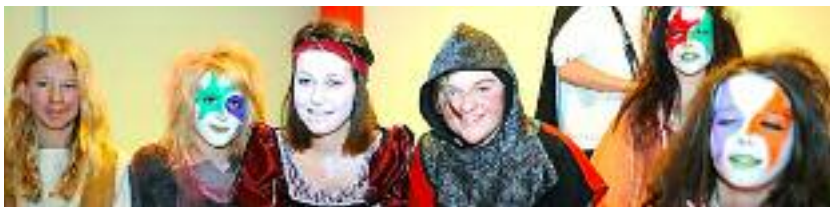
Die friesische Theatergruppe Dolores.