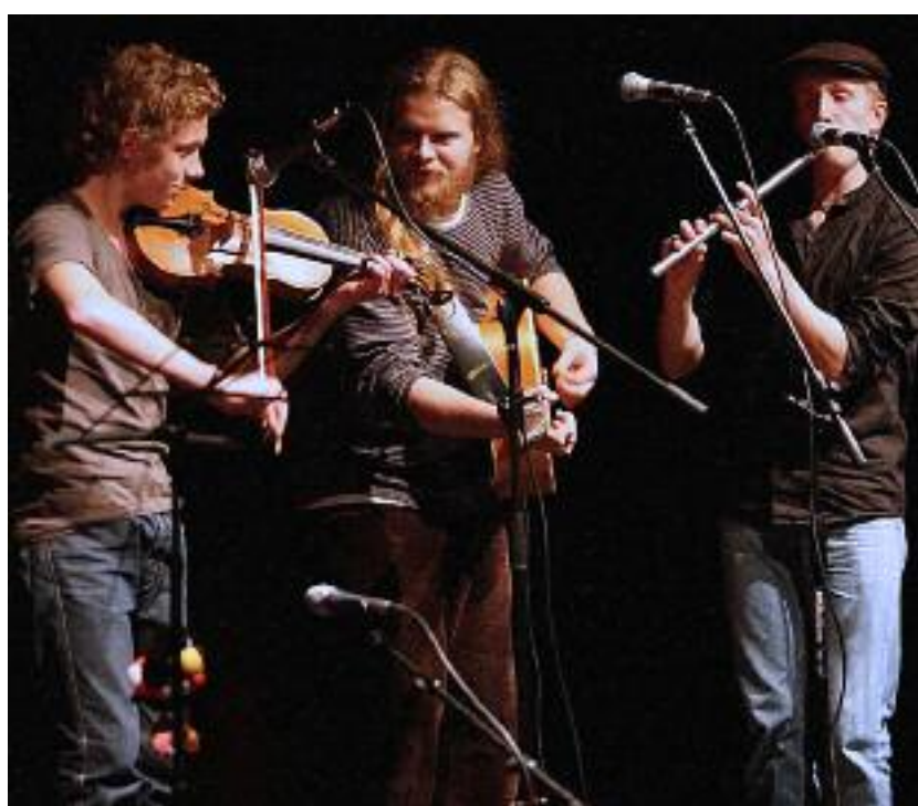
Allmost Irish er tre danske brødre. Men musikken er irsk.

Transporten er gratis for SSF-medlemmer, men man må op med en femmer for at blive sluppet ind til musikoplevelsen.