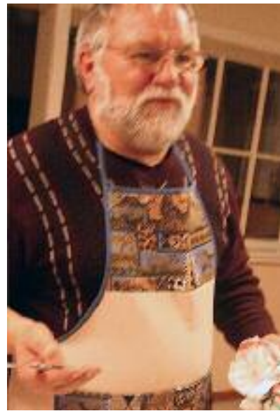
Hvem siger, mænd ikke kan lave mad.

[KONTAKT] Ejderstederne holder af at sætte sig til et veldækket bord. Det gjorde de igen i onsdags; men denne gang måtte de selv lave maden først. Et dusin SSFere forvandlede Uffe-Skolens køkken til en tue fyldt med flittige myrer, der smurte snitter og