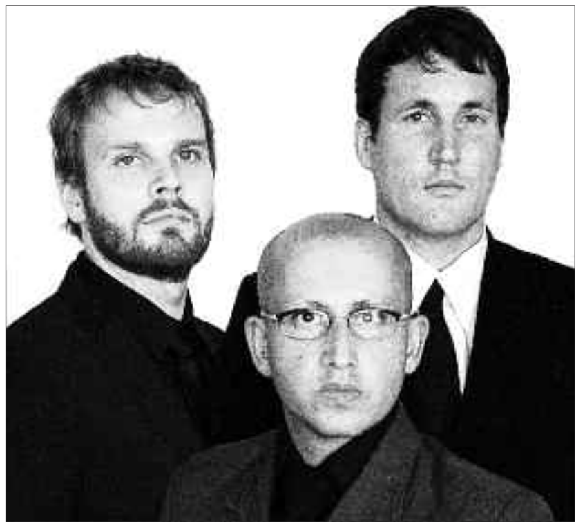
The Movement - på lørdag i Kühlhaus.