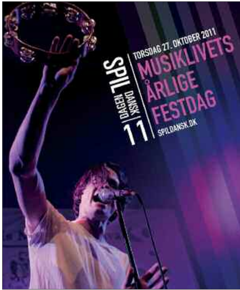
Alt om dagen på http://spildansk.dk/sydslesvig

• Og dagen efter, fredag, 28. oktober kl. 20.00 Pligten Kalder, Volksbad , Skibbroen/Schiffbrücke 67, Flensborg. »Pligten Kalder« står som fornyere af en dansk visetradition. En række melankolske sange krydret med en humoristisk sceneoptræden er nogle af de meste originale, Danmark pt. har at byde på. Entré: 11/9/5 euro BILLETSALG på Flensborghus, Nørregade/ Norderstr. 76, Flensborg - Aktivitetshuset, Nørregade/ Norderstr. 49, Flensborg - Flensborg Bibliotek, Nørregade/Norderstr. 59, Flensborg. Studerende, unge under uddannelse, handicappede og "Sozialpass"-indehavere nedsat pris.