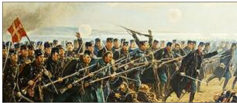
Fra krigen 1864.

[KONTAKT] Efter sidste års store succes inviterer Ydun igen til "kagehuse og julebageri" fredag den 25. november kl. 14.30-16.30 i Skovlund Forsamlingshus. Alle fra 4 år (børn under 6 år skal være ledsaget af en voksen/hjælper) er velkommen. Ydun har alt hvad der skal bruges: medbring godt humør og masser af gode ideer til kagehuse. Prisen er 5 euro pr. barn. Tilmelding hos Kea Küchenthal. 04639-782126 senest 21.11.