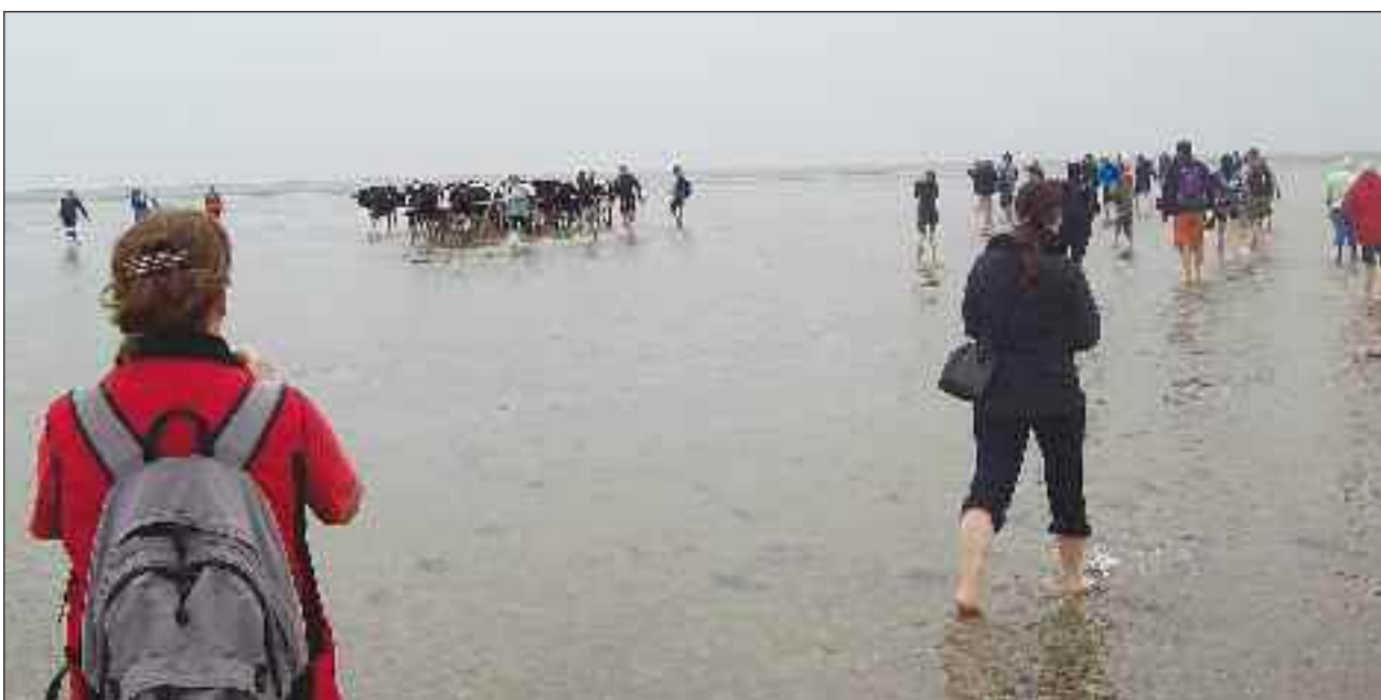
Et usædvanligt møde mellem mennesker og kvier midt i vadehavet.