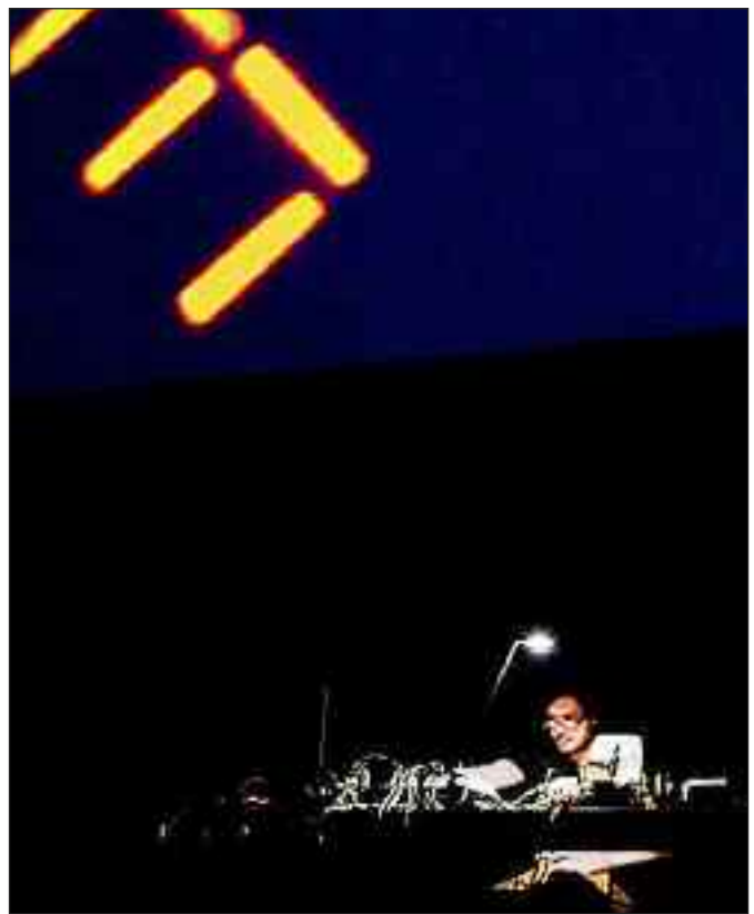
"Define"-festivalen giver musikere og komponister mulighed for at stå på en scene.