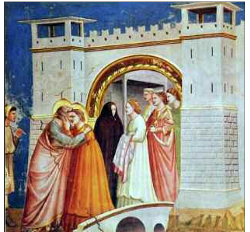
Anna og Joakim mødes ved den gyldne port i Jerusalem. (Fresko af Giotto)