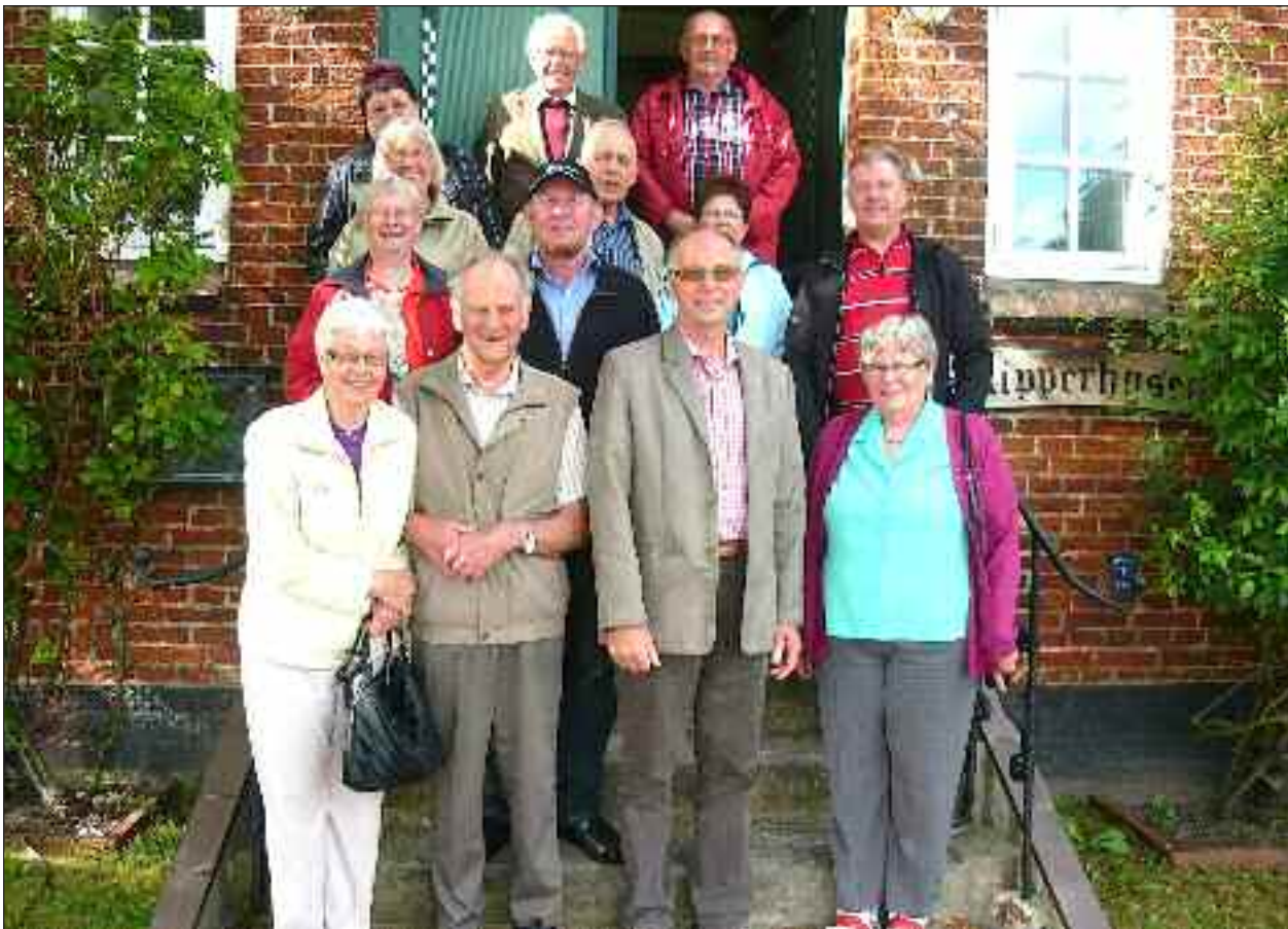
Gæster og værter foran Skipperhuset i Tønning.