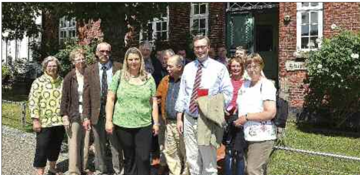
Gæster og værter foran Skipperhuset i Tønning i tirsdags under Sydslesvigudvalgets og Sydslesvigsekretariatets besigtigelsestur. Se også lederen her på siden.