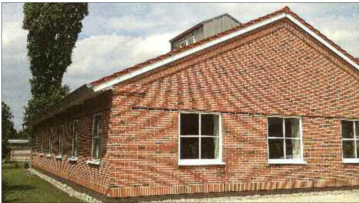
SSFs nye forsamlingshus i Bydelsdorf indvies i morgen, fredag kl. 15.