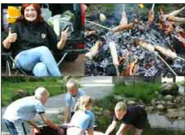
Sjov og kreativitet venter store som små deltagere.