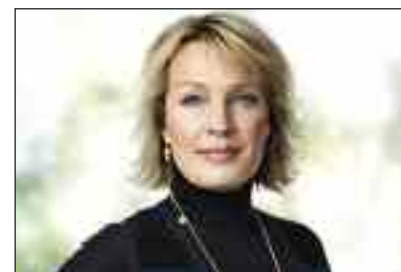
Danmarks udenrigsminister Lene Espersen.

for såvel forbundsregeringen som den slesvig-holstenske landsregering understrege den betydning, som mindretalspolitikken har for den po-