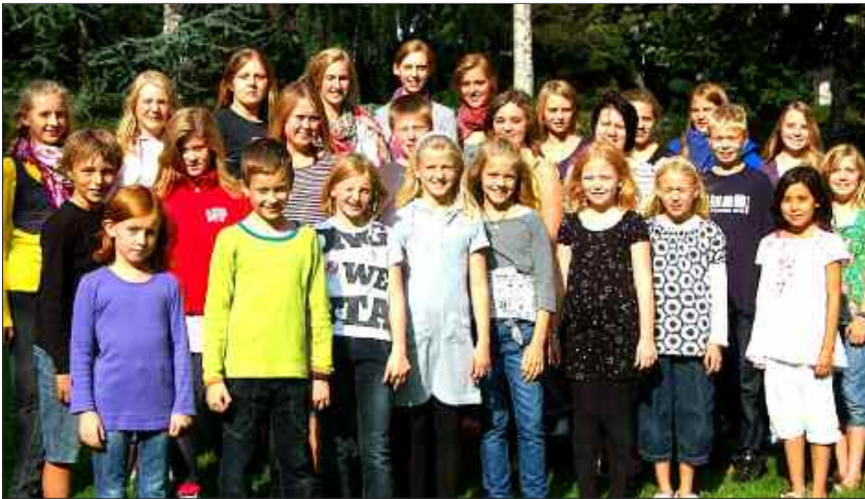
Broager Kirkekor - lørdag i Ansgar Flensborg.