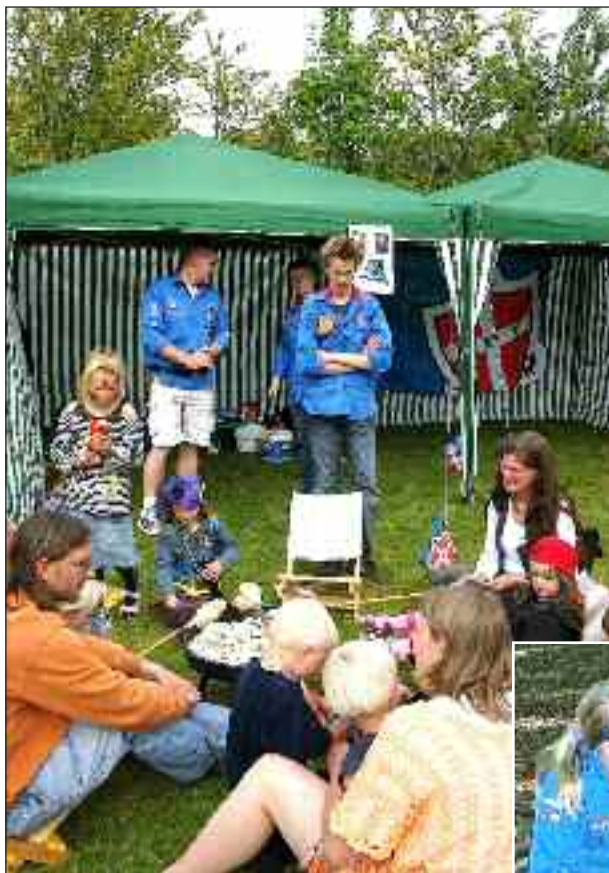
Velbesøgt årsmøde-telt i 2010.