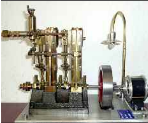
En af modellerne.