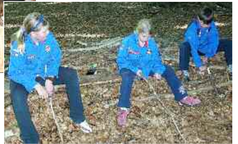
Pilte i gang med dolkemærket.