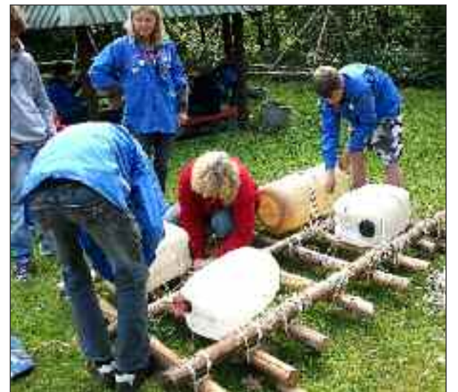
Tømmerflåden gøres klar til sejlads på Trenen.