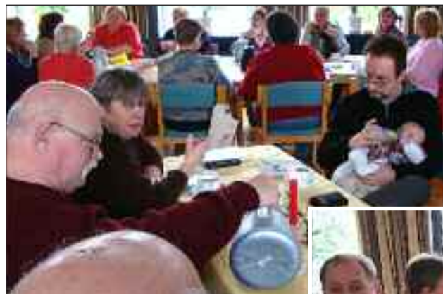
En lille tår til store og små.