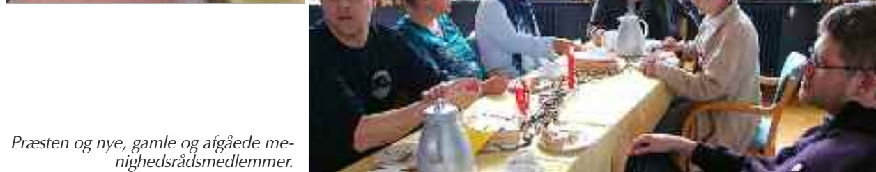
Præsten og nye, gamle og afgåede menighedsrådsmedlemmer.