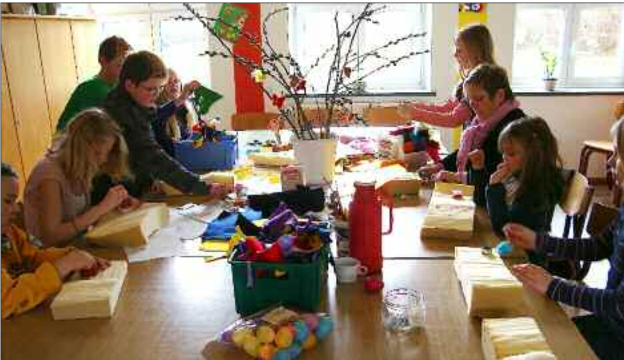
Der blev produceret påskepynt i lange baner.