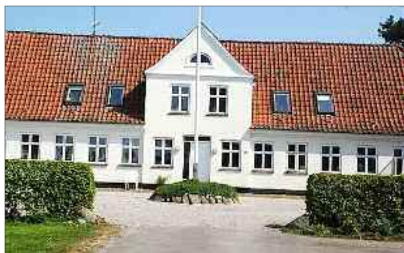
Helnæs Højskole.