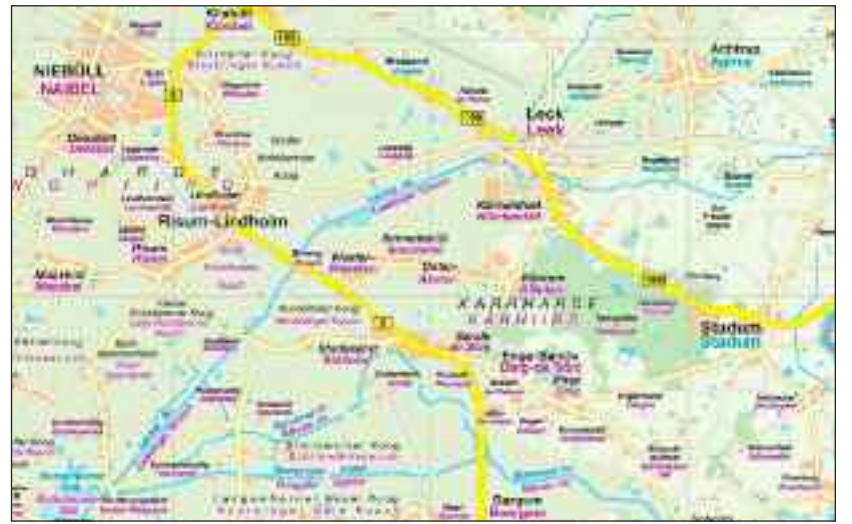
Dreisprachige Landkarte - je nach Sprachraum Deutsch-Friesisch und Deutsch-Dänisch.