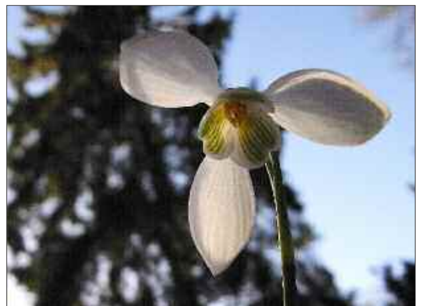
Kæl for dine billeder med Photoshop.