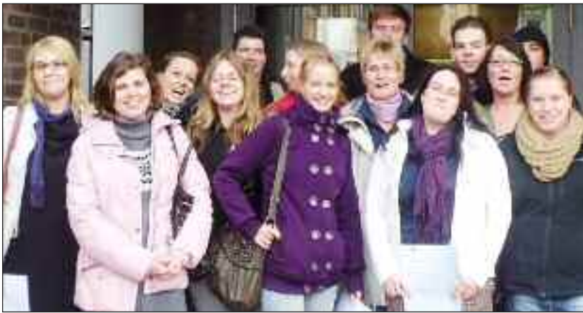
Die Teilnehmer.