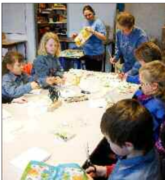
Puslinge og tumlinge i gang med forårspynt.

En væbner kaster sko op i Nørregade i Flensburg, en nyere væbneraktivitet for dem, der har fod på det...