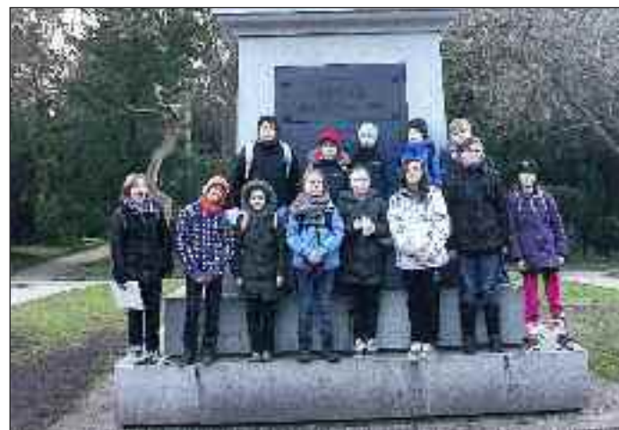
Pilte på historisk byløb i Flensburg, her på Den gl. Kirkegård.