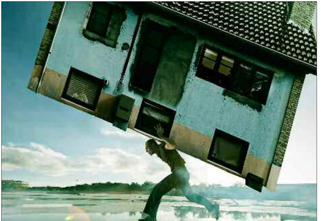
Fra Åben Dans forestilling "Jeg ved hvor din hus den bor".