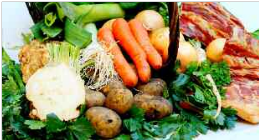
Efterårsmad for 50+.