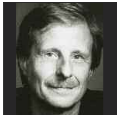
Kjartan Fløgstad.