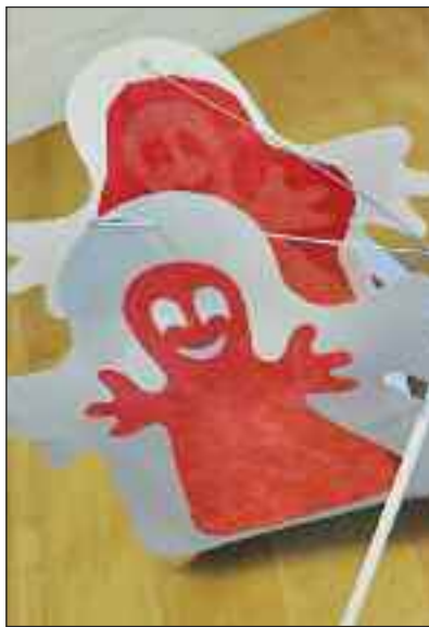
Lav dine lanterne selv.

Alle mødedage mødes deltagerne kl. 9.30 foran Klosterbäckerei ved Søndertorv og køber friske madvarer til vor udvalgte ret på torvet. Bagefter går man i samlet flok til Aktivitetshuset og tilbereder retten i Mødestedet. Efter tilberedningen hygger man sig med at spise og snakke sammen. Tilmelding påkrævet på tlf. 0461 150 140 eller mail akti@sdu.de.