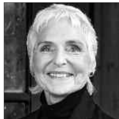
Herbjørg Wassmo.