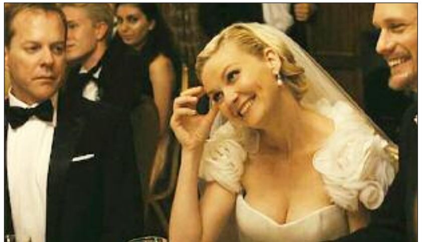
Fra Melancholia: Kirsten Dunst, Kiefer Sutherland og Alexander Skarsgård.