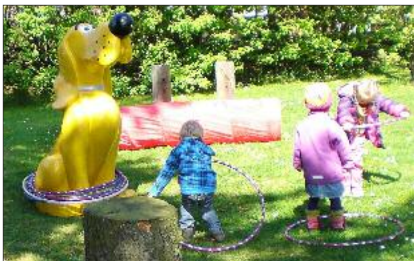
De små legede på plænen.