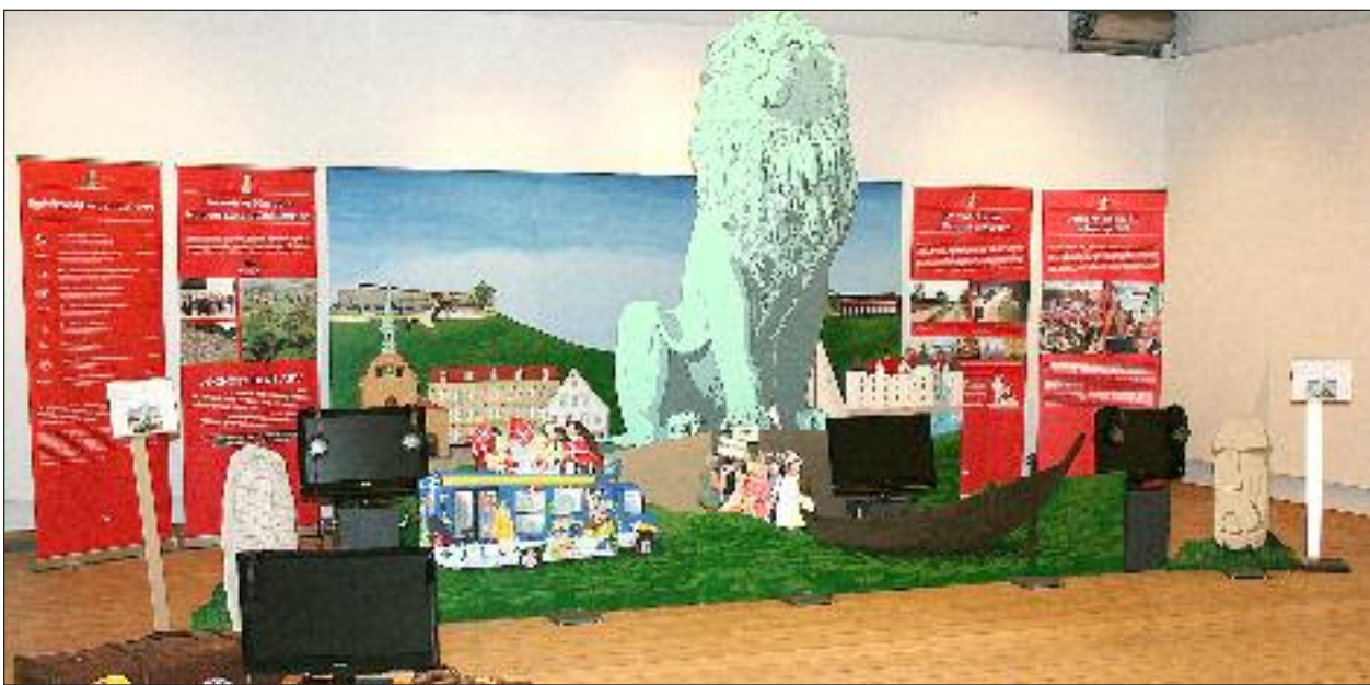
Udstillingen om det danske mindretal i Sydslesvig i Kongernes Jelling præsenterede sig flot i det store udstillingslokale.