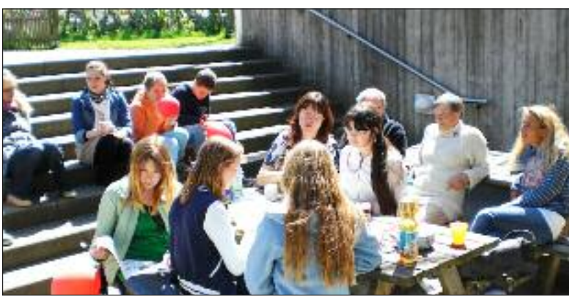
Nogle slikkede sol.