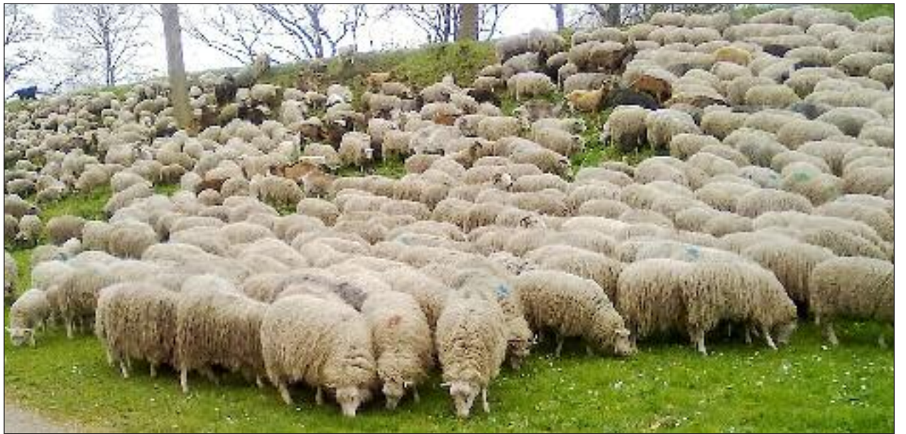
Vandrefår og -geder på Danevirke.