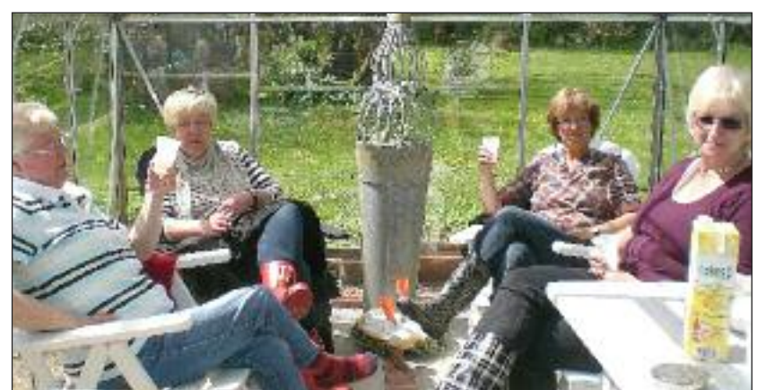
Men der var også tid til hygge og smalltalk.