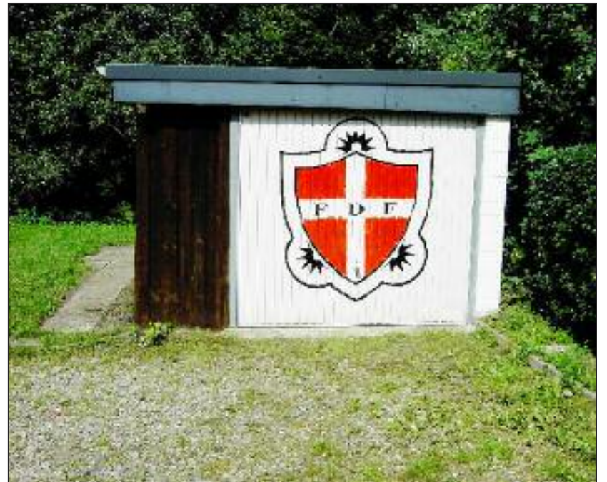
Ingen er i tvivl om, hvem der holder til her.