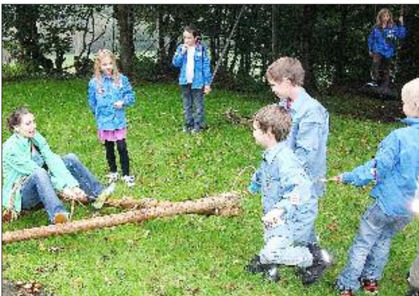
FDF er også at opleve fællesskabet.