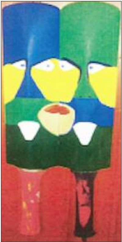
"I love cricket" af Carsten Nash.