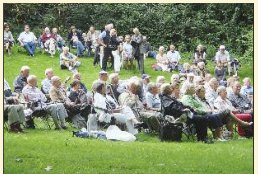
Der plejer at være rigtig hyggeligt ved folkemødet på Ejer Bavnehøj i genforeningstårnets skygge. Men husk klapstol, kaffe og paraply.