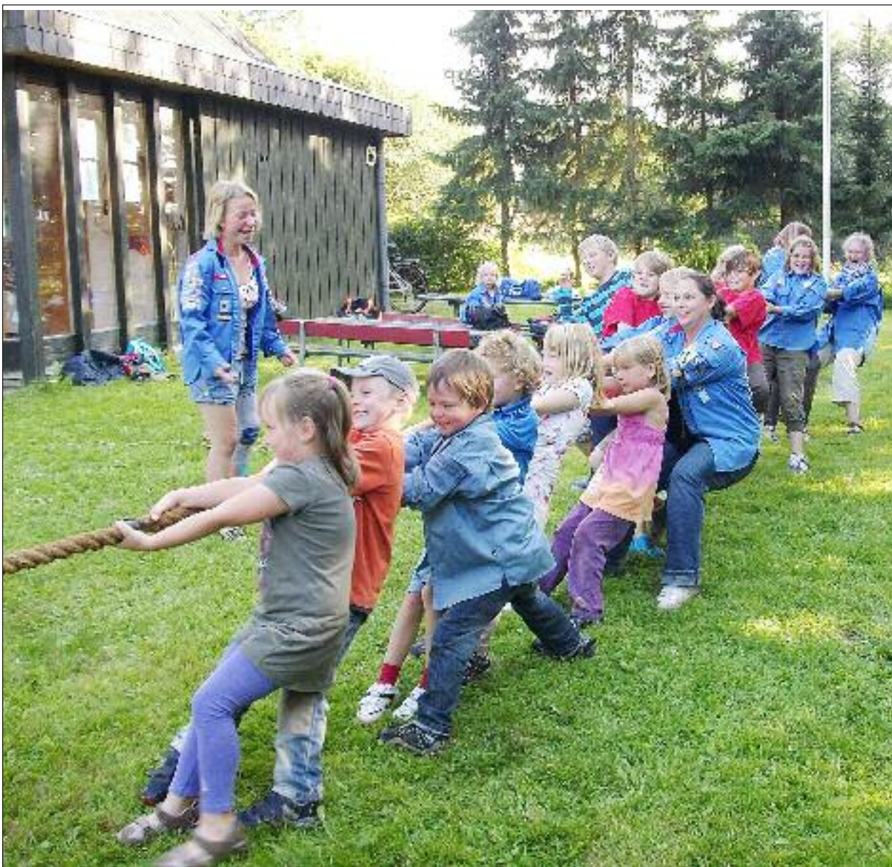
FDFerne trækker en god og spændende sæson igang.