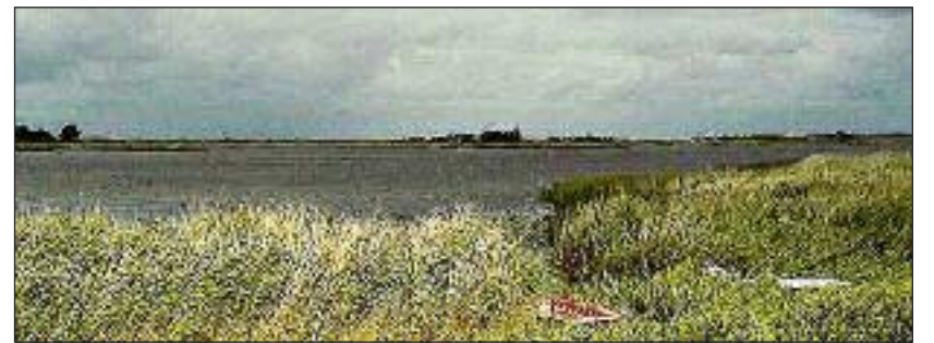
Rudbøl Sø er en del af grænsen. Vidåen løber gennem den på sin vej mod vadehavet.