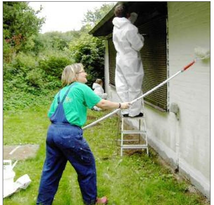
Fra arbejdsdagen 2008.