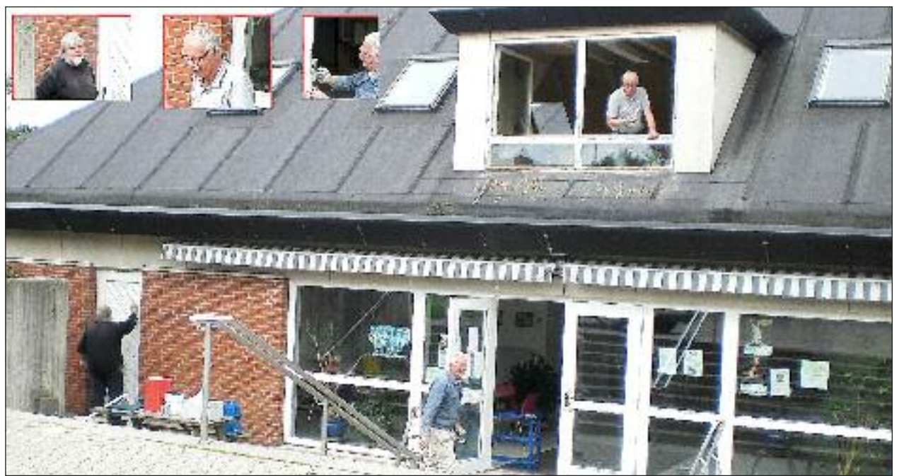
Gør det selv-mændene i fuld aktion omkring Kejtumhallen.