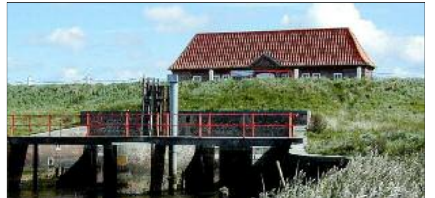
Også nord for grænsen regulerer sluser vandløbenes udløb i vadehavet, her Balmul sluse.