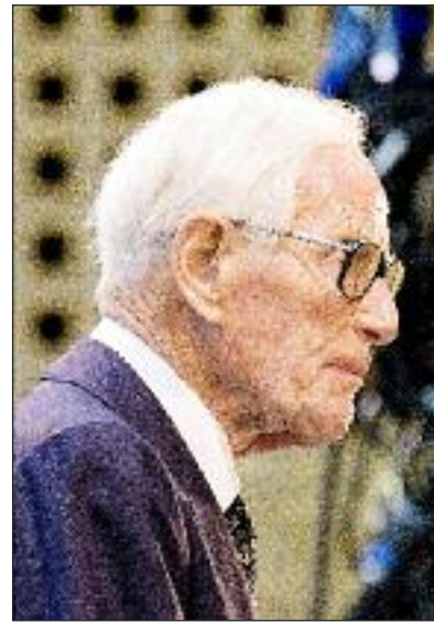
Mærsk Mc-Kinney Møller †

I dagene her har I og vi oplevet, hvad der er skrevet, talt, fortalt beundrende, belysende, betydningsfuldt, begavet om skibsreder Mærsk Mc-Kinney Møllers - landets store og tro søns - formåen, forpligtethed, familietroskab, faderbeundring, fortjenester, fædrelandskærlighed, fornemme fremtræden, forstand og fantasi, formue. Alt fortjent. Alt fortalt, så vi er