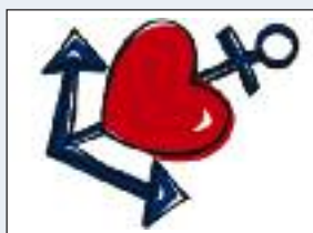
Logoet for de tyske evangeliske kirkedage i Hamborg 2013.

Når nu kirkedagene fejres i nabolaget, er det naturligt, at de danske