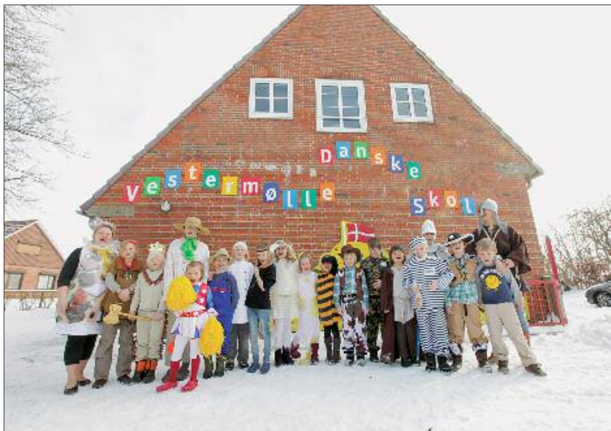
Illustration fra bogen: Dansk fastelavn på den sydligste danske skole i Vestermølle ved Ejderen.

Med sine korte stykker om konkrete historier og begivenheder – og ikke mindst den medfølgende DVD med rappe filmklip – er bøgerne især også målrettet på børn og unge i skoler og undervisning. Bogen er trykt i 4.000 eksemplarer – 2.000 i den danske udgave og 2.000 i den tyske. Bøgerne er også tilsvarende billige: 150 kr. pr. stk. – og rabat ved bestilling af klassesæt.