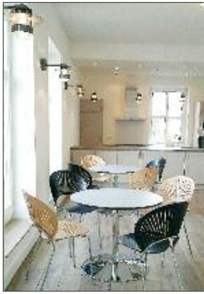
Interiør fra det nye danske kultur- og forsamlingshus i List.