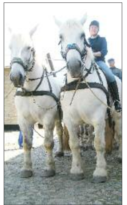
Der øves med de fire percheron-hestene.