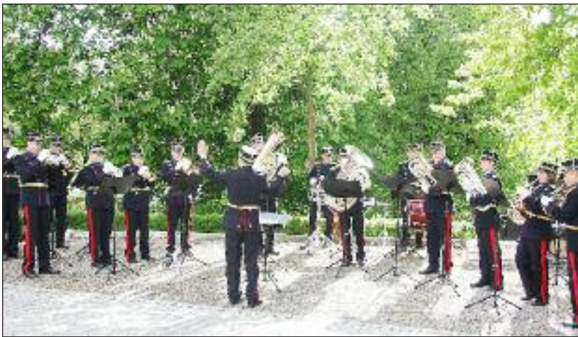
Slesvigske Musikkorps underholdt i haven.