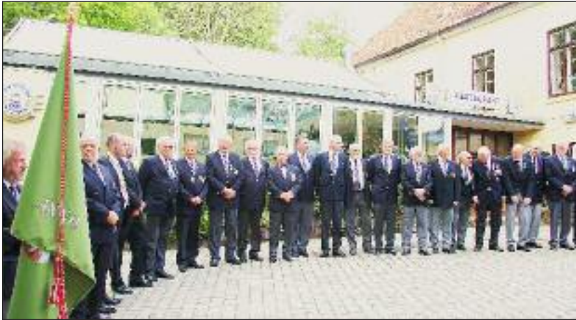
Forventningsfulde brødre opstillet foran St. Knudsborg.