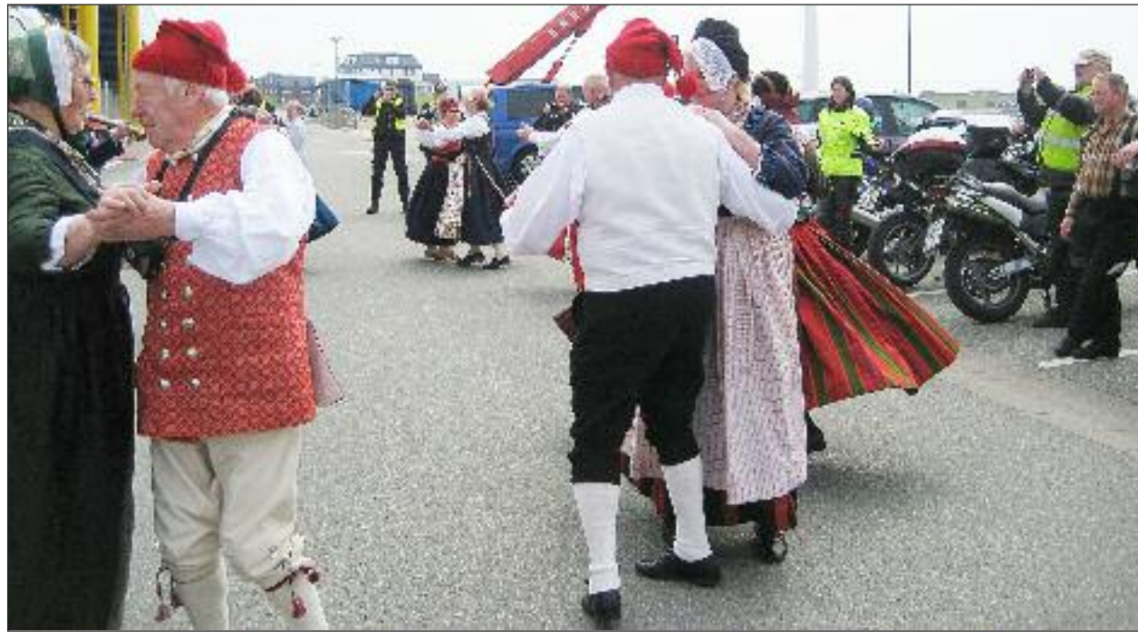
Der blev danset på kajen i Dagebøl - ikke mindst til moro for motorcyklisterne...