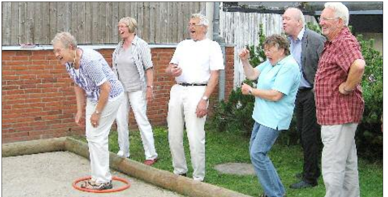
Petanque i Kejtum er hygge og glæde kombineret med fælles aktivitet.