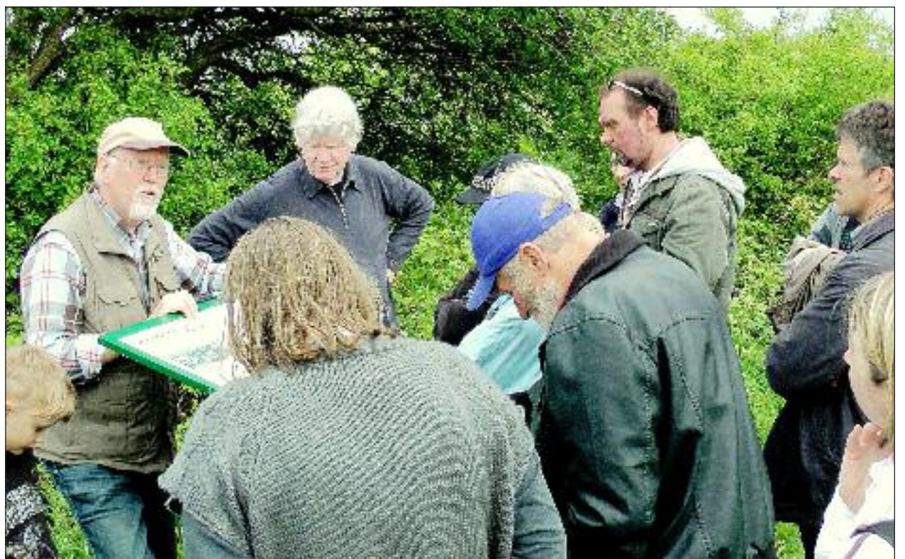
Guiden Christian fra Grænsforeningen i Sønderborg sørgede for, at deltagere fra Husum også fik øget kendskabet til grænselandets historie.