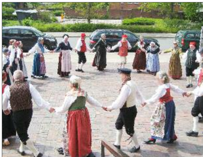
... og der blev danset ved Nissenhuset i Husum.