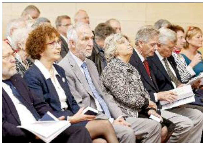
Kirkedagsgæsterne lyttede opmærksomt.