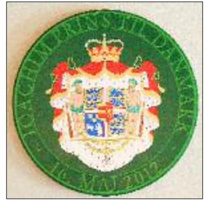
Prins Joachims våbenskjold i St. Knudsborgs festsal.