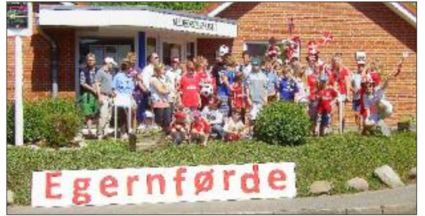
Afgang fra Egernførde.