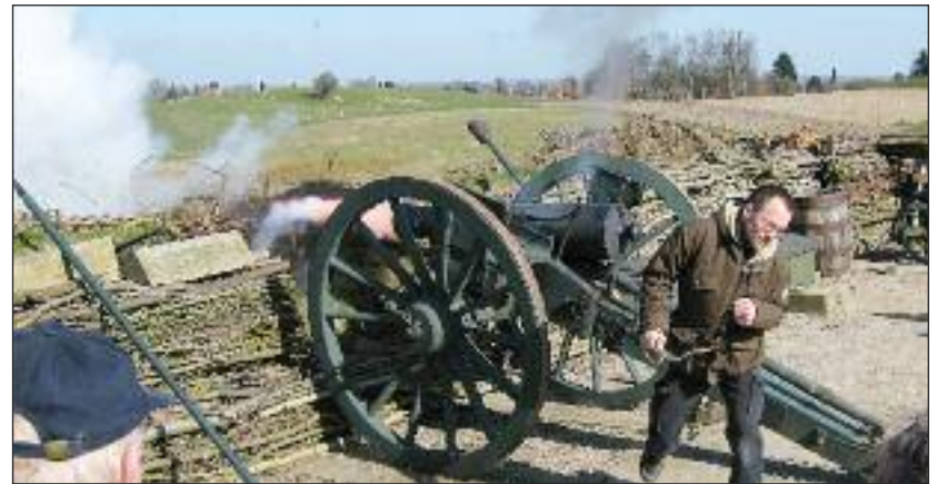
En kanon som denne på Dybbøl afleveres til Danevirke Museum på lørdag af Slesvigske Vognsamlings Venner i Haderslev.

Ud over konservering af egne vogne har de engagerede frivillige vognvenner brugt en del tid på andre spæn-