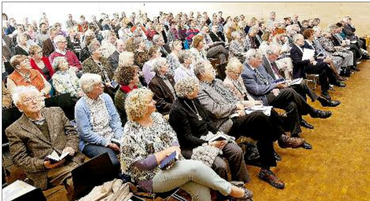
Fuldt hus til DKS-kirkedagen i koncertsalen på A.P. Møller Skolen i Slesvig.