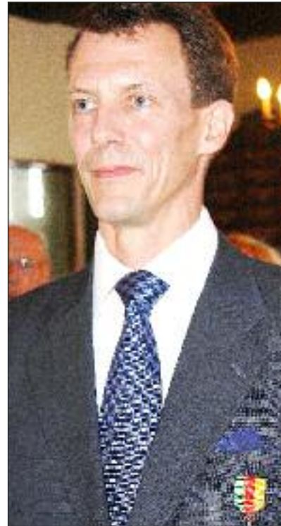
Prins Joachim - her med æresbrorbrønnen - er nu æresbror i St. Knudsgildet i Flensborg.