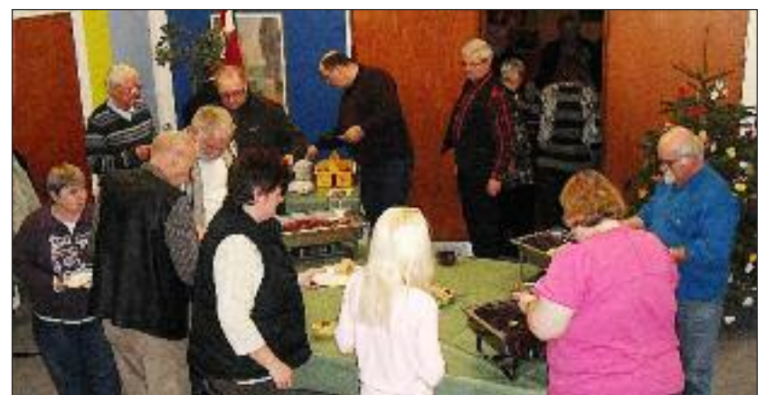
Kø ved buffetten.