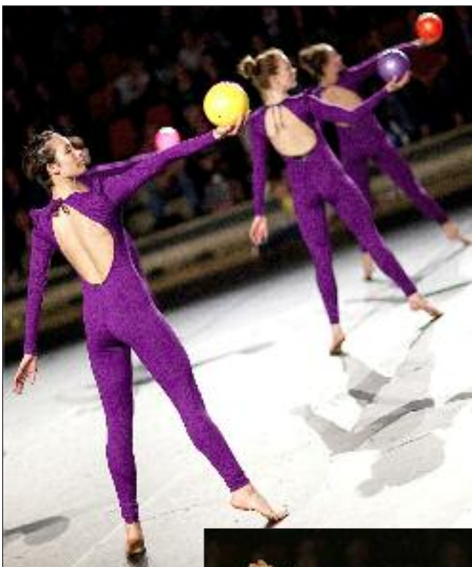
Ollerup Gymnastikhøjskole elitehold på A.P. Møller Skolen fredag den 13. januar kl. 19.30.