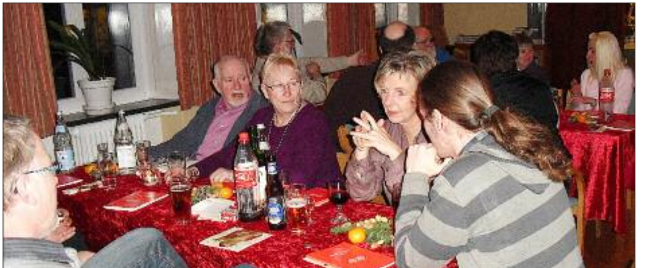
Hygge ved bordene.