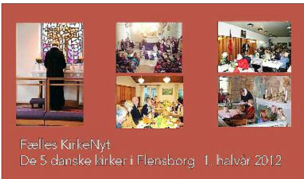
Fælles KirkeNyt De 5 danske kirker i Flensborg 1. halvår 2012