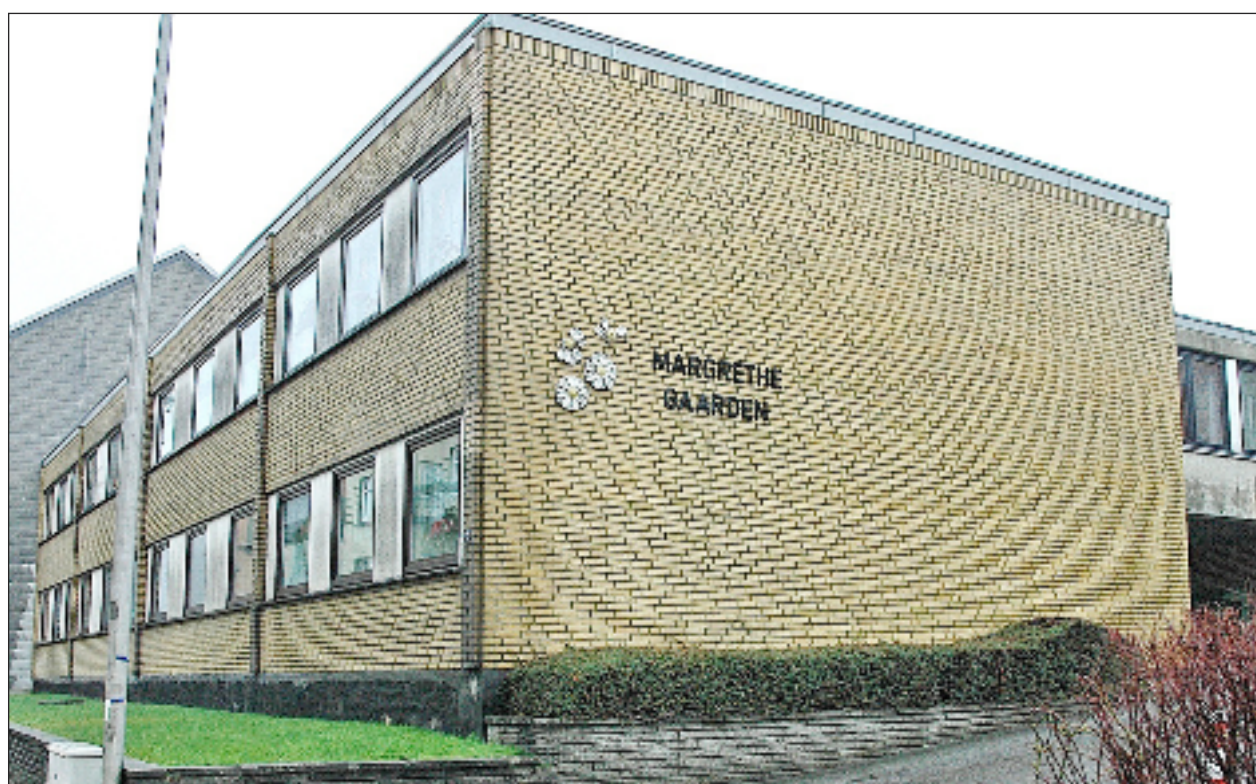
Margrethegården i Slesvig, et af flere danske ældrebolig-komplekser.