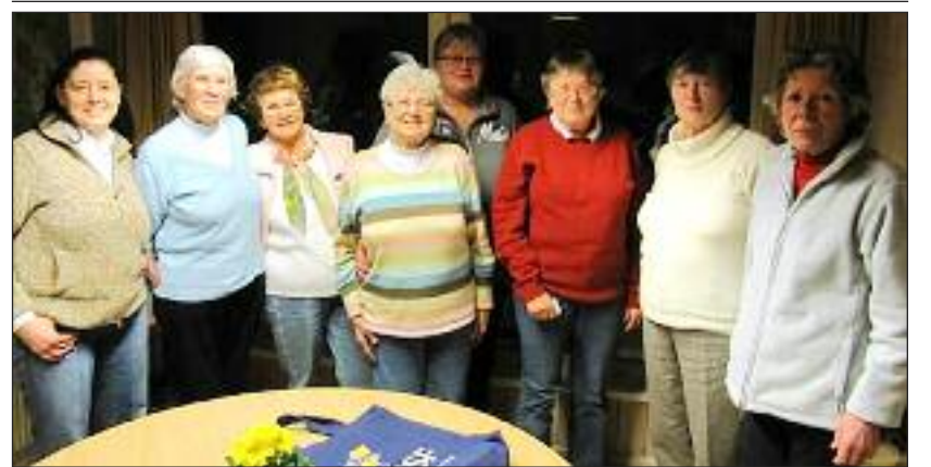
Den nye bestyrelse hos Aktive Kvinder Sild.