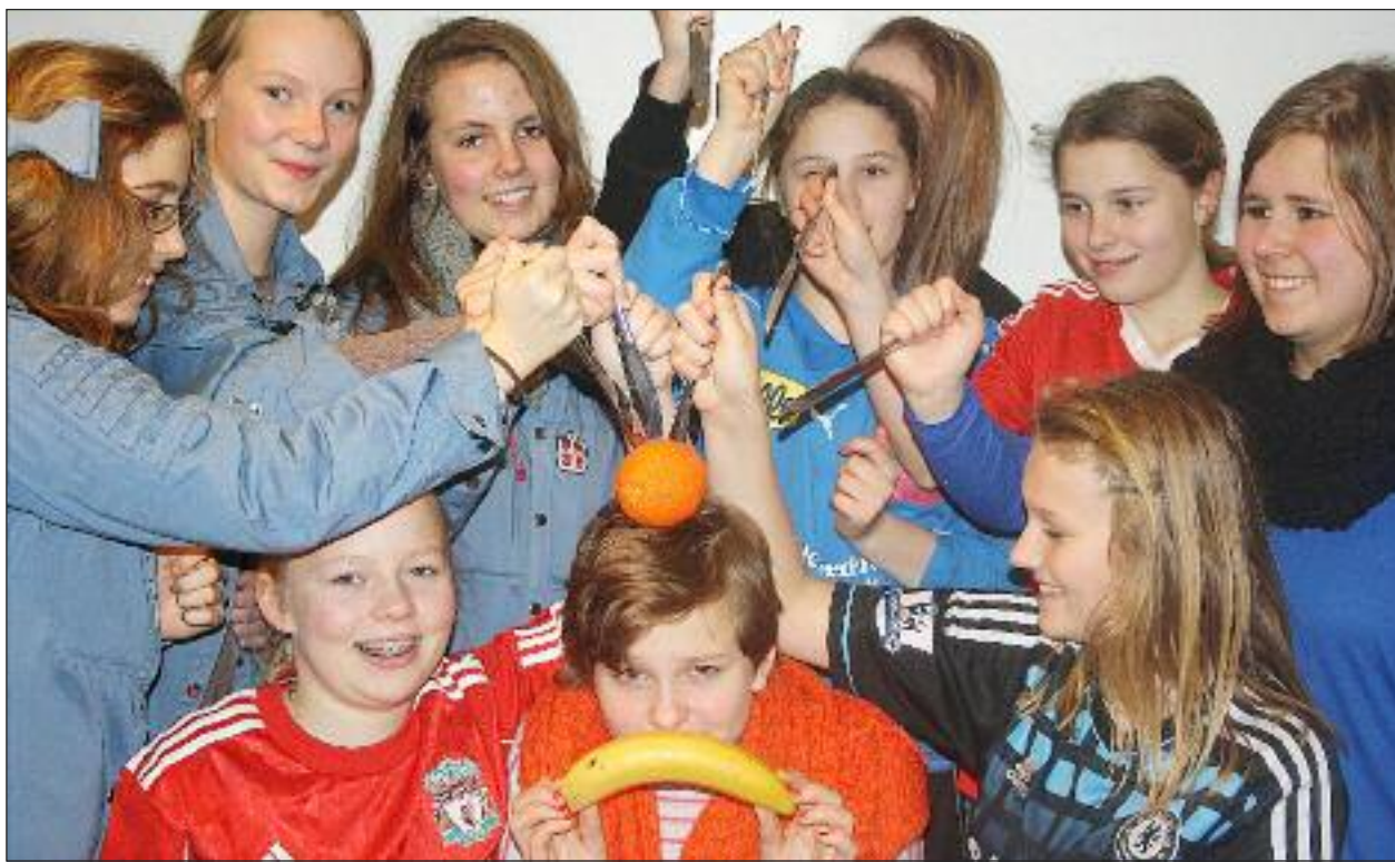
Kvikke piger - også fra Flensburg FDF - på væbner-weekenden på Kongeådalens Efterskole.