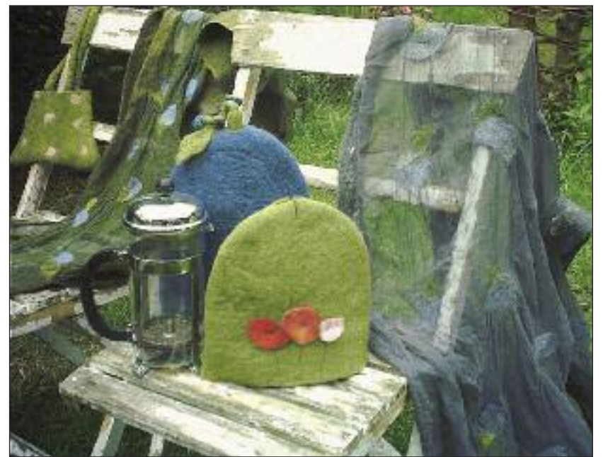
... og bl.a. i multikreativ filtning tilbydes.

Fredag den 17.2. kl. 17-20 og lørdag den 18.2. kl. 10-15 ved Lisbet Mikkelsen Buhl (27 euro).