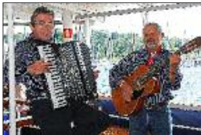
MoinMojn-Duoen fra Flensburg.