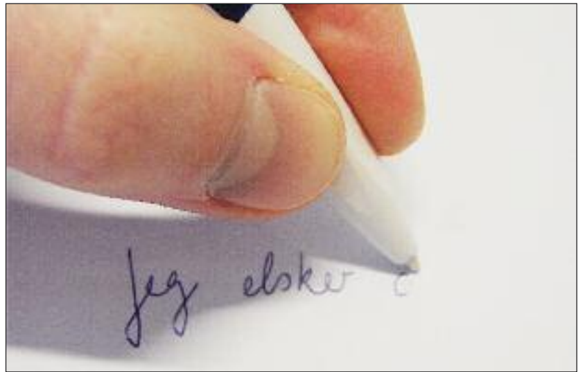
Kurser i fængende skrivning...