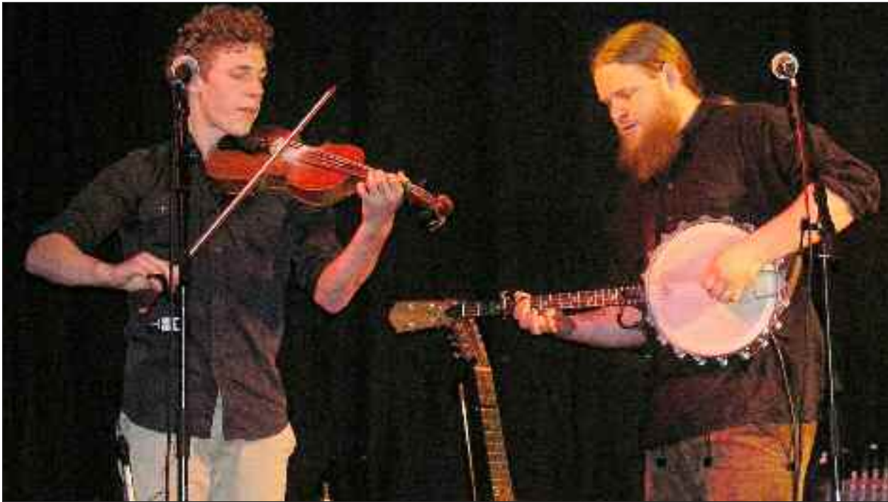
To af de fire Almost Irish-brødre.