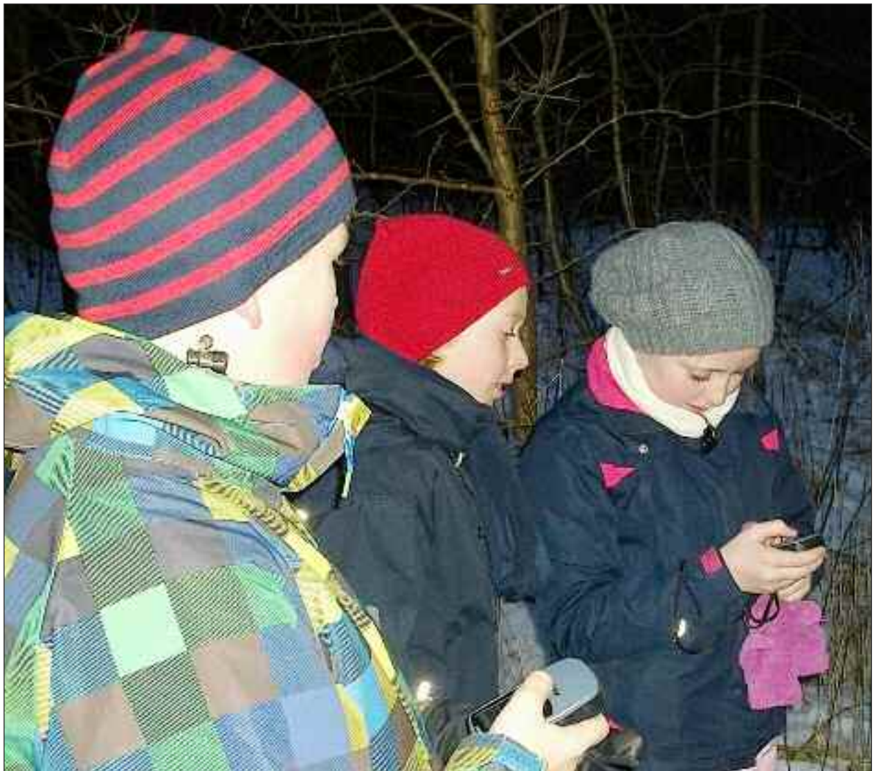
Pilte og væbnere indstiller deres GPS´ere.