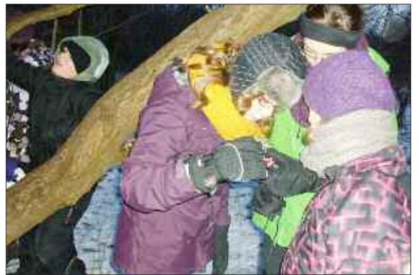
Pilte og væbnere ved en post ved et GPS-løb.