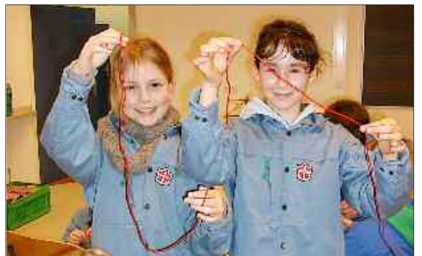
Aktive pilte på Cornelius Hansen-Skolen.