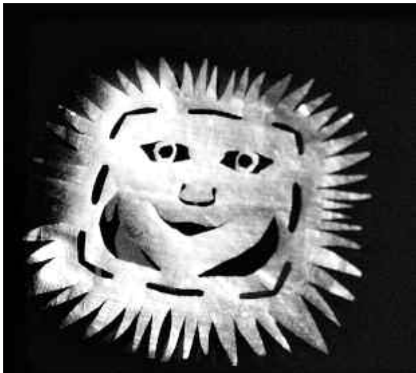
Papirklip-still fra filmen »Impromptu«.