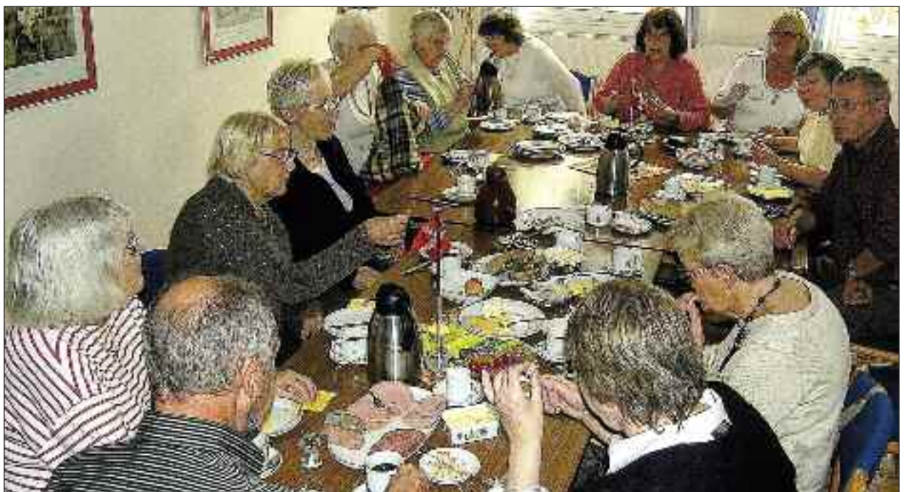
Der er altid kaffe på bordet, når fredagsklubben mødes.