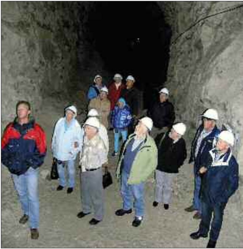
Der er flere kilometer underjordiske gange i Mønsted Kalkgruber. Og i nogle af dem er der høje hvælvninger.