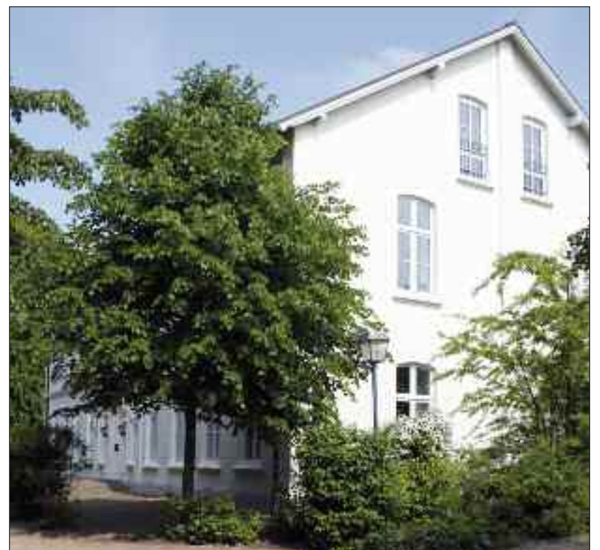
Die Arbeit des Nordfriisk Instituut (Foto) ist unverzichtbar für die fundierte Pflege der friesischen Sprache und Kultur, ist Ministerpräsident Torsten Albig überzeugt.

erstunde für seinen Mitbegründer ausgerichtet. Aktuelle Berichte und Buchbesprechungen runden Nordfriesland 182 ab. Das Heft umfasst 32 Seiten, kostet 3 Euro und ist erhältlich über den Buchhandel oder beim Nordfriisk Instituut.