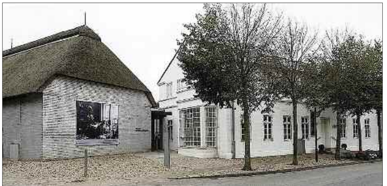
Kunstmuseet i Alkersum.