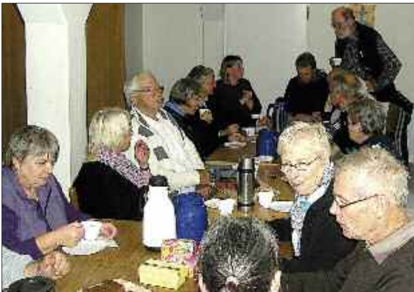
Hos Grænseforeningen i Viborg blev der serveret kaffe og kage.