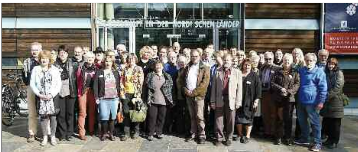
SSWerne foran de nordiske ambassaders fælleshus i Berlin.