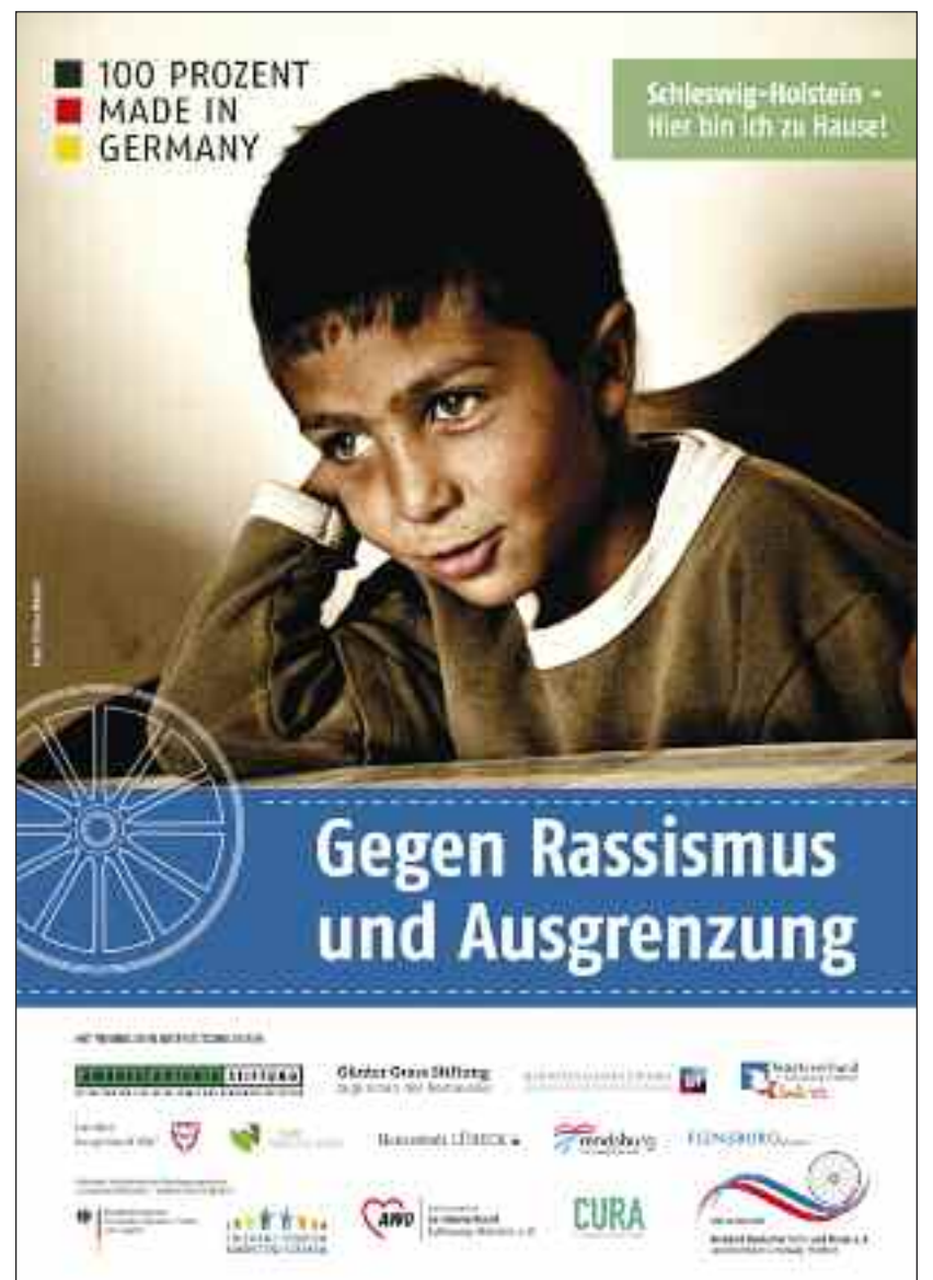
100% Made in Germany.

Bundestagswahl in den Straßen verschiedener schleswig-holsteinischer Städte aufhängen lassen. Es war als Aufruf zu verstehen, am 22. September keinen rechtsradikalen Parteien Tür und Tor zu öffnen. Ein weiteres Plakat, ohne Wahlauftrag, wurde u.a. an Schulen, kommunale Einrichtungen und Jugendzentren verteilt. Die Finanzierung dieser Aktion ist nur durch die großartige Unterstützung freier Träger, Ministerien und Ämter möglich gewesen, wie der Amadeu Antonio-Stiftung, der Günter Grass-Stiftung zugunsten des Romavolks, dem Beratungszentrum gegen Rechtsextremismus SH, dem Bundesministerium für Familie, Senioren, Frauen und Jugend, dem AWO-Landesverband SH sowie beim Städteverband SH. Der Dank der Veranstalter gilt weiter all den Bürgern, Vereinen und Verbänden, die ihre Solidarität bekundet haben, die Plakataktion aktiv unterstützen, aufstehen und gemeinsam dafür sorgen, dass es für Rechtspopulismus und Rechtsradikalität in diesem Land keinen Platz gibt.