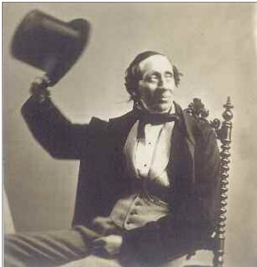
H.C. Andersen 1865.