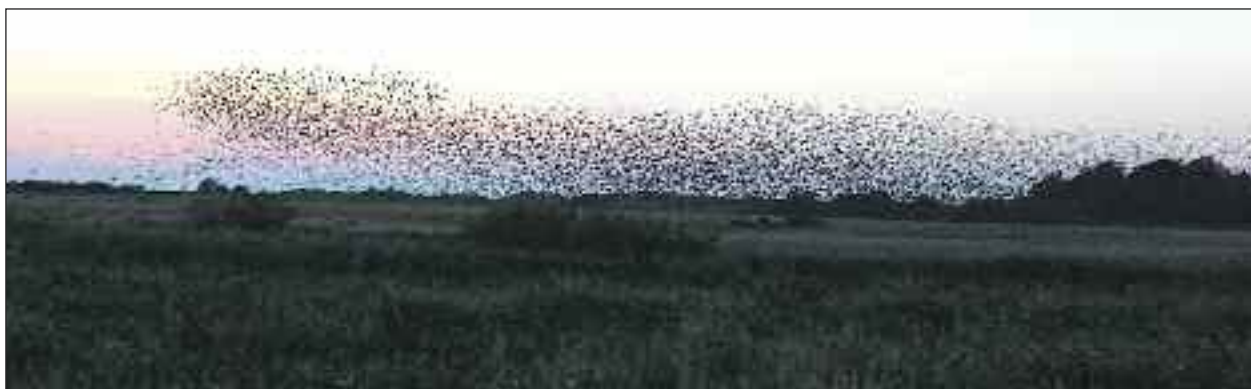
Sort Sol over marsken.