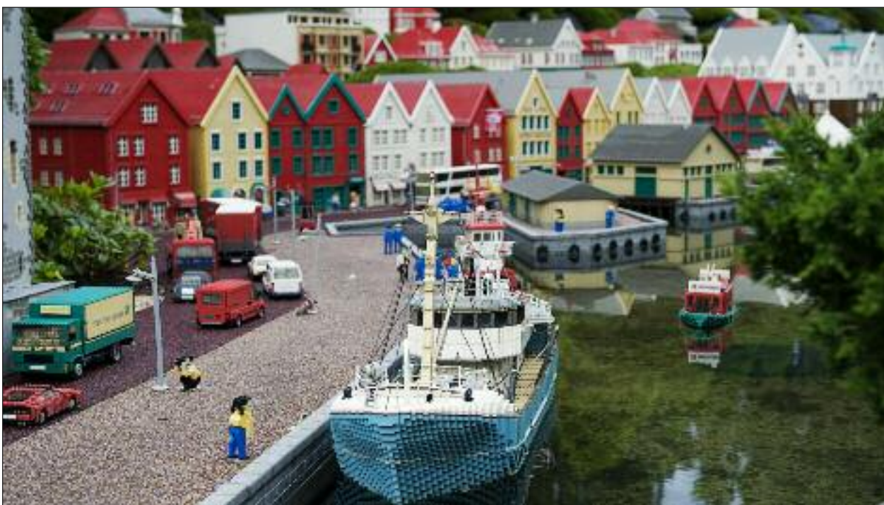
Legoland – det er imponerende legomodeller, som her Bergen.