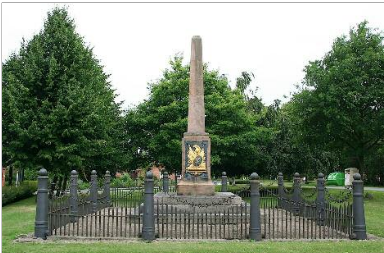
Mindesmærket ved Sehested(t).