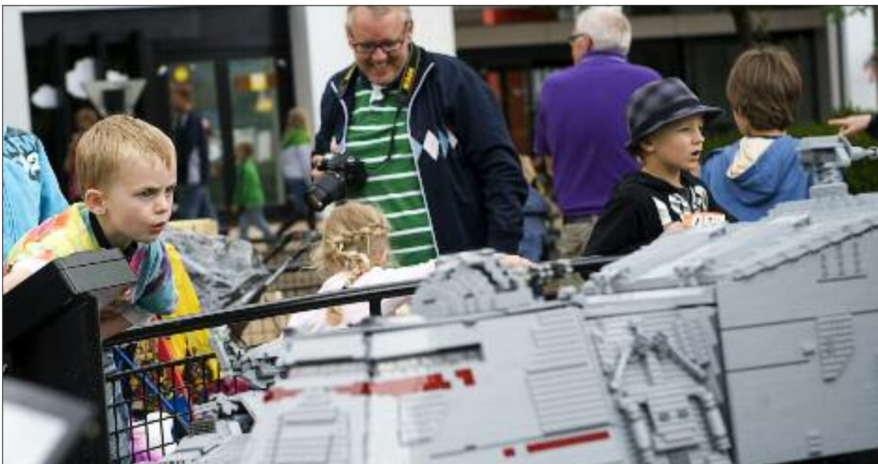
Og Starwars-modeller af legoklodser.