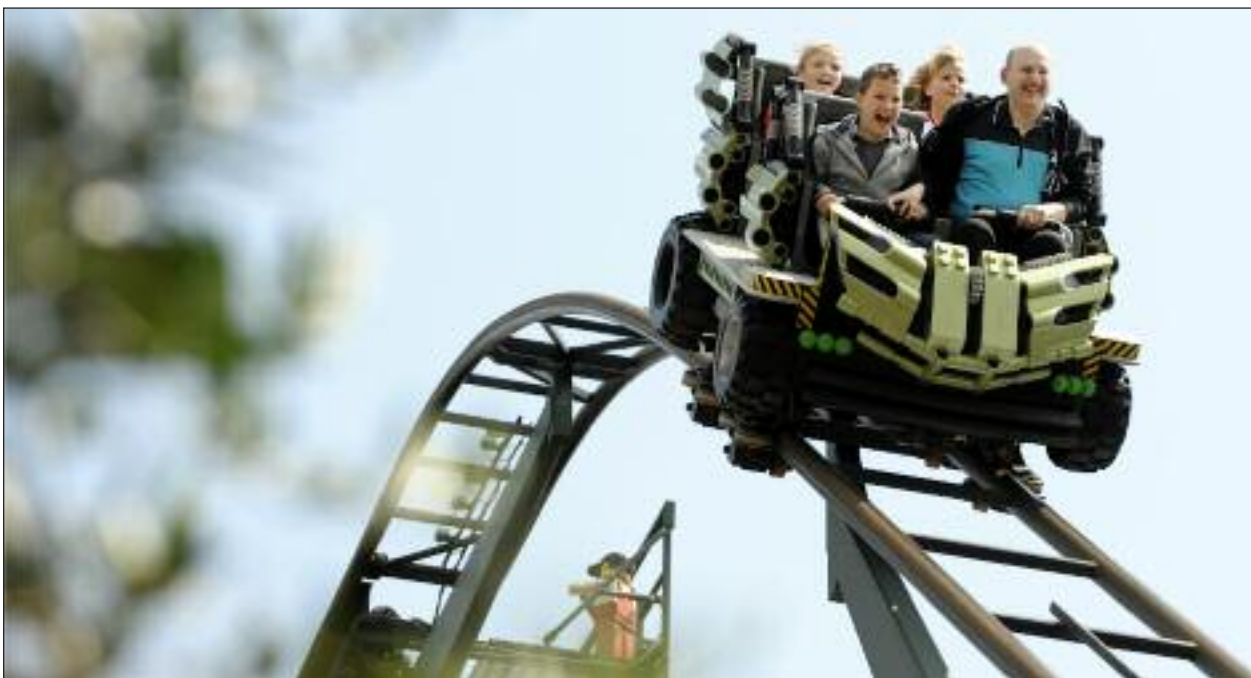
Det er XtremeRacers.