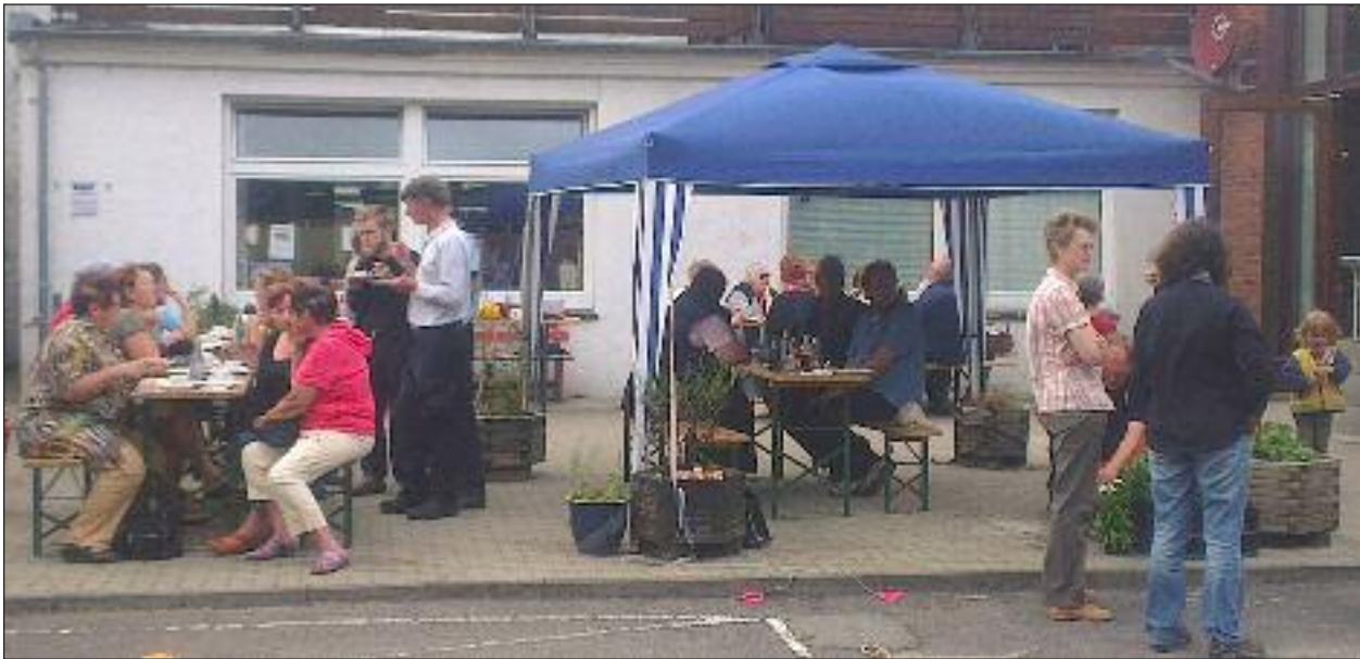
Hygge og snak på terrassen bag Husumhus.