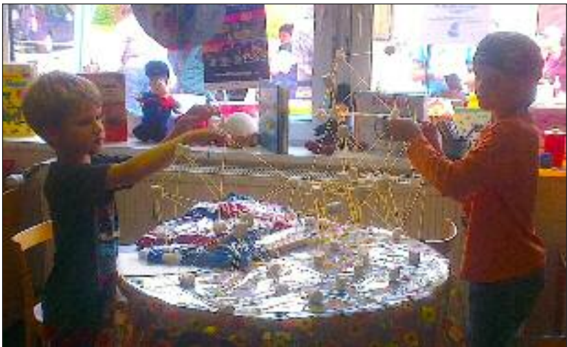
Tårnbyggeri med spaghetti og skumfiduser.