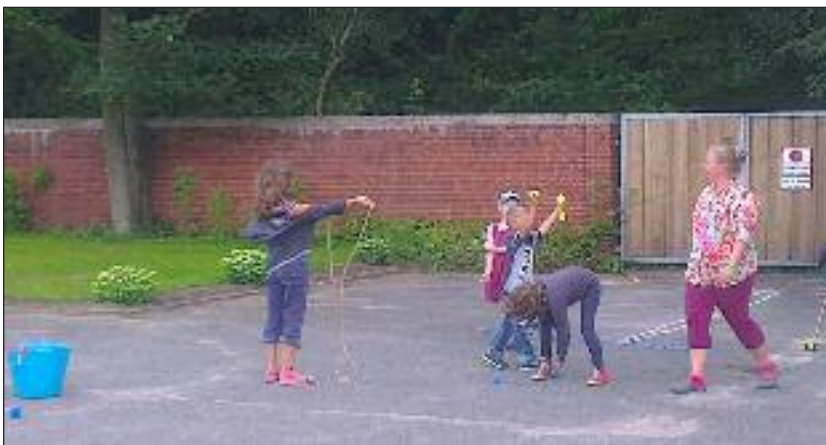
Klar til æggeløb og sjippetov; t.v. den nye plæne.