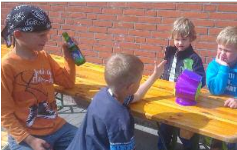
Lidt skeptiske blikke omkring sæbeboble-maskinen.