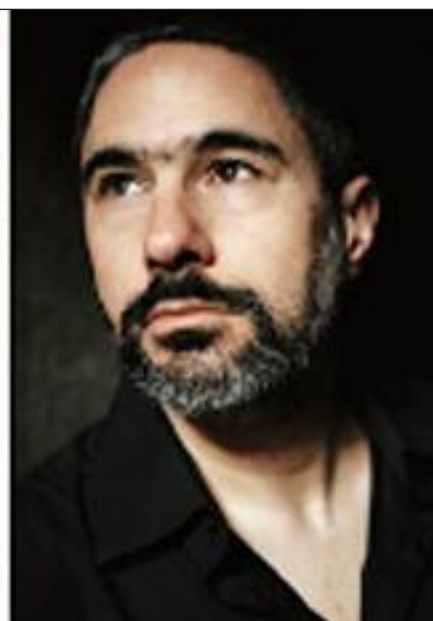
Verdenspremiere: Mads Vinding, Marilyn Mazur og Jean-Michel Pilc danner en trio.