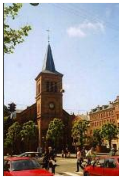
Stefanskirken på Nørrebrogade i København.

at de føler sig danske. Denne aften i Stefanskirken på Nørrebro går deltagerne i dialog om,