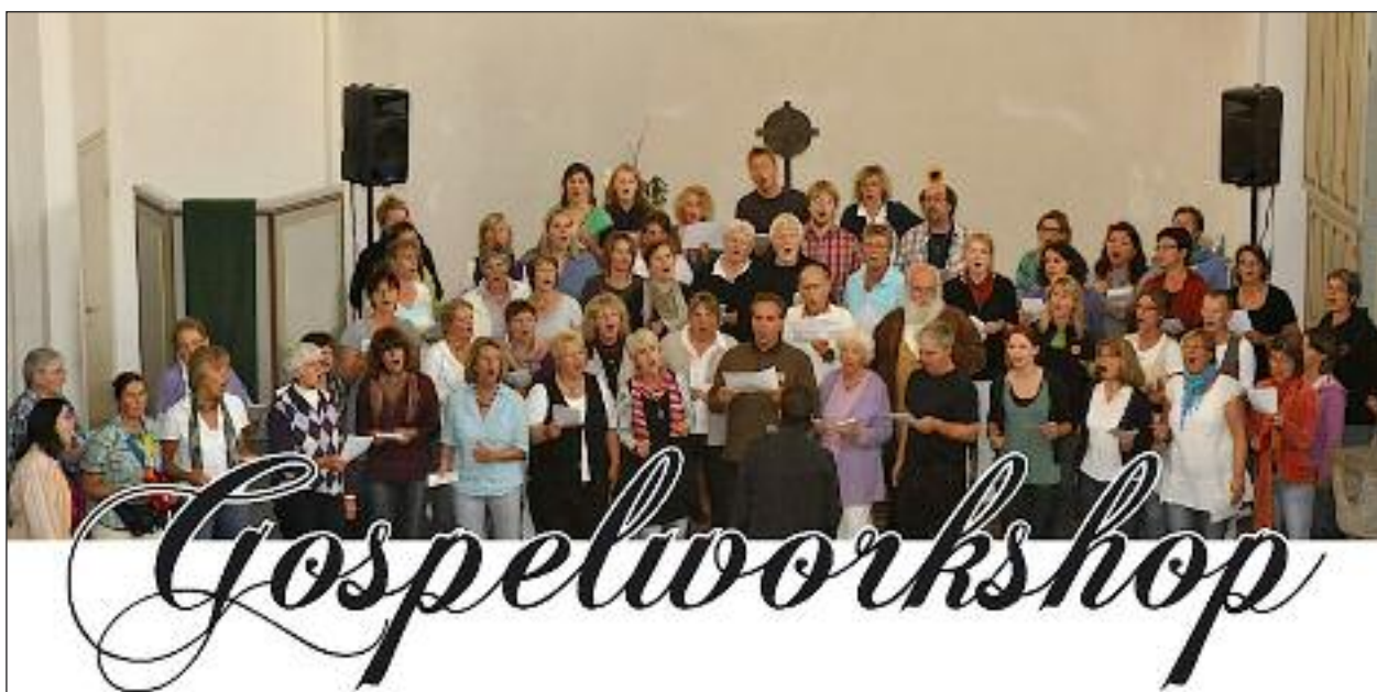
Fra en tidligere gospelworkshop i Vesterland.