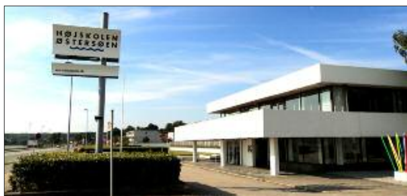
Højskolen Østersøen i Aabenraa.

På kurset kigger man nærmere på eksempelvis nye kulturer, nye demokratier, sociale medier, historiske perspektiver, åbne grænser, økonomiske kriser, ekstremisme – for blot at nævne nogle emner. Man kommunikerer sammen, opbygger europæiske netværker, oplever gensidig forståelse – men oplever også idræt og anden udendørs aktivitet. Her får man inspiration og nye venner, lover højskolen. www.hojoster.com