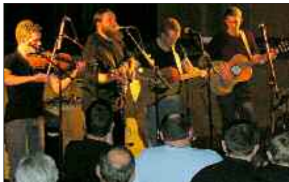
De fire brødre spillede, så taget var ved at løfte sig.