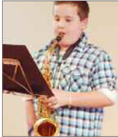
... og på sax.