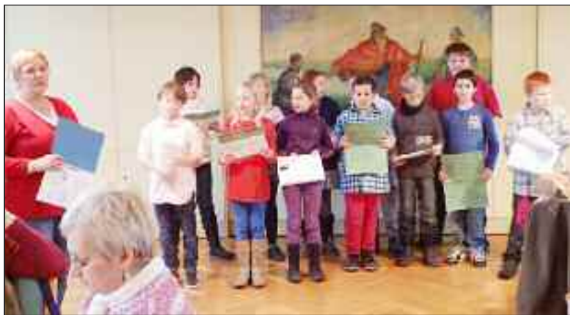
Eleverne fra Uffe-Skolen sang...