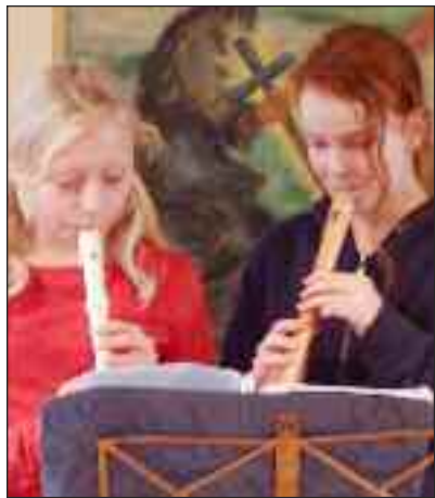
... spillede på blokfløjte...