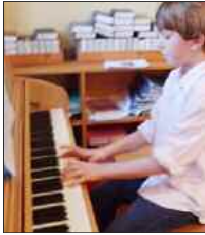
... på klaver...