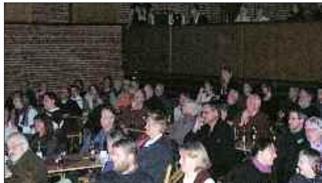
Fuld hus på Husumhus.