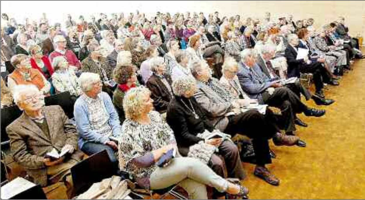
Menighedsrådsmedlemmer, præster og gæster til kirkedage på A.P. Møller Skolen i Slesvig.