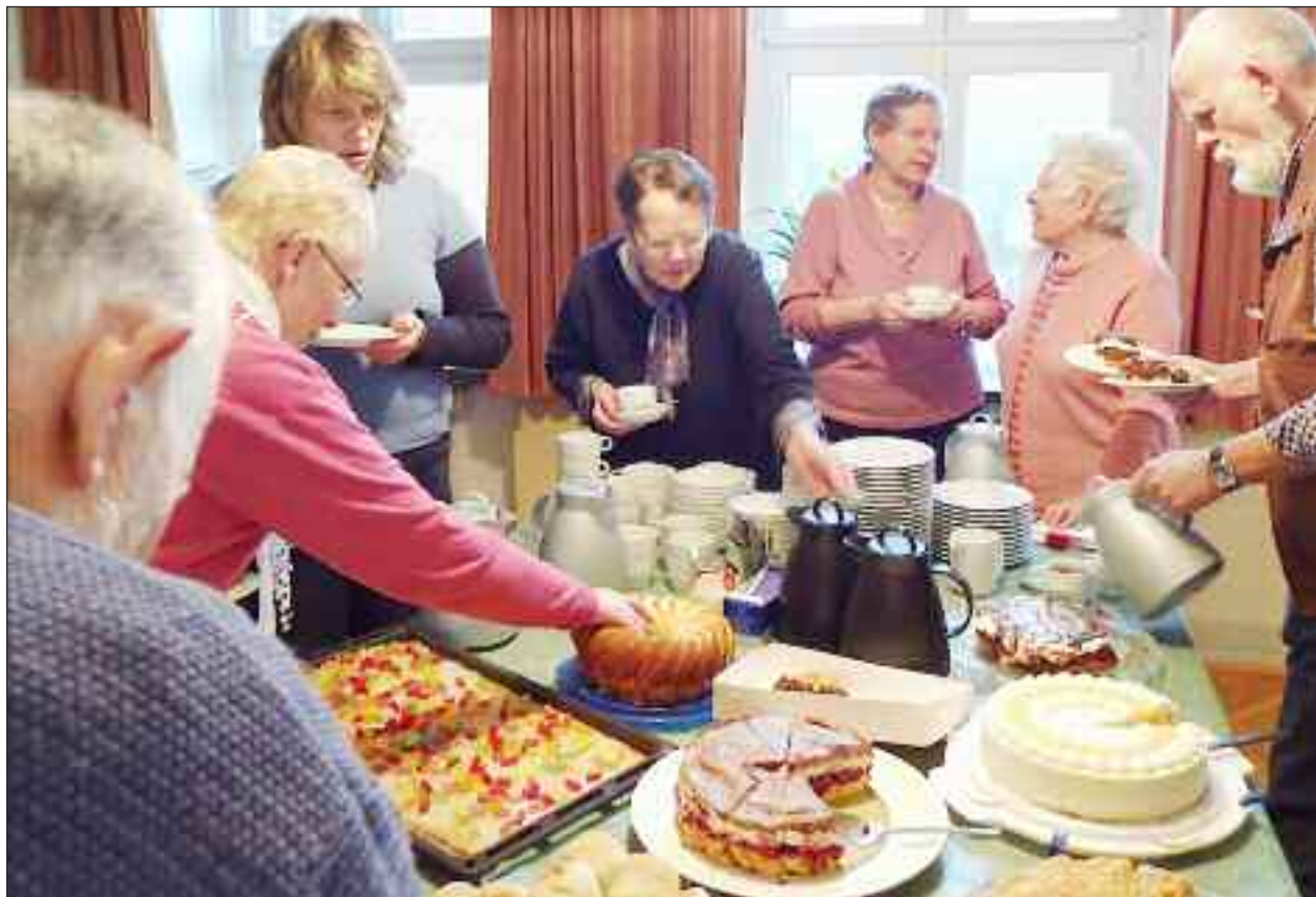
Og så var der kaffe- og kager, som eleverne havde bagt.