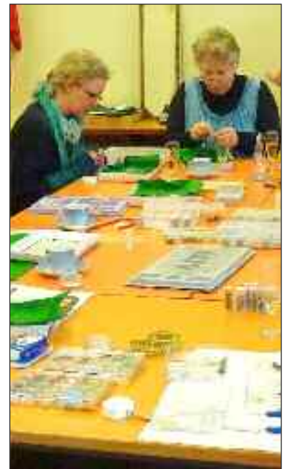
Fra et tidligere kursus.