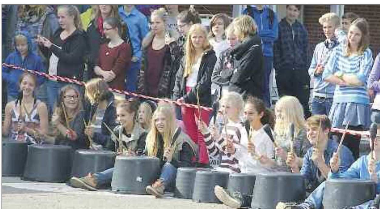
Unge, der havde det hylesjovt på Cornelius Hansen-Skolen.