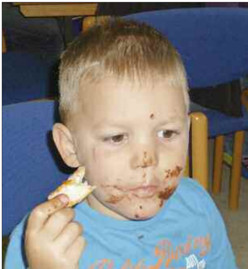
Jubi - der var også kommet nutella på bordet, idet børnehavernes kostpolitik jo ikke gælder om lørdagen, så det var der flere, der nød godt af.