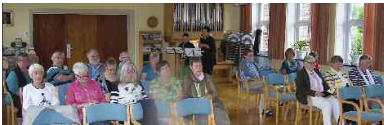
Fra guldkonfirmationen i Tønning 2013: Med Leonard Cohens Halleluja på sax (i baggrunden).