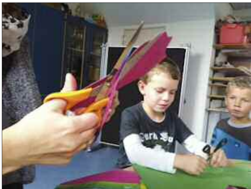
Kreativitet i højsædet.