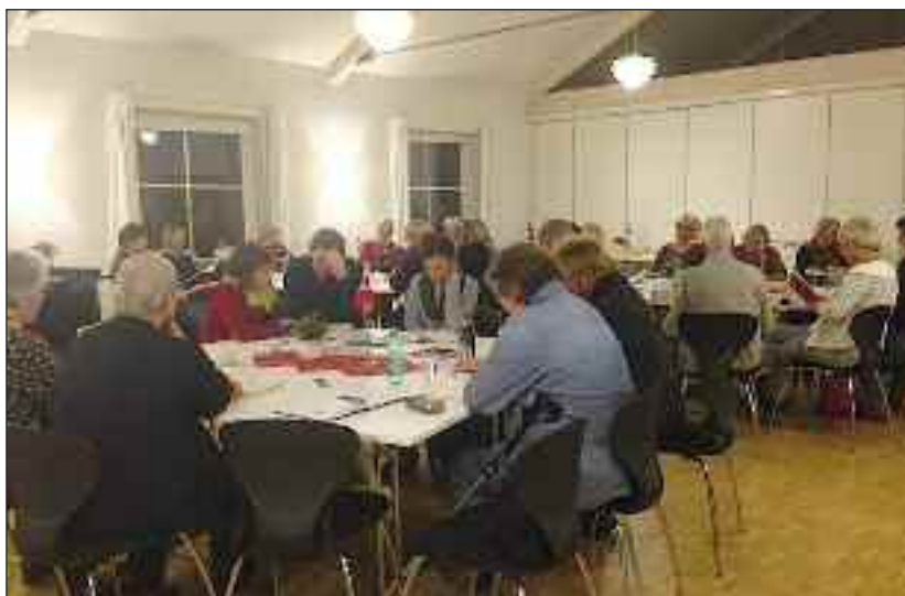
Alle tiders aften med sange, information og hyggeligt samvær i Ejderhuset i Bydelsdorf.