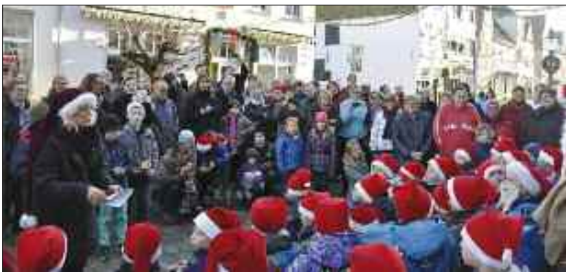
I Frederiksstad bruger man også julebasaren til at gøre mindretallet synligt i gadebilledet.