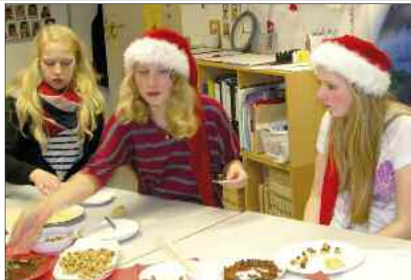
Der er altid gang i den, når der er julestue i Bredsted. Her fra konfekt-køkkenet sidste år.

[KONTAKT] Julebasar i Nibøl Danske Skole, 23. november 11-16: Gløgg, kaffe og vand, kager, friskbagte æbleskiver. Stor tombola.