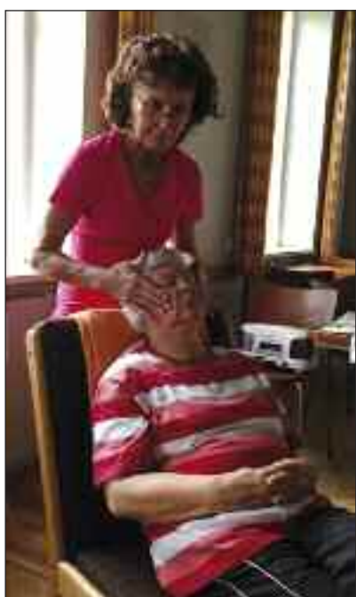
Ansigtssmassage gør godt.

[KONTAKT] Er man stresset og udkørt efter en hård uge, så er wellness lige det rigtige for at slappe af og føle sig godt tilpas og samle nye kræfter. Efter en lang uge var det så vidt forleden: Der var wellnessdag på Skipperhuset i Tønning. Efter en lækker morgenmad med alt, hvad man kan tænke sig af grøntsager, frugt og rundstykker plus sekt, og en hyggesnak blev de 13 deltagere delt op i to grupper, hvoraf den ene fik en ansigtsbehandling, mens den anden lavede gymnastik. Siden skiftedes holdene.