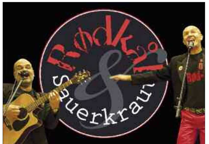
Rødkål og Saurkraut kan få latteren til at rulle. Men også stimulere eftertænk-somheden.