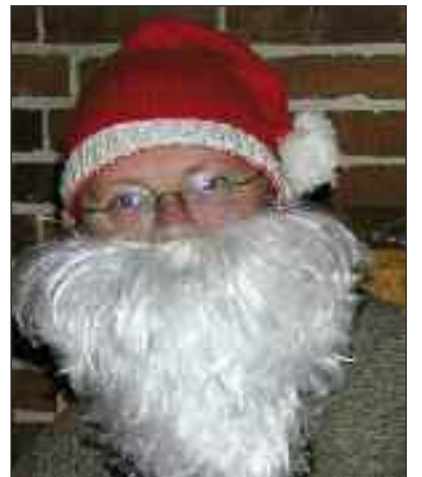
Sandsynligvis vil denne formummede julemand spille for til fællessangene.