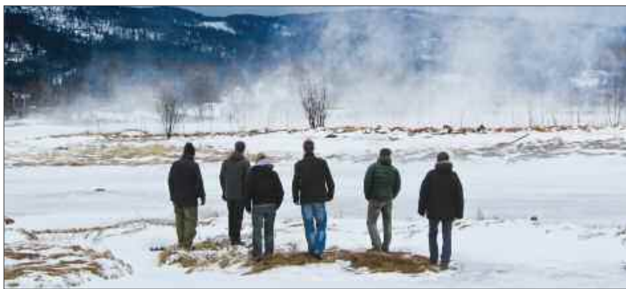
Basix – klar med to julekoncerter i Sydslesvig næste uge.