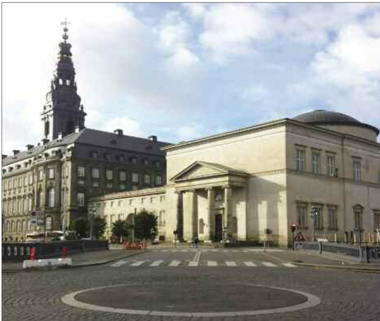
STAT og KIRKE, her Christiansborg og Christiansborg Slotskirke.