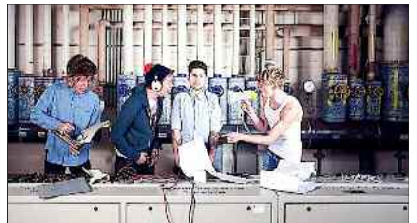
Ludwig Van - i Flensborg igen.

Billetten koster 12 euro; for medlemmer 10 euro, og de fås hos SSF Flensborg By, tlf. +49 461 14408 125, i Aktivitetshuset i Flensborg - samt ved indgangen.