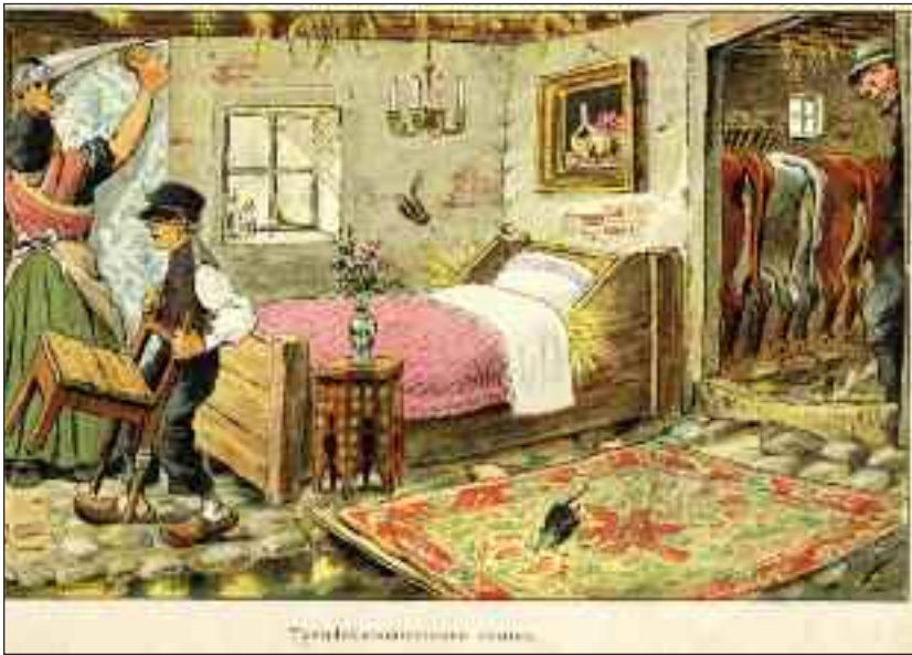
Fra Blæksprutten 1905, tegning af Axel Thies: "Tyendekommissionen ventes".