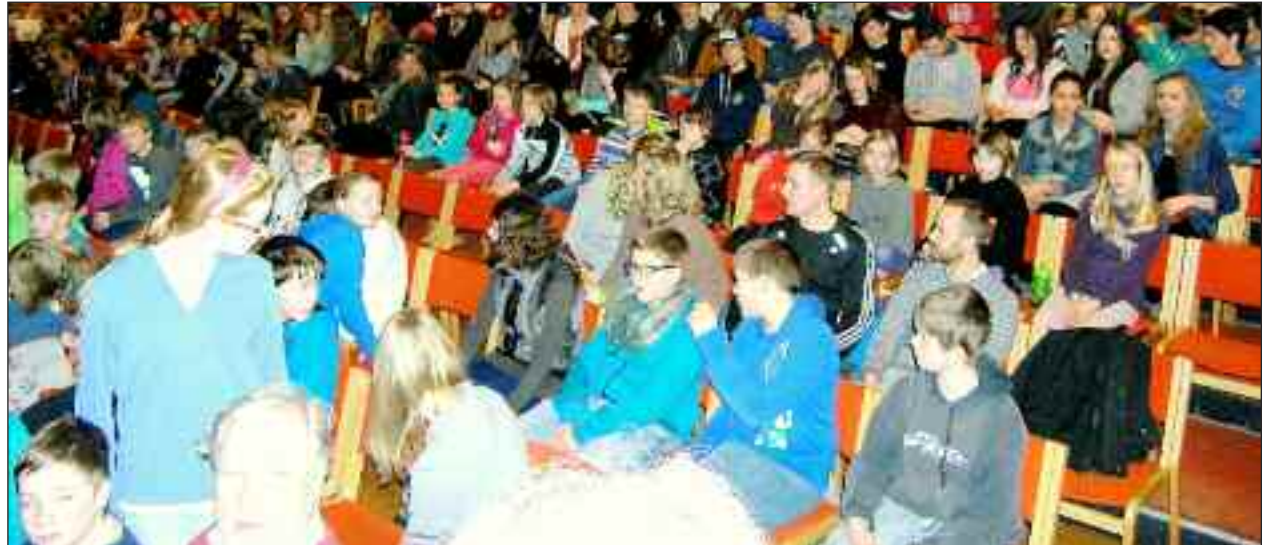
Skolebørnene fyldte godt op i Husumhus.