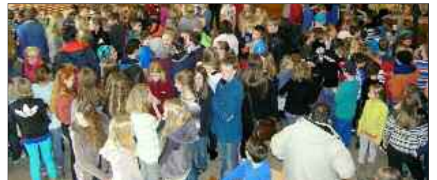
Også i foyeren.