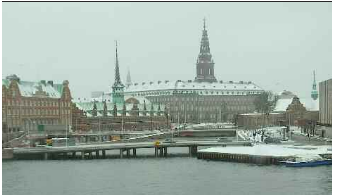
Christiansborg og beslutningstagerne dér opsøges i al slags vejr.