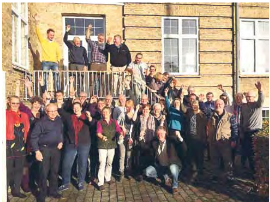
Grøpebillede med de fleste af deltagerne.