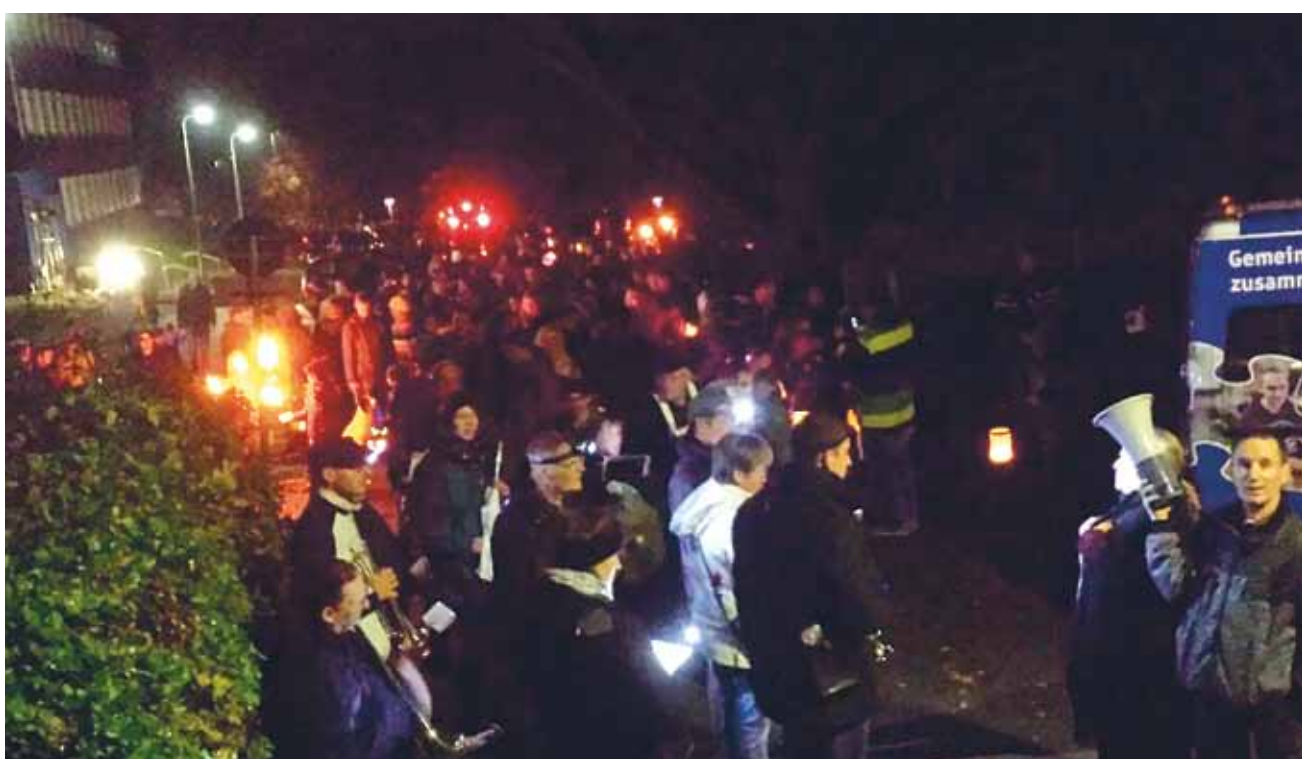
Nogle af deltagerne.