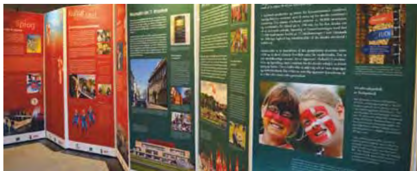
Nogle af plancherne.