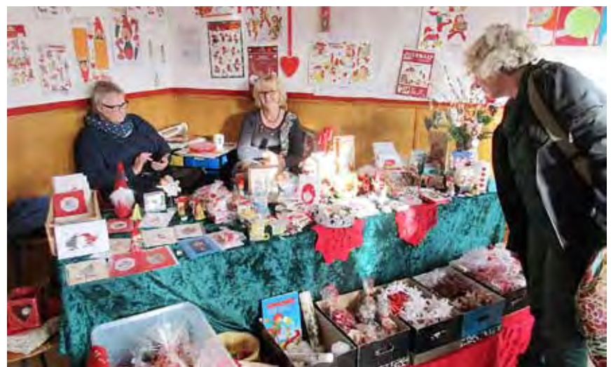
I hvert hjørne på skolens nederste etage var der indrettet salgsboder.