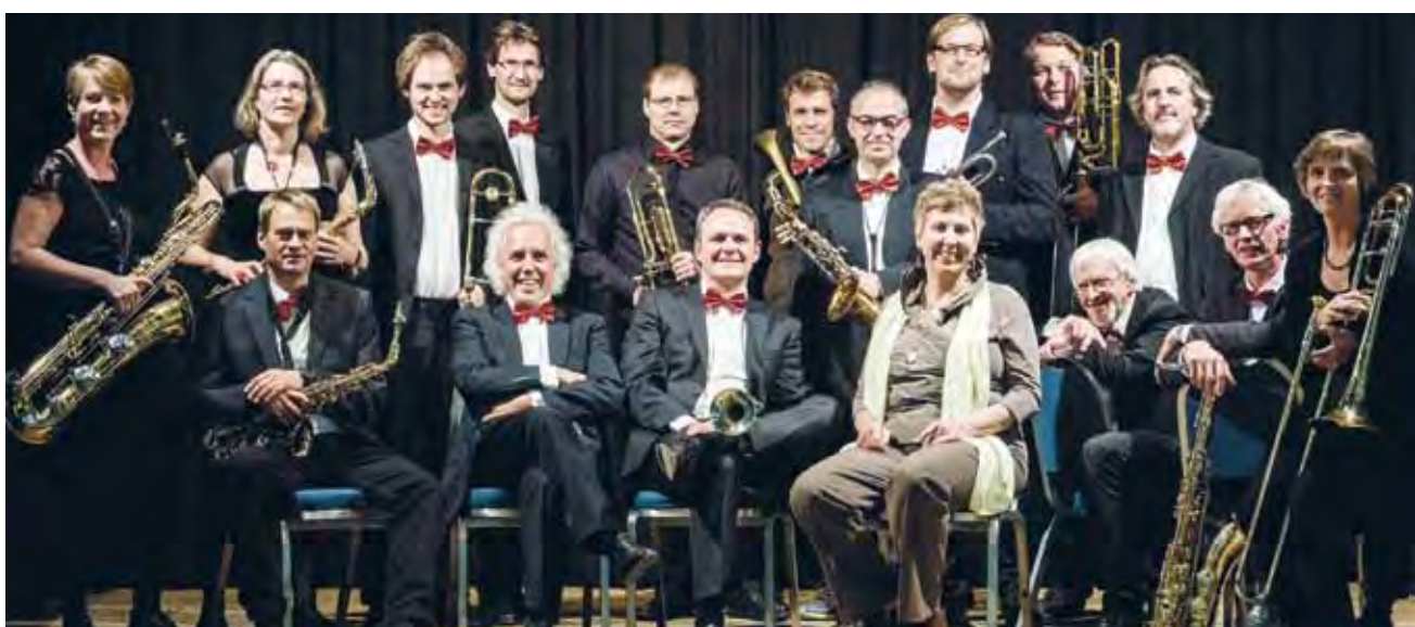
Dansk-tyske JazzcoastOrchestra - 14. november i Harreslev.