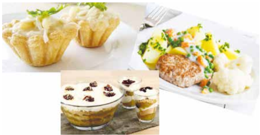
Mad á la Morten Korch venter.