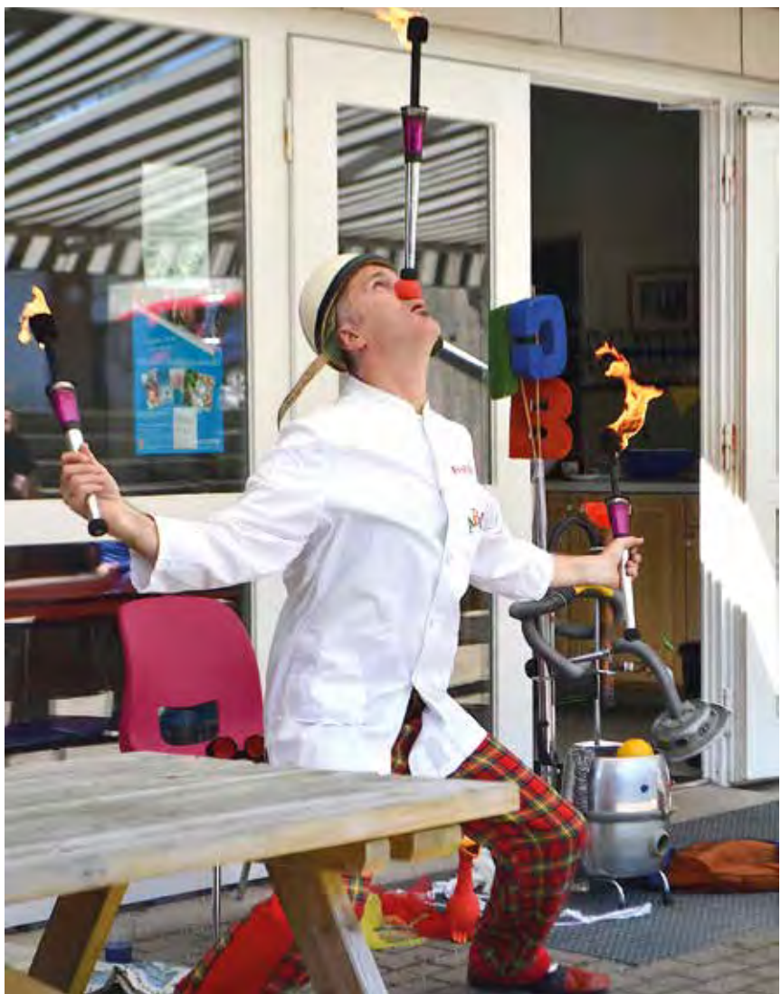
Professor ABC med sit afslutningsnummer.