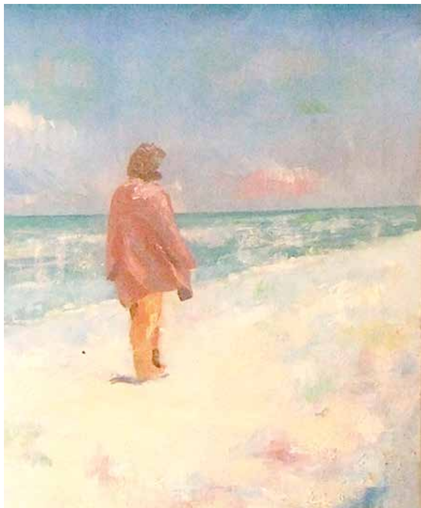
Claudia on the frozen beach.