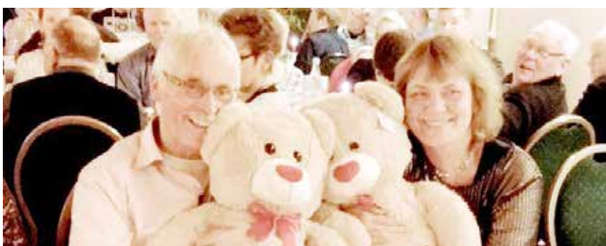
Grønlangkål-II. Hovedpræmien under årets tombola-lodtrækning var to kæmpestore bamser ved navn Asmus og Pernille. Vinder-loddet sad på disse to deltagere fra Sild.