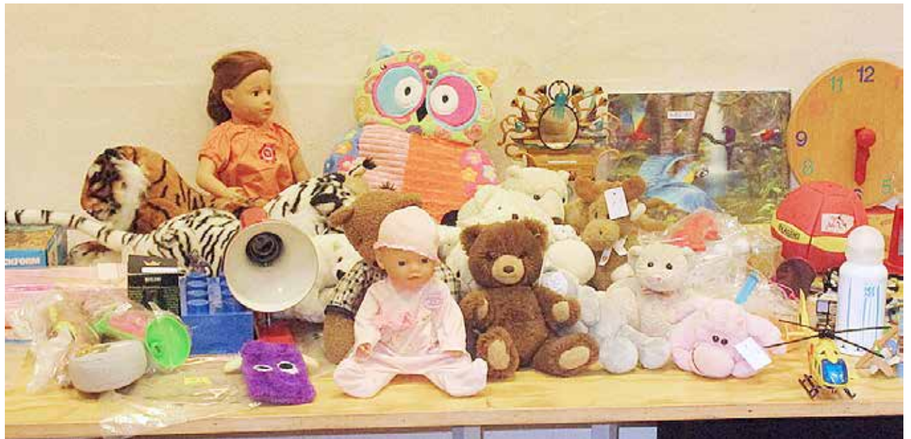
Disse uimodståelige dukker og bamser og andet legetøj venter alle på en ny ejer, der vil tage sig kærligt af dem.