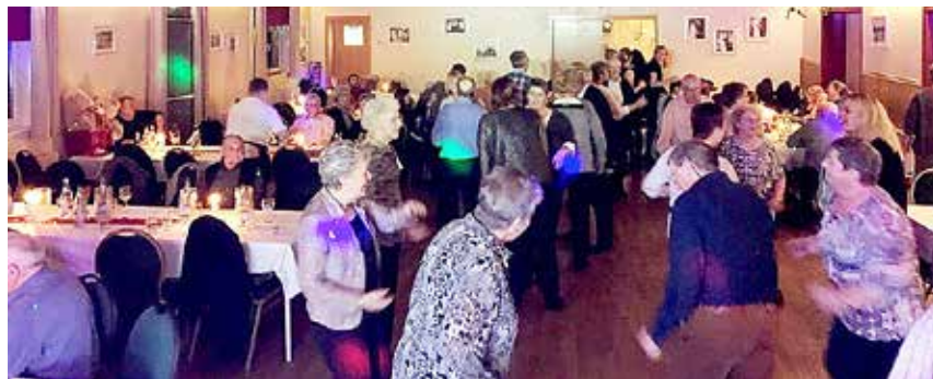
Hyggebelysning og hektisk aktivitet på dansegulvet.