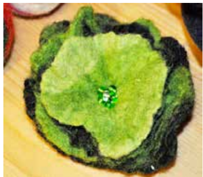
Aktivitetshuset i Nørregade gennemfører i denne måned en grundigt filtekursus over tre dage, hvor deltagerne lærer forskellige filteknikker.