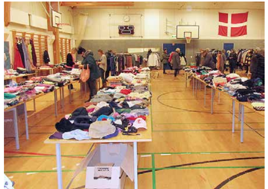
I denne weekend var hallen i Kejtum i hænderne på mange genbrugssjæle.

Alle sælgere var blevet bedt om at aflevere en kage til cafeen. Enkelte slap med at aflevere et pund kaffe. Overskuddet fra salgsboderne og udsænkningen modtager skolen og foreningen og går til anskaffelser, der ikke kan finansieres via budgetterne.