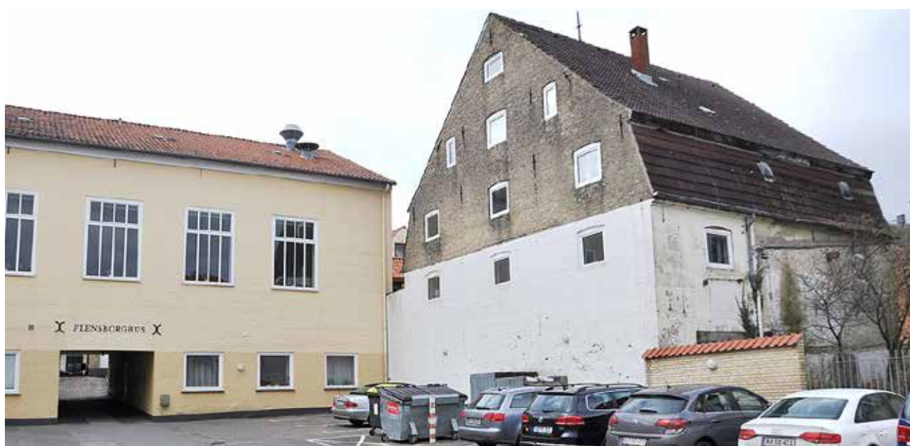
Der er stadig al mulig grund til at bakke op om visionen om etablering af Mindretallenes Hus - og et markant fyrtårn for det forbillige dansk-tyske mindretalsforhold - i dette gamle pakhus ved Flensborghus.