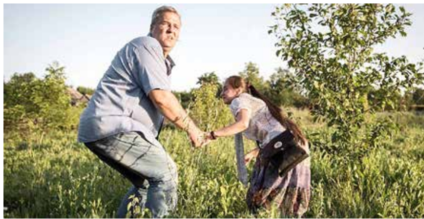
Dette stærke og fortællende pletskud af freelance-fotograf Asger Ladefoged blev sidste år kåret som Årets Pressefoto i Danmark. Titlen er 'Den Glemte Krig i Europa' og viser et ægtepar på flugt fra borgerkrigens rædsler i Ukraine.