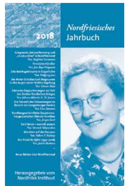
Das neue Nordfriesische Jahrbuch 2018 stellt sich vor.

Das Nordfriesische Jahrbuch 2018 umfasst 260 Seiten, kostet 9,80 Euro und ist erhältlich im Buchhandel oder direkt beim Nordfriisk Instituut in Bredstedt (Tel. 04671/60120). Mitglieder des Vereins Nordfriesisches Institut erhalten auf Anforderung ein Freiemplaar.