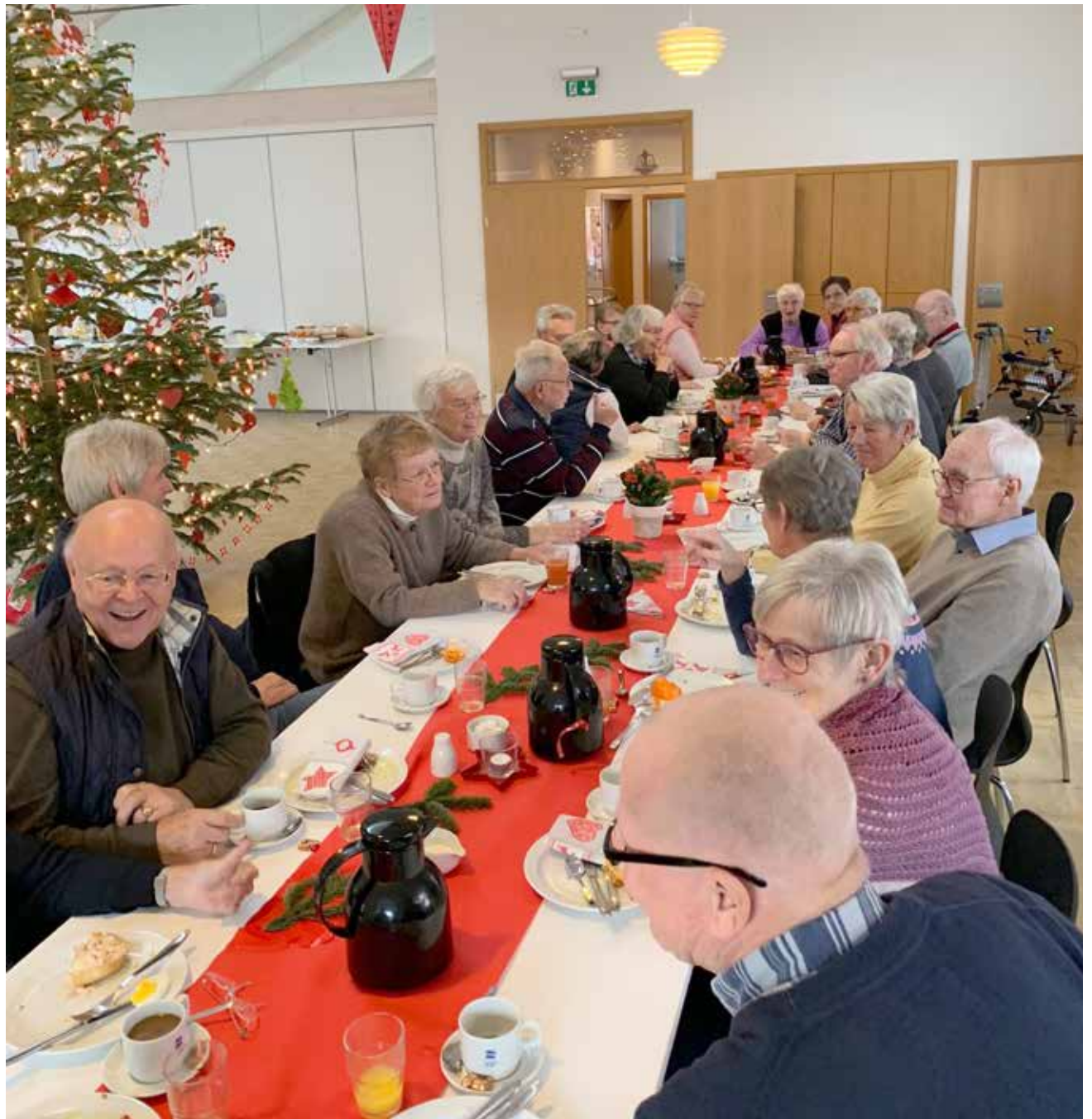
Glade ældre til SSFs julefrokost i Ejderhuset i Bydelsdorf.