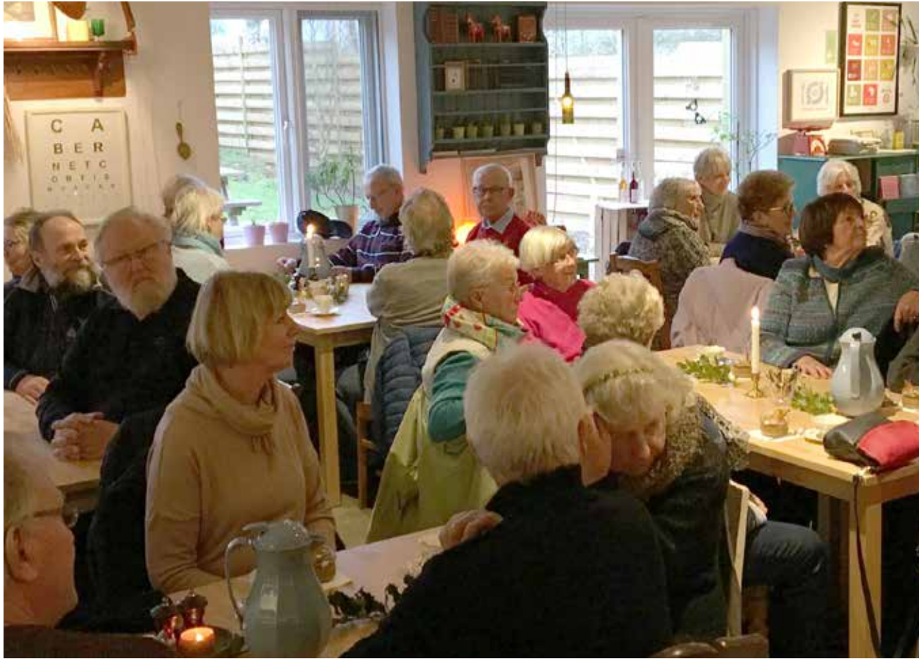
Vester Vedsted Vingård; det er egen vinproduktion, en hyggelig gårdbutik og belle cuisine – her nydes kaffen og kagerne.