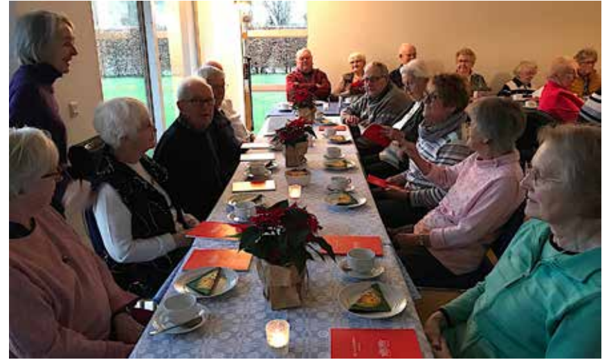
Fra adventsmødet i Satrup.