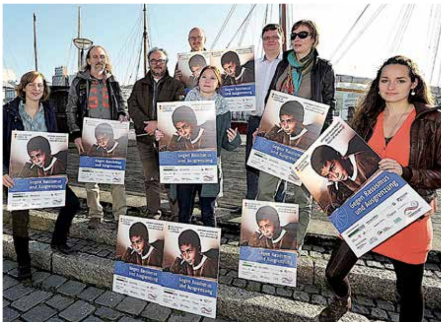
SSW'ere med klar holdning.