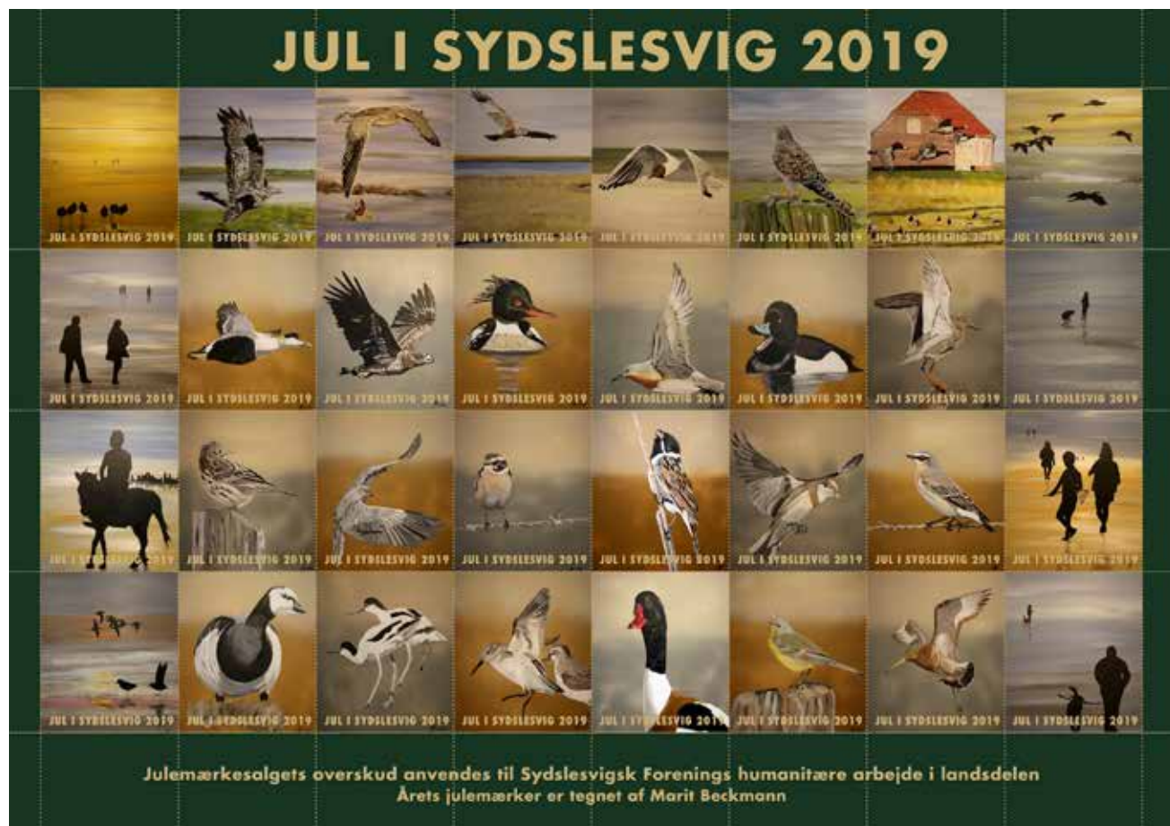
De sydslesvigiske julemærker 2019.