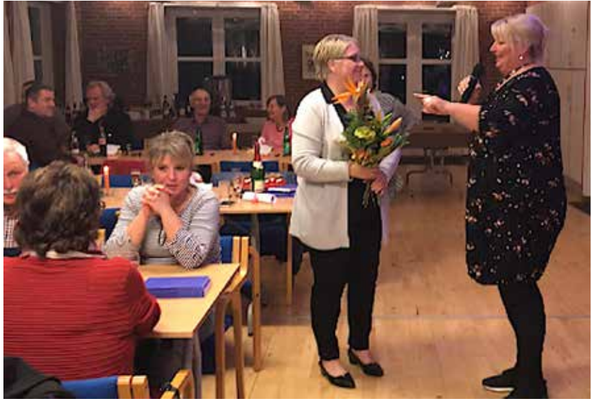
Blomster og velvalgte ord fra SSW-landdagsgruppen til den nyvalgte SSF-landsformand.