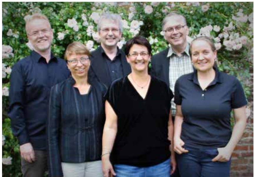
Ensemble SoloSesto.

auf der Barocklaute begleitet. Zudem erklingen einige Werke für Laute solo. Die sechs Sängerinnen und Sänger aus Hamburg und Schleswig-Holstein erarbeiten unter Leitung von Kirchenmusiker Christian Hoffmann (Tönning) anspruchsvolle Werke der mehrstimmigen Vokalmusik. Der Eintritt zu dem Konzert ist frei.