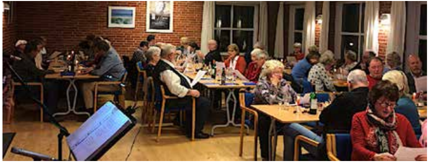
80 danske og tyske deltagere til mortensaften i Egernførde.