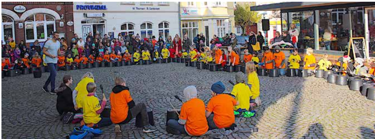
Det er et orkester, der fylder noget.