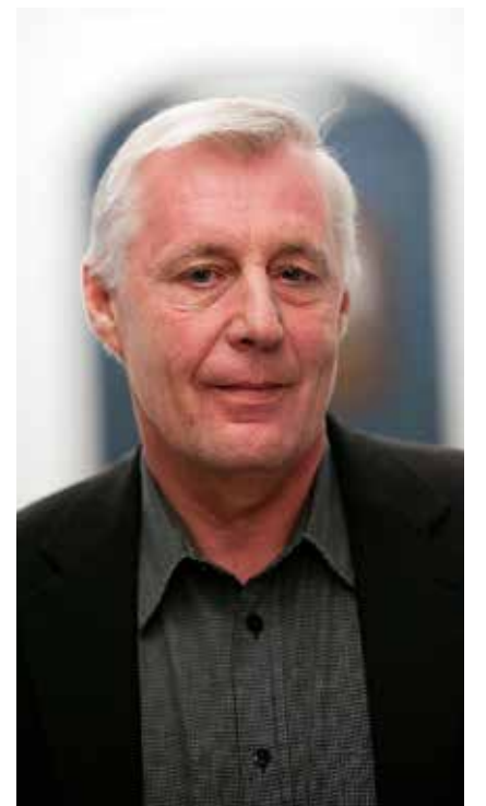
Et af højdepunkterne på folketings-turen 2019 bliver modtagelsen hos og middagen med Folketingets præsidium med formand Henrik Dam Kristensen i spidsen.