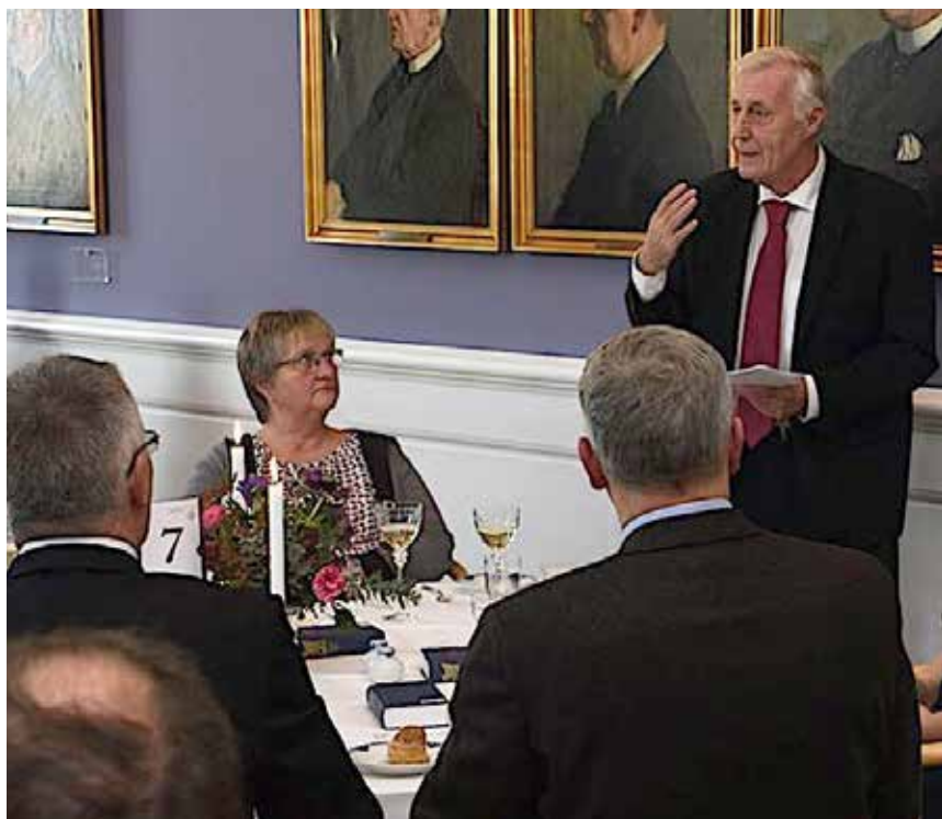
Folketingets formand Henrik Dam Kristensen byder Sydslesvig-delegationen velkommen.