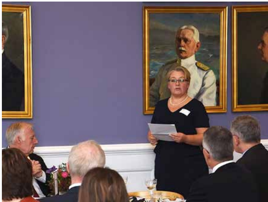
Den nyvalgte SSF-formand påpegede i sin takketale, at Dronningens besøg hos mindretallet havde været en uforglemmelig begivenhed.