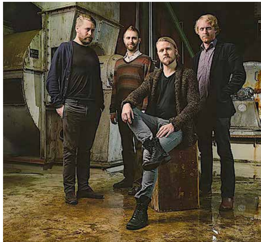
Islandske Árstíðir - i Flensborg 1. december.

Samt via 0461 - 588 120, www.ticketmaster.de