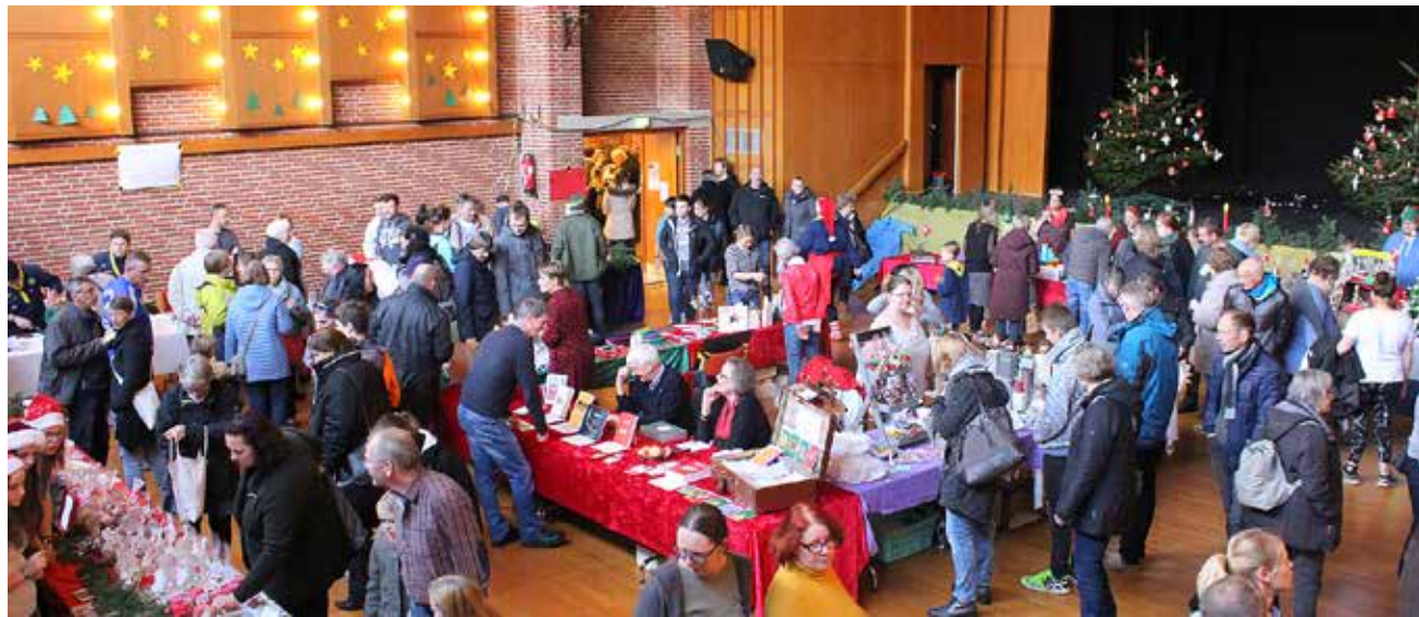
Fuldt hus, når der er julemarked på Husumhus.