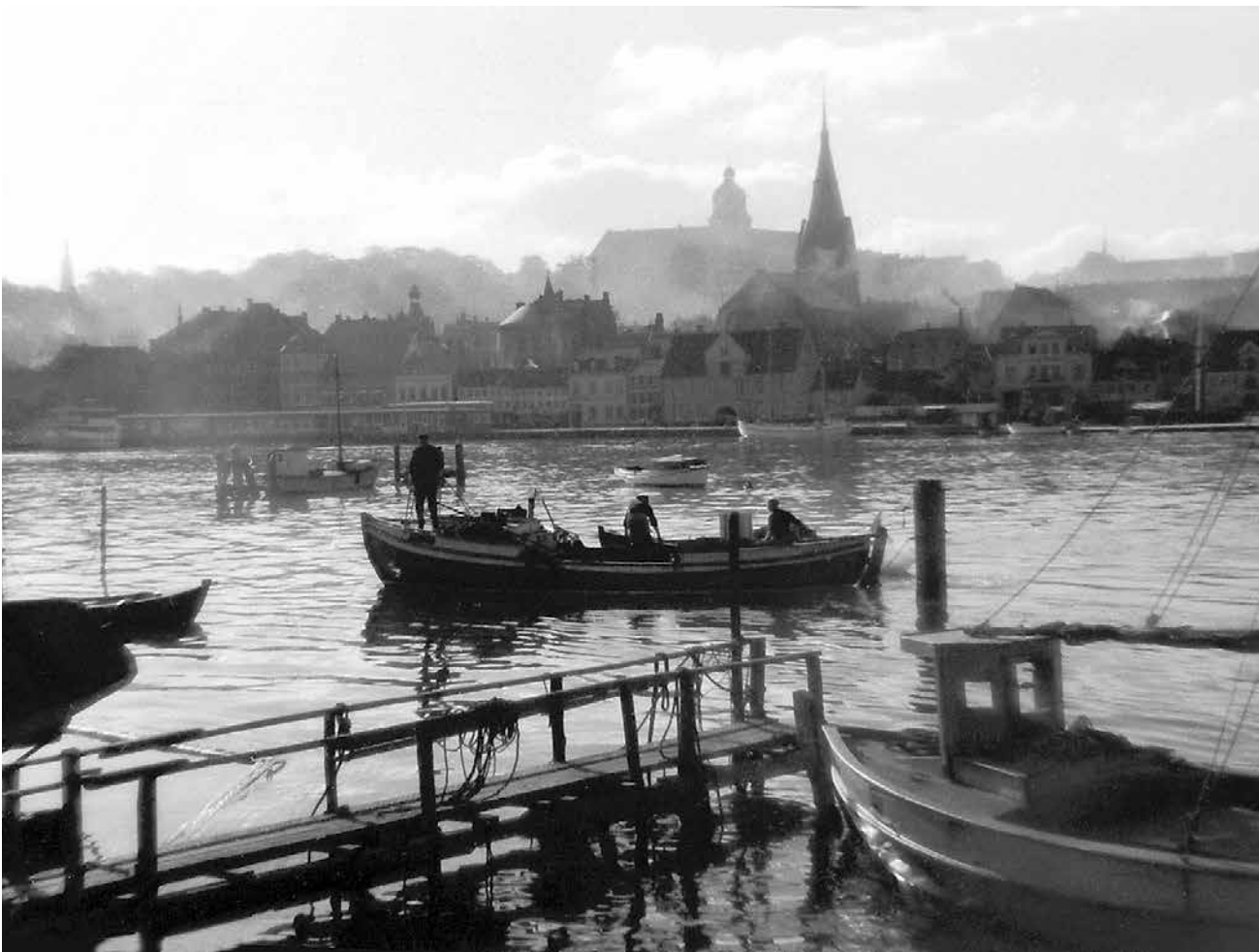
Fiskere i Flensborg havn. (Peter Hattesen, ca. 1938)