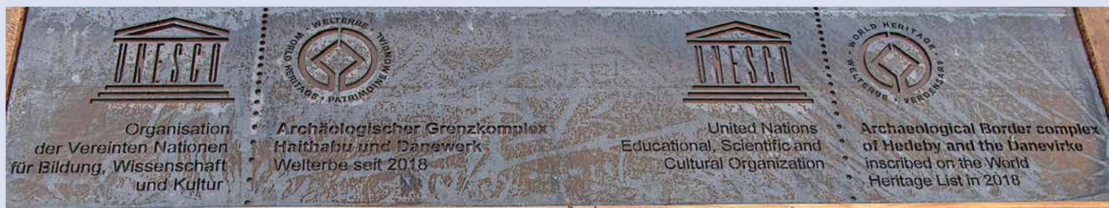
Verdensarv-plaketten, som Dronning Margrethe afslørede på Danevirke i sidste uge.