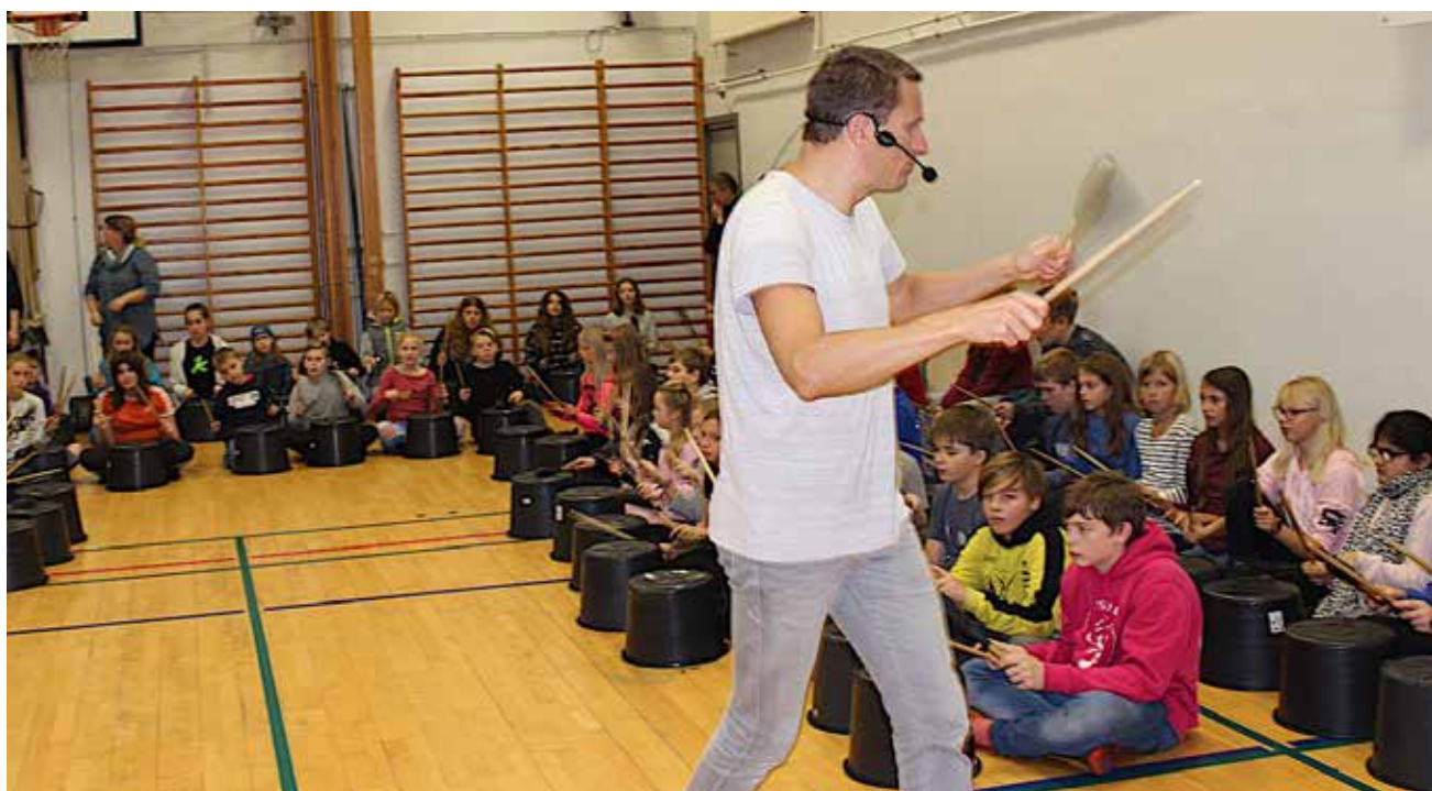
Det gungrede godt, da børnene øvede sig på Bredsted Danske Skole.