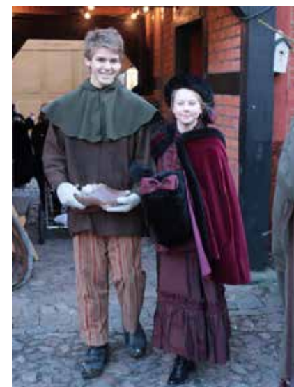
Børn i historiske gevandter på julemarkedet i Odense.

gården og H.C. Andersens Hus. Markedet fremstår meget u-kommercielt, med hyggelige boder og mennesker klædt i historiske og eventyrlige gevandter. Måske ser du Pigen med svovlstikkerne eller Klodshans. Der demonstreres gammelt håndværk og emmer af gammeldags jul. Udover det er Odense Danmarks 3. største by og har en fin gågade og mange spændende museer. Man kan f.eks. vælge at se både H.C. Andersens fødehjem, barndomshjem og H.C. Andersens museum. Det lille museum Tidens Samling, har i år særudstillingen "Ung i 60'erne", som viser datidens nye trends indenfor mode og musik.