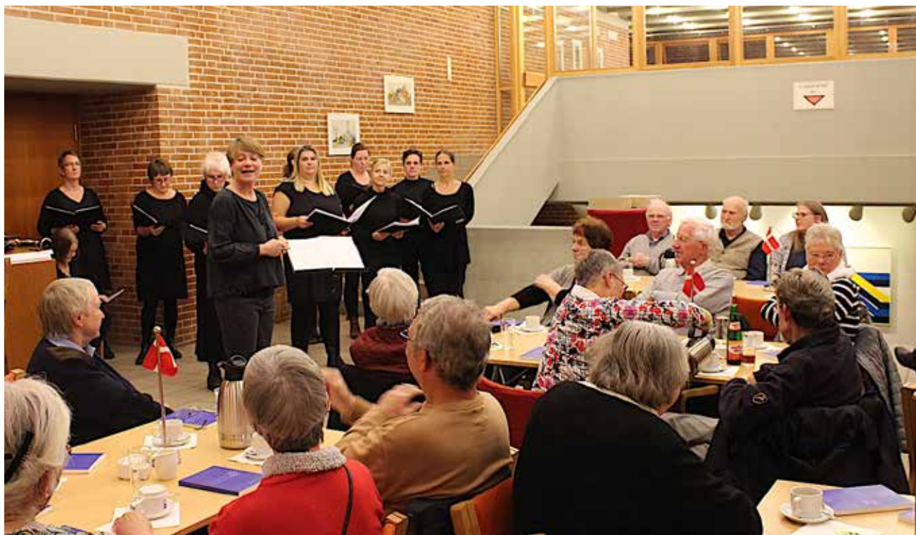
Ejderstedkoret, der virkelig kan noget med deres stemmer, glædede de ældre SSFere fra Husum og Ejdersted amter.