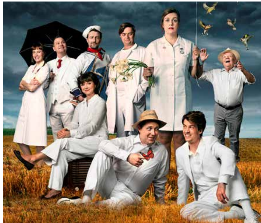
Så længe mit hjerte slår – 17. november på Flensborg teater.