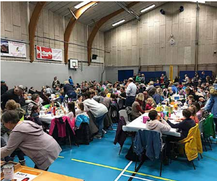
Glimt fra det store optog i Egernførde.