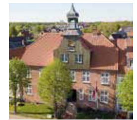
Skipperhuset i Tønning.