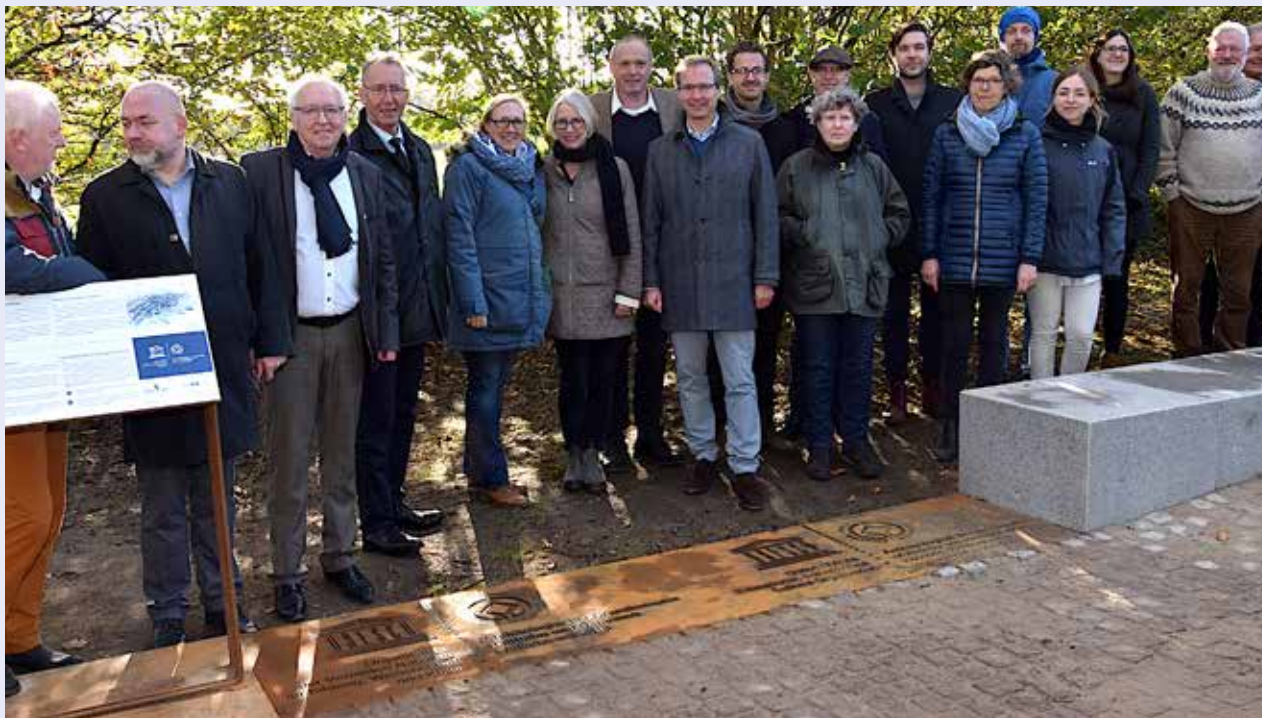
Stort fremmøde.