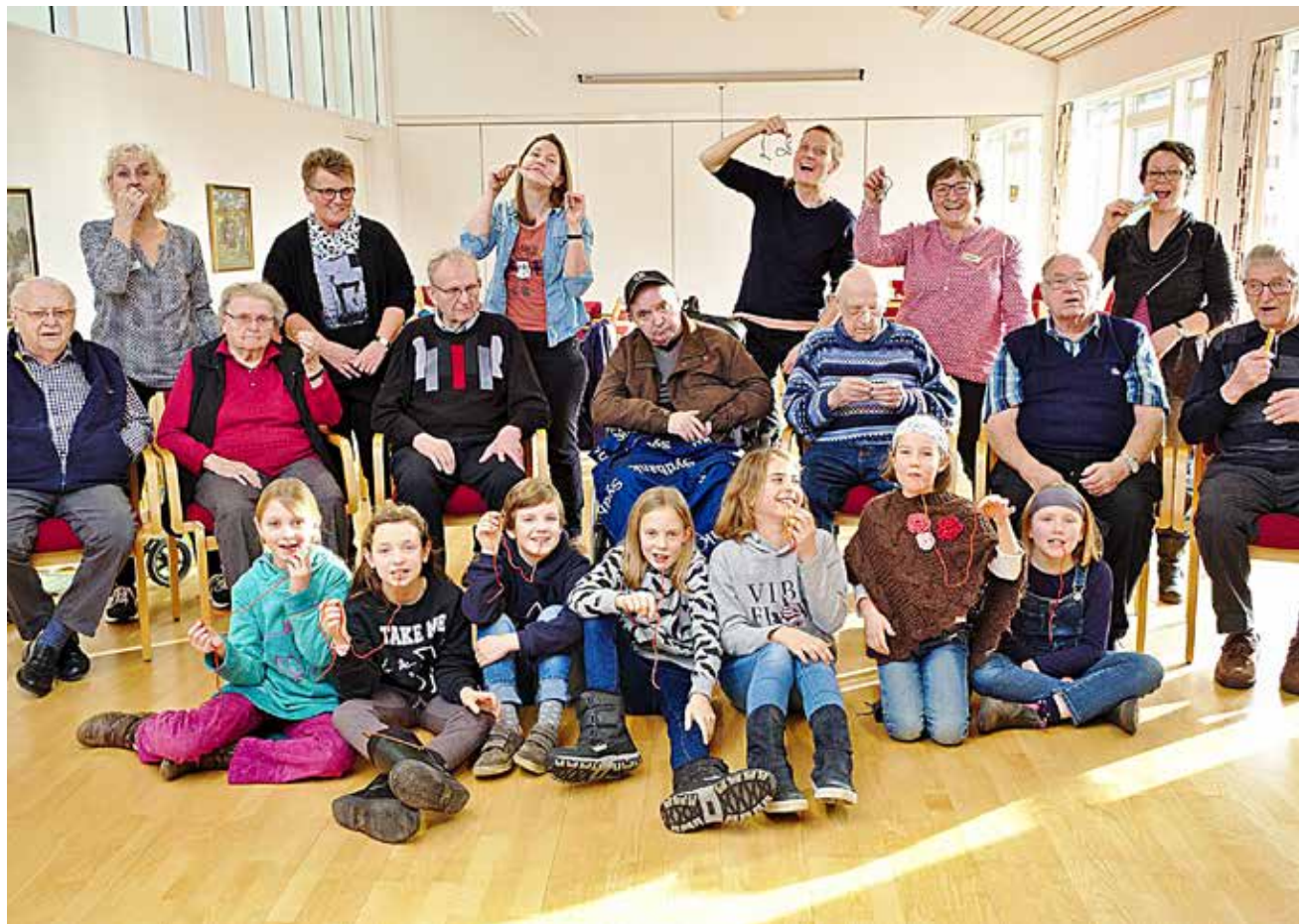
Alt und Jung haben sich über das Projekt angenähert, Neues probiert und schätzen gelernt.