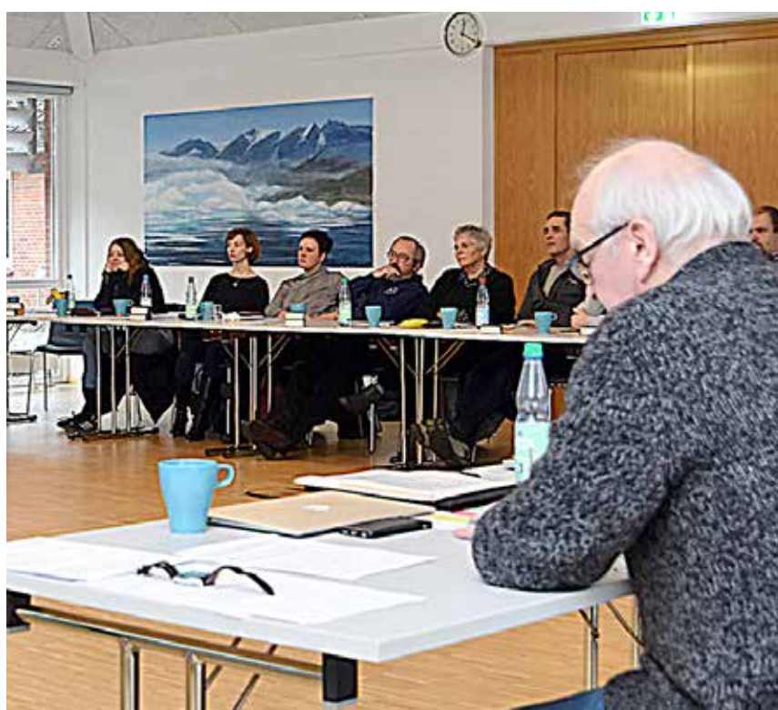
Hovedstyrelsen til seminar på Jaruplund Højskole. (Fotos: SSF)

I weekenden holdt SSFs ledelse sit årlige hovedstyrelsesseminar på Jarup- lund Højskole. Forretningsudvalget, repræsentanter for amterne og tilslut- tede foreninger samt medarbejdere brugte lørdagen på at drøfte emner, der er vigtige for SSFs arbejde i det kommende år. Der blev blandt andet talt om en mulig ny sammensætning af SSFs beslutningsorganer, mulige vedtægts- ændringer, den ny samarbejdsaftale til Samrådet og rammerne for SSFs kommunikation frem til 2020. Også det videre arbejde med ansø- ningen om at gøre det dansk-tyske samliv i grænselandet til immateriel UNESCO-verdensarv spillede en vigtig rolle. Hovedstyrelsesseminaret finder tradi- tionelt sted i starten af året. Det giver lejlighed til at drøfte emner, som SSFs hovedstyrelse skal tage stilling til i løbet af året, mere intenst.