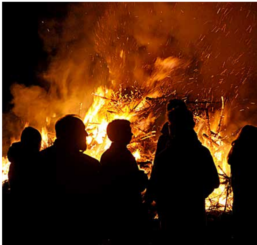
Biikebrennen fascinerer Einheimische wie Touristen.