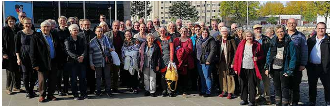
SSWerne i Berlin.