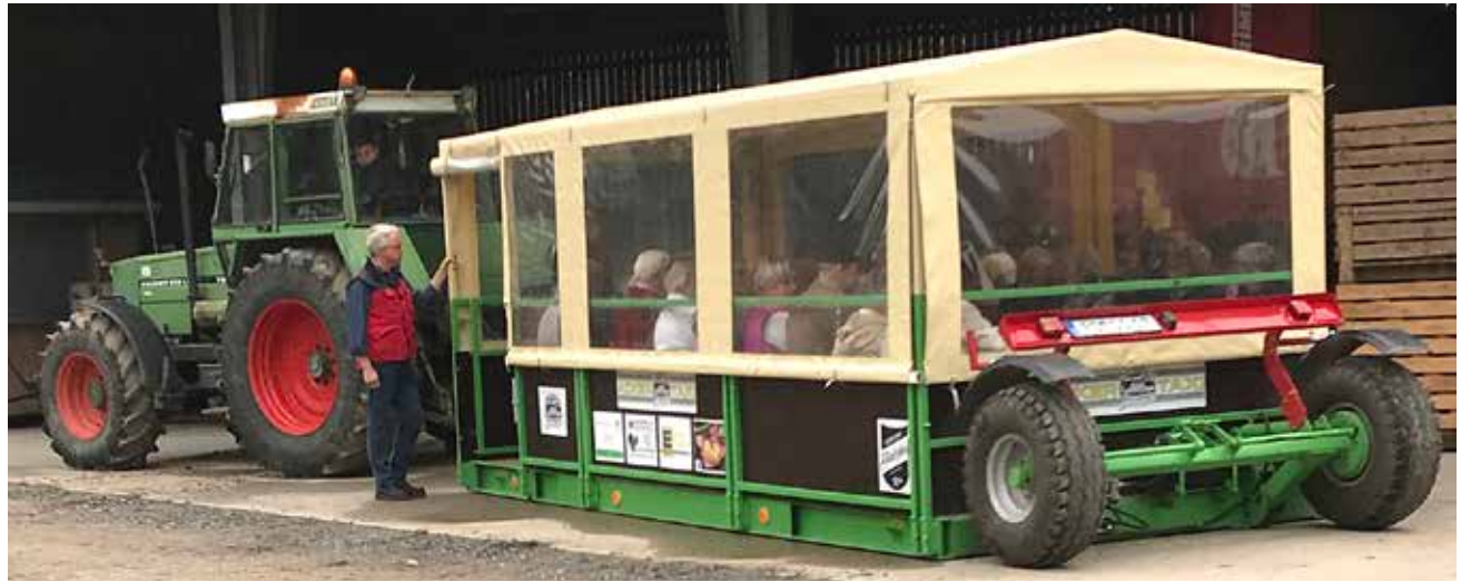
Med "agertaxi" på Schirnau gods.