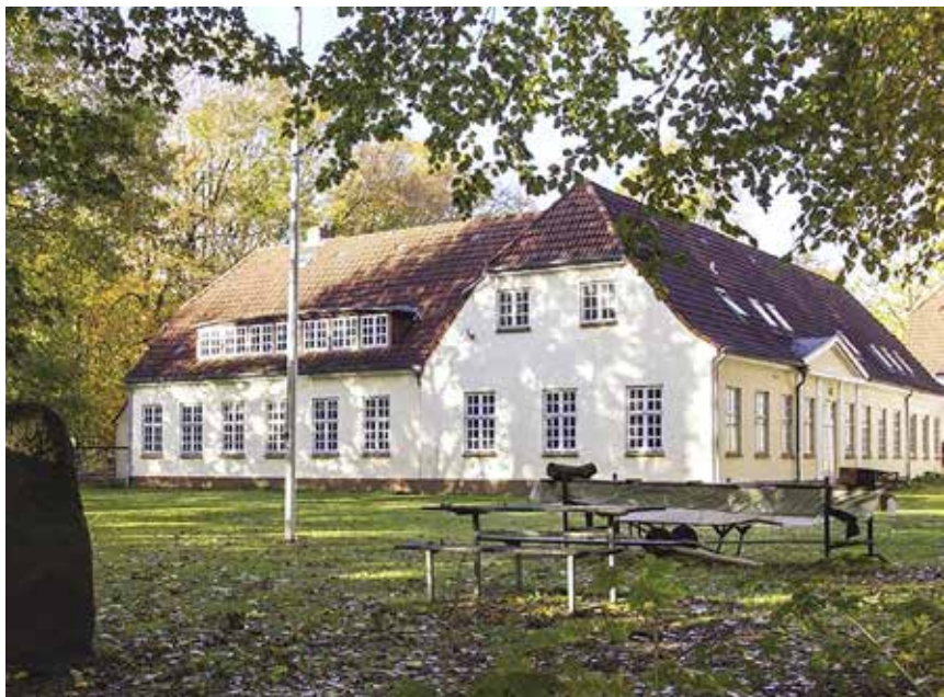
Haven bag Valsbølhus danner rammen om en naturdag med andagt og frokost søndag om en uge.