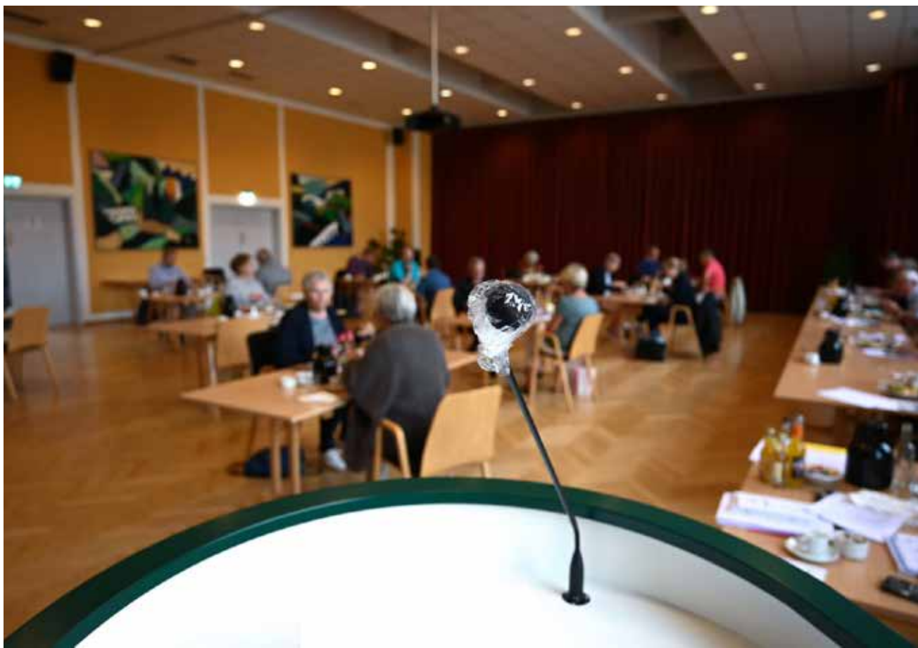
SSFs hovedstyrelse corona-teknisk placeret i salen på Flensborghus bag en desinficeret mikrofon.