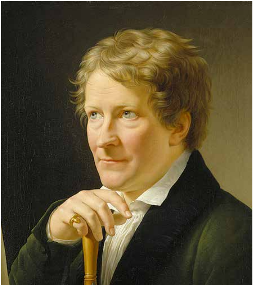
Portræt von Thorvaldsen.