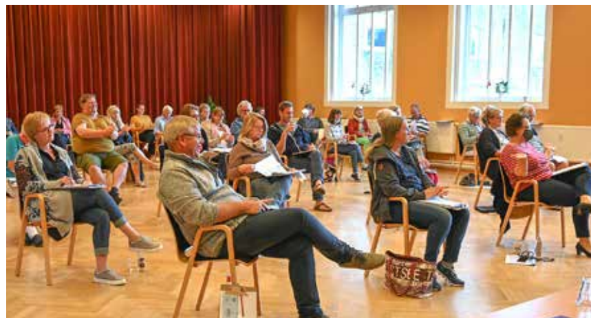
Der var plads til 51, og flere måtte afvises.

I min fritid er jeg aktiv i SSFs amtsstyrelse Rendsborg-Egernførde og i distriktsbestyrelsen Pris/ Klausorp. Ud over det er jeg en rigtig hestepige med en egen pony. Jeg glæder mig til det kommende år og alle de oplevelser, jeg får."