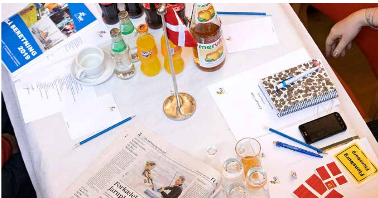
Aftenmøder og arrangementer uden for den normale arbejdstid hører ofte med til arbejdet hos SSF.