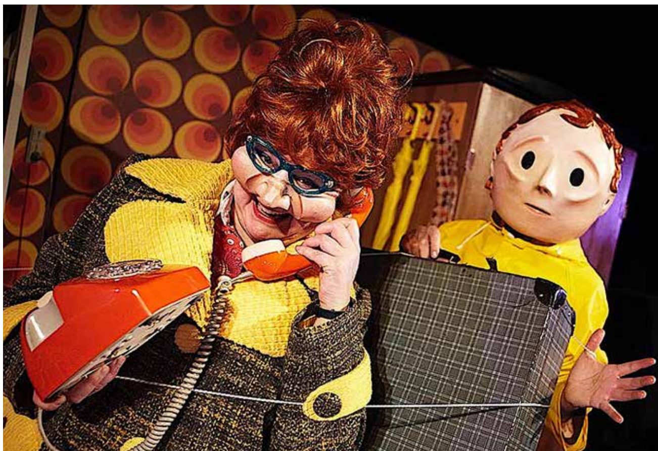
Theatret Thalias Tjenere kommer med "Mesters Monster", der henvender sig til elever i 4.-6. klasse.