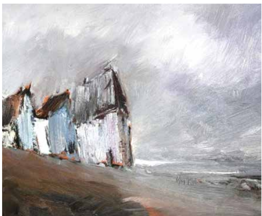
Eines von den zu kaufenden Werken: Uwe Thomas Guschls „Häuser am See“. (Öl/ Leinwand 40x50 cm)