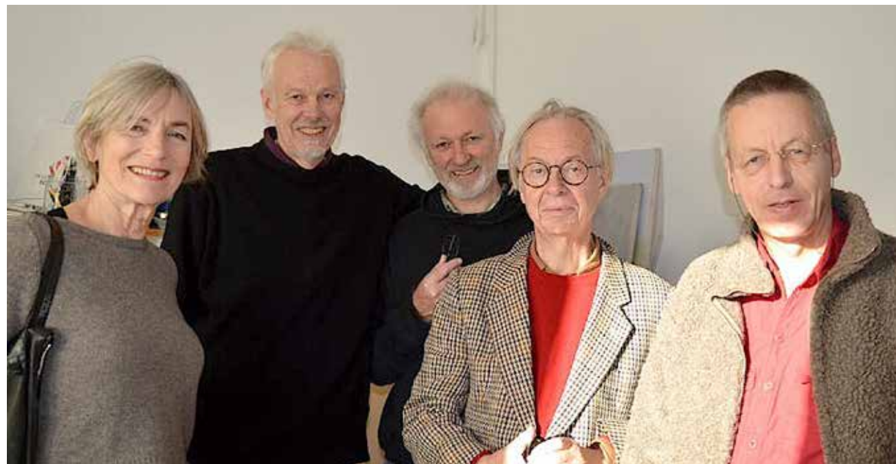
Fem af de seks til sensommer udstillende kunstnere samledes til dette gruppebillede ved Sydslesvigs danske Kunstforening.