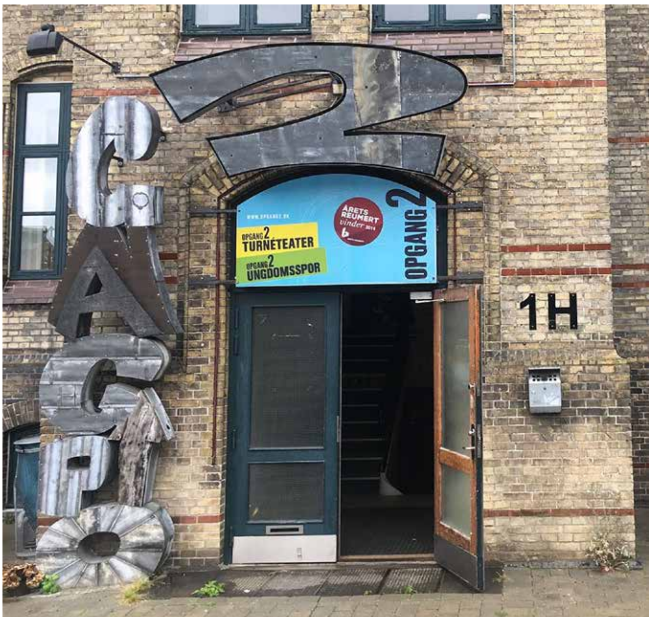
Opgang2 Turnéteater gæstespiller med "Ingen" for aldersgruppen i 7.-10. klasse.