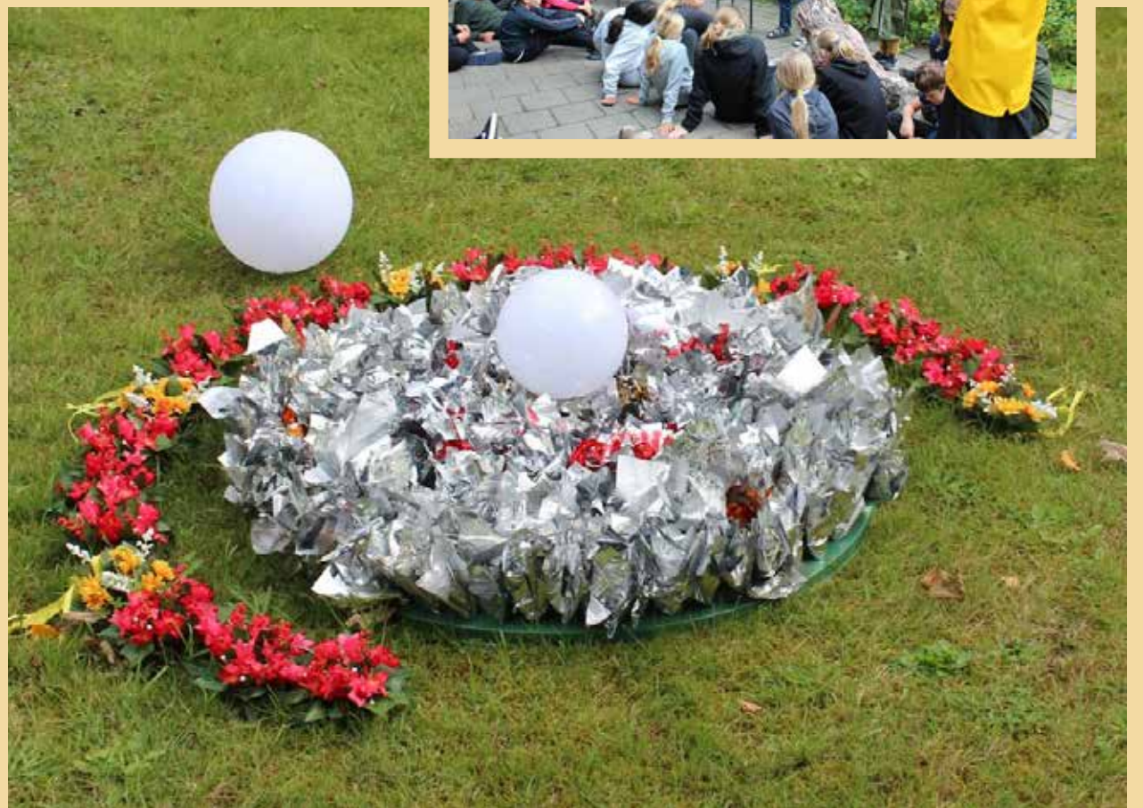
De unge havde fået til opgave at lede efter flere af Inga Momsens skulpturer på Mikkelsberg-området; og de fandt dem også.