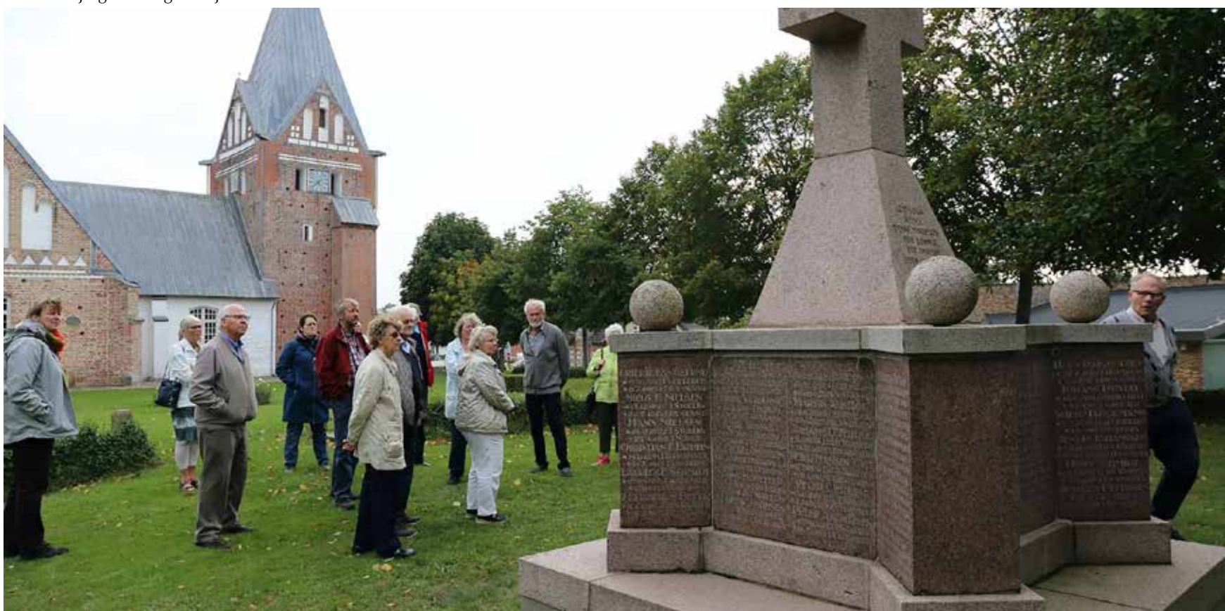
Udflugten sluttede på Løjt kirkegård ved mindesmærket for de faldne i 1. verdenskrig.