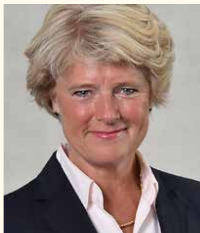
Staatsministerin Monika Grütters.

Mein Haus wird so weit wie möglich keine Gelder zurückfordern, die bereits angewiesen und für das jeweilige Vorhaben eingesetzt worden sind, auch wenn Projekte nun nicht mehr wie geplant stattfinden können. Ausführliche Erläuterungen und weiterführende Links zu den Corona-Hilfen der Bundesregierung finden Sie auf der BKM-Website www.kulturstaaatsministerin.de. Um bei