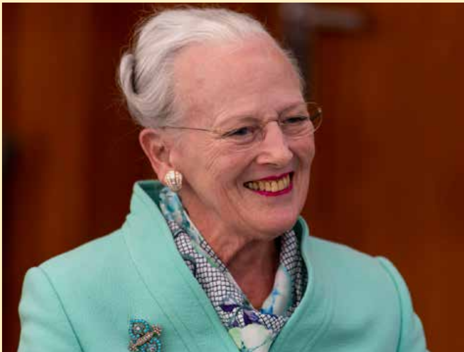
HM Dronning Margrethe - i Flensborg i september.