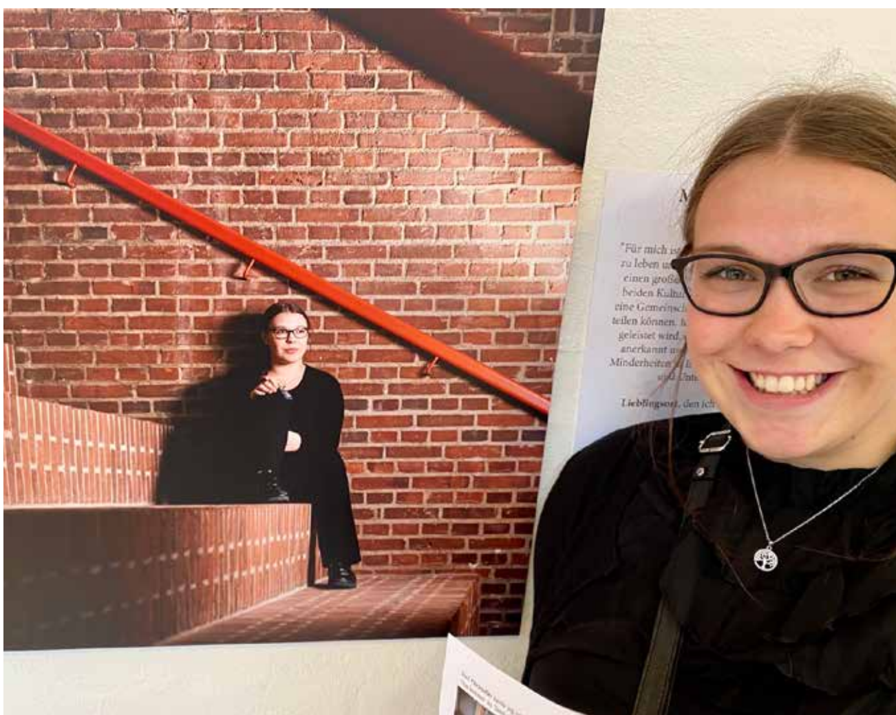
... betragtes kritisk-genkendende.