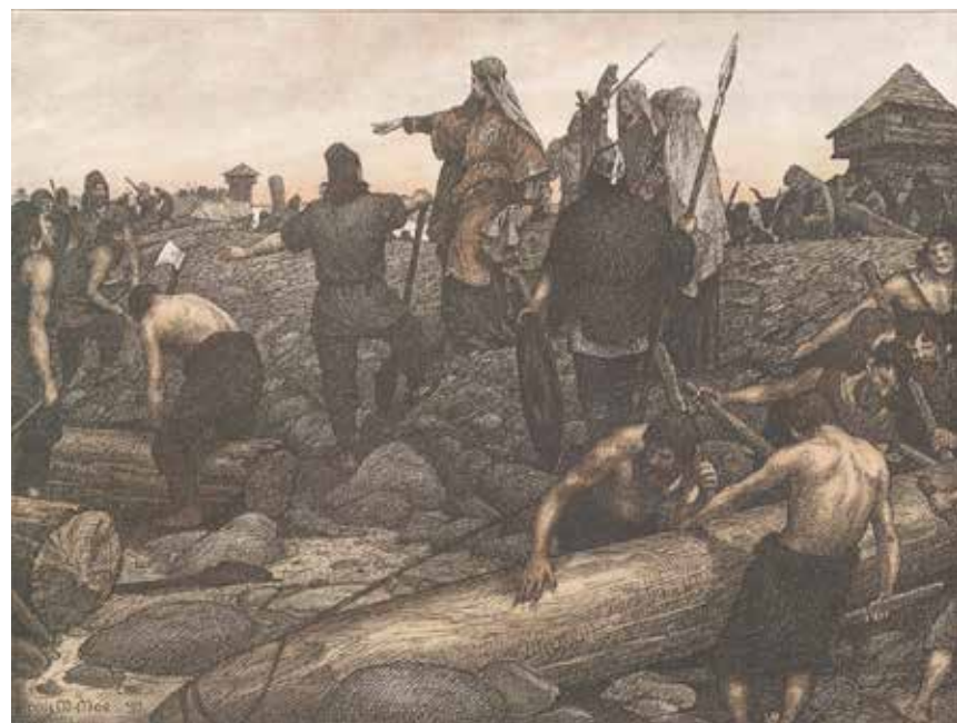
Der arbejdes på voldanlægget.