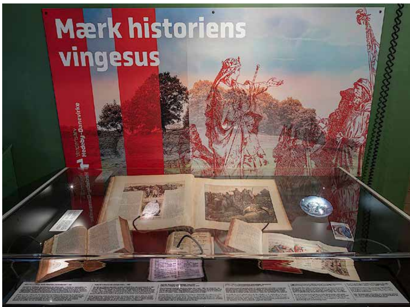
Den nye montre. (Ill.: Danevirke Museum)