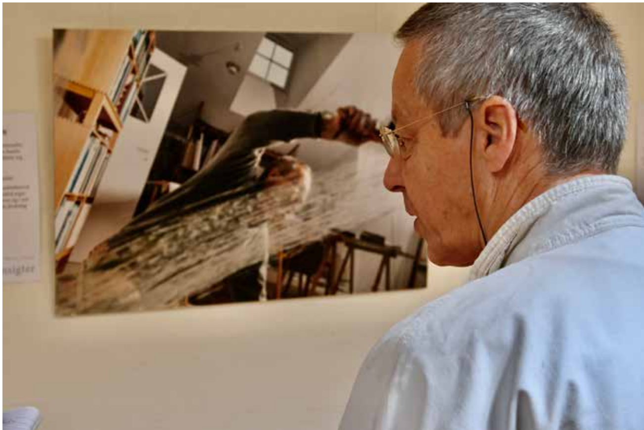
Billedet forestillende en selv...

til med støtte fra den slesvig-holstenske landdag og Investitionsbank Schleswig-Holstein. Oprindeligt skulle udstillingen have haft premiere i landdagen i Kiel den 17. marts. Den dag skulle en delegation fra Folketinget besøge landdagen. Men faren for at sprede Corona-virussen satte i første omgang en stopper for premieren. I stedet kan udstillingen nu og frem til den 14. august opleves på Mikkelberg ved Hatsted. Derefter udstilles "Ansigter - 2020 - Gesichter" i Tønder, Frederiksberg og i landdagen i Kiel. Udstillingen på Mikkelberg kan besøges uden tilmelding i åbningstiderne fre-søn 13-17, i kontortiden 9-13 samt efter aftale på telefon 04846 6604 hhv. info@mikkelberg.de ram