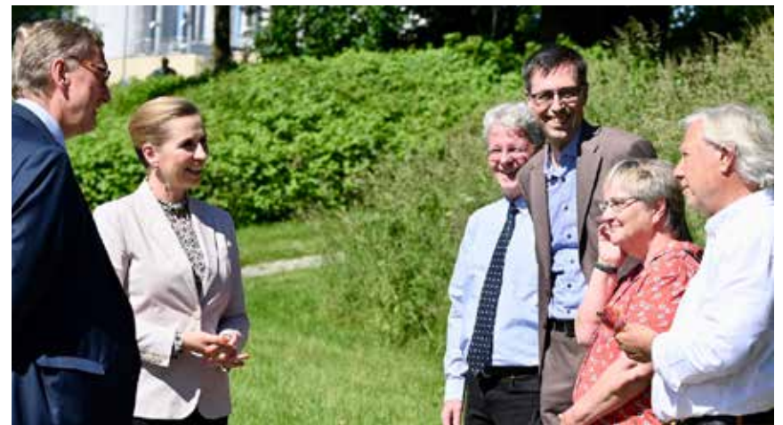
Smil og smalltalk; sydslesvigske spidser møder statsministeren.