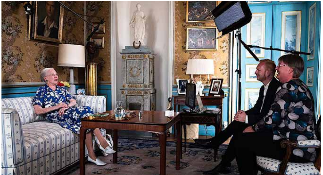
I anledning af Genforeningsdagen den 15. juni bragte DR1 mandag et interview med dronning Margrethe om hendes forhold til Genforeningen og Sønderjylland. Også TV2 bringer søndag den 21. juni et interview med H.M. Dronningen.