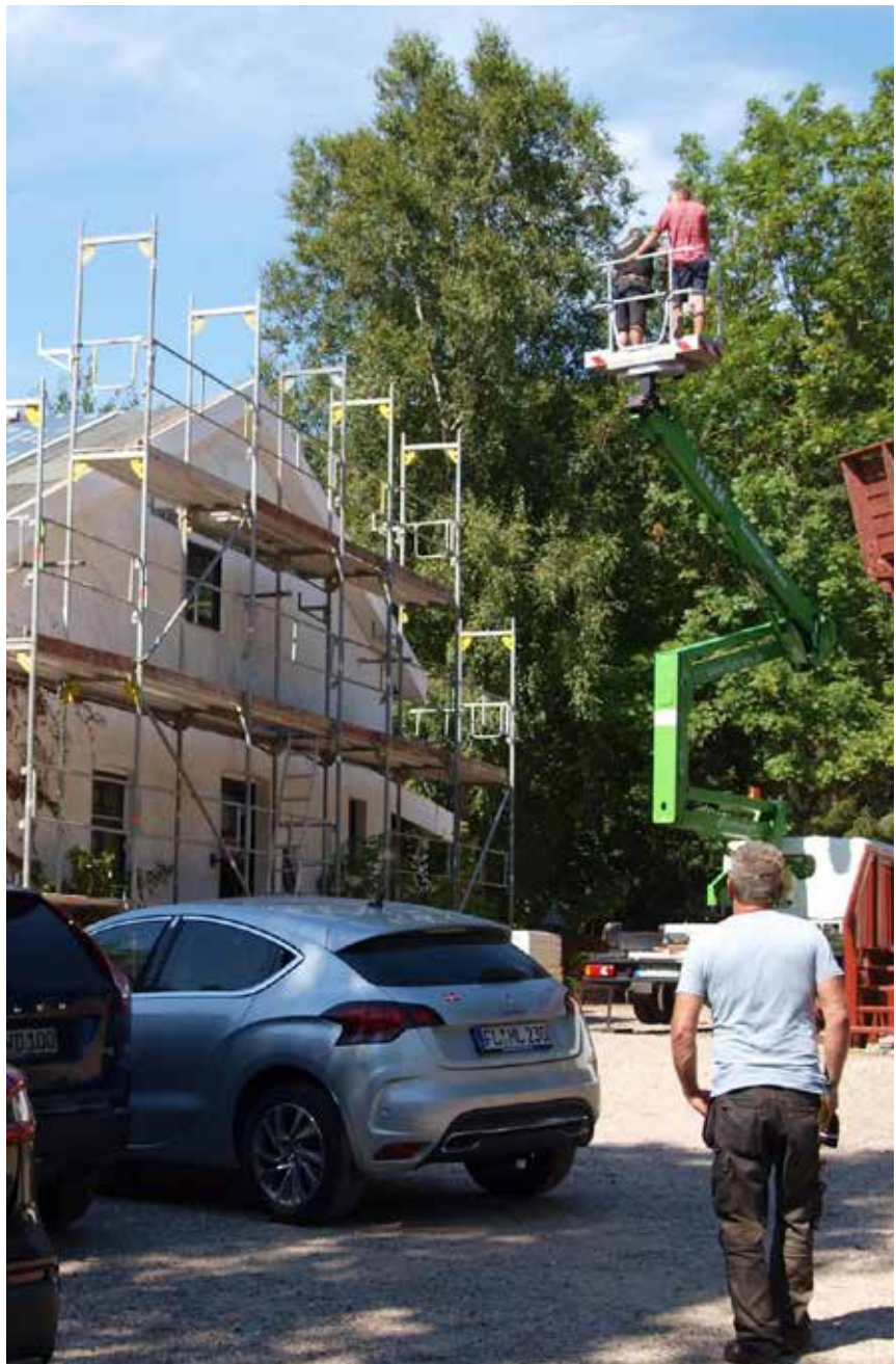
Taget på møllerens hus undersøges fra en lift.