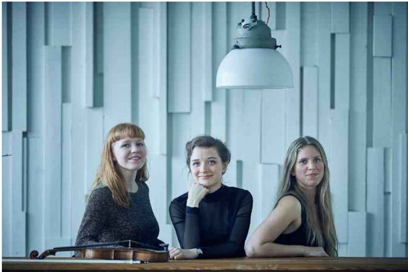
"Vesselil" i bibliotekshaven i Nørregade i Flensborg næste uge torsdag.