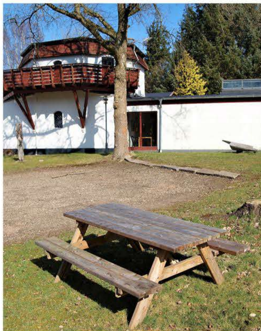
og herlige ude-faciliteter.