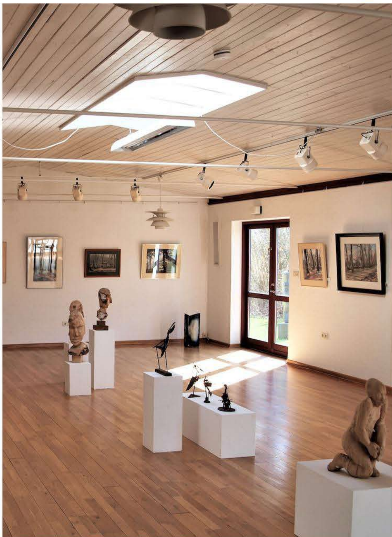
På Mikkjelberg er der masser af frirum inde...