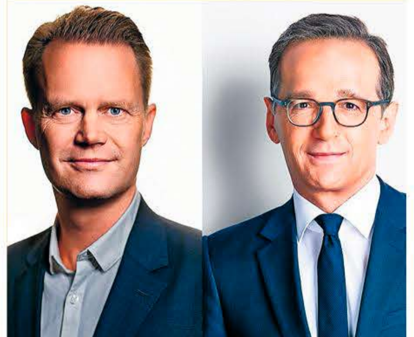
Udenrigsminister Jeppe Kofod. Udenrigsminister Heiko Maas.