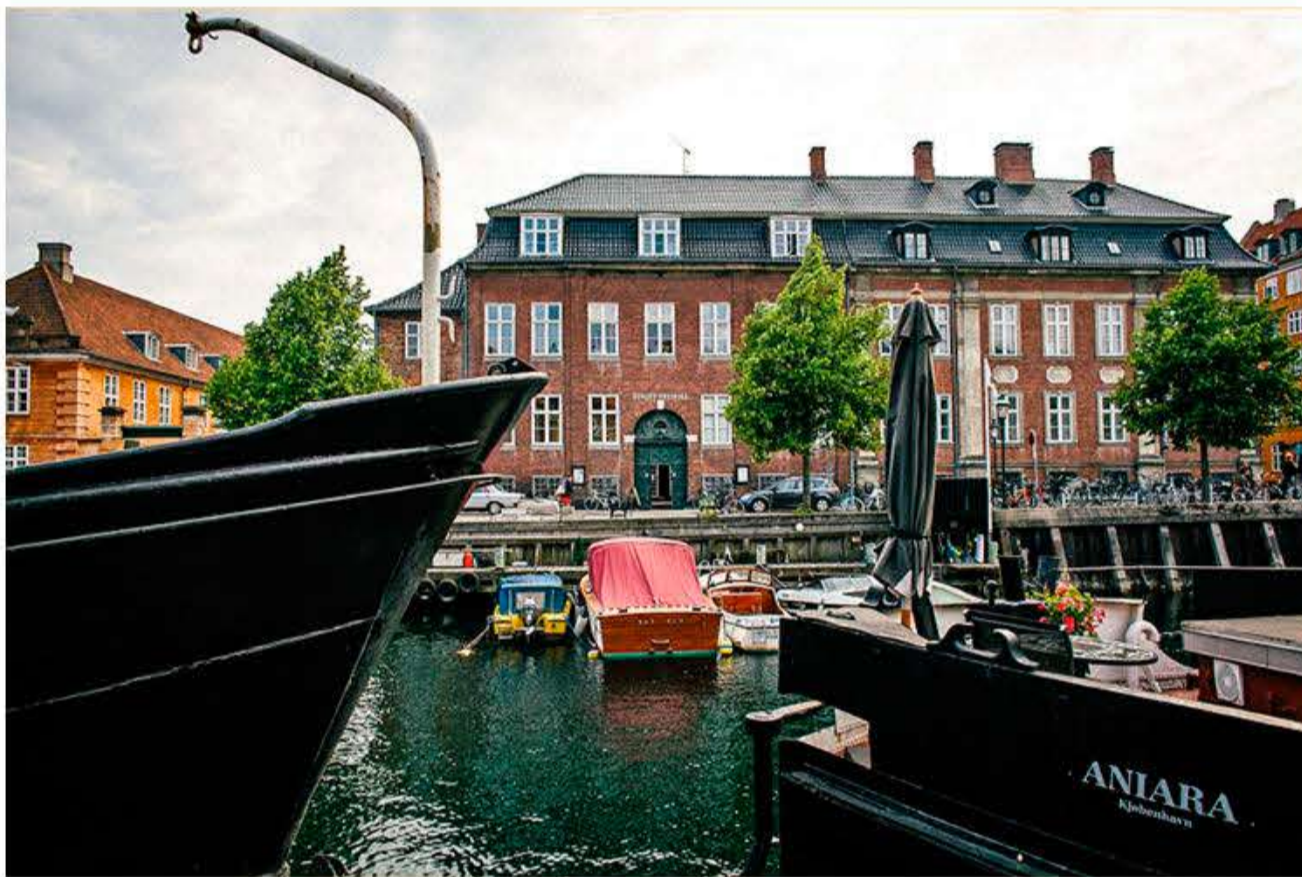
Johan Borups Højskole ligger i hjertet af København: Ved Frederiksholms Kanal lige over for Christiansborg.