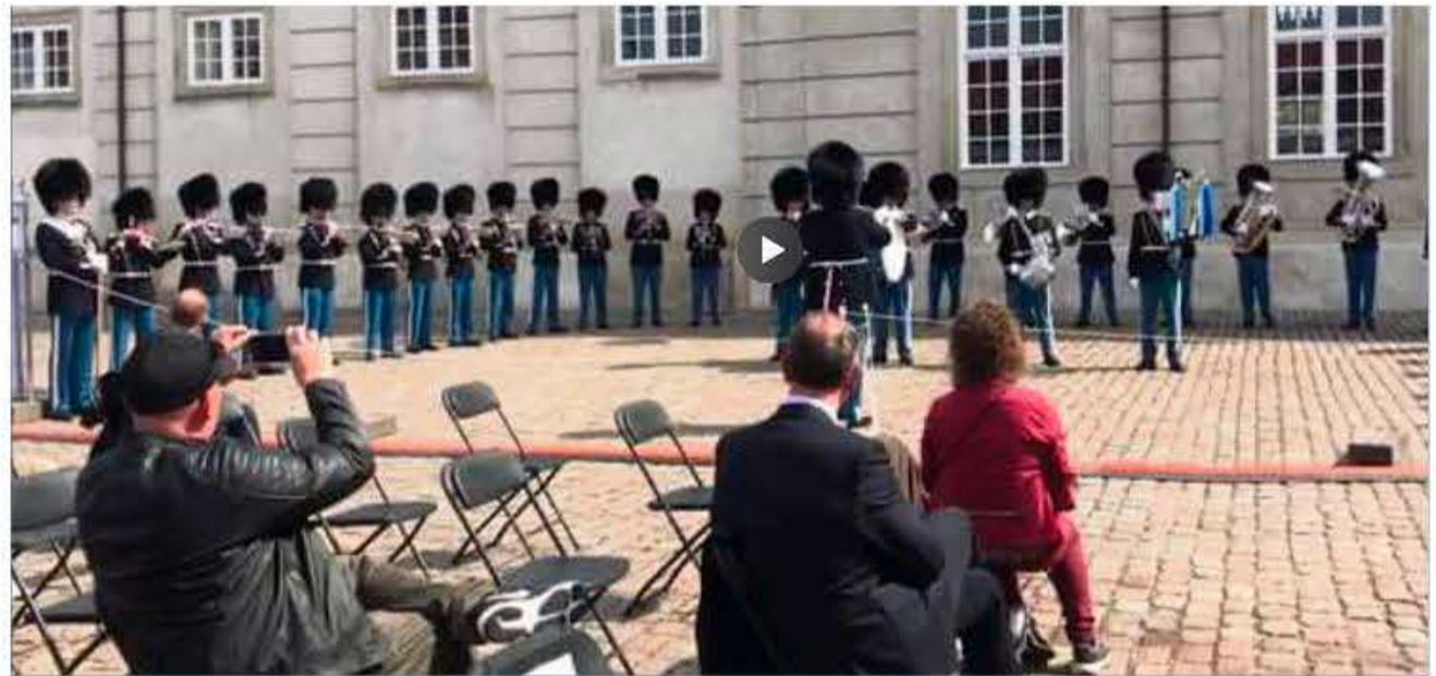
Den Kongelige Livgarde medvirkede. (Skærmbillede)