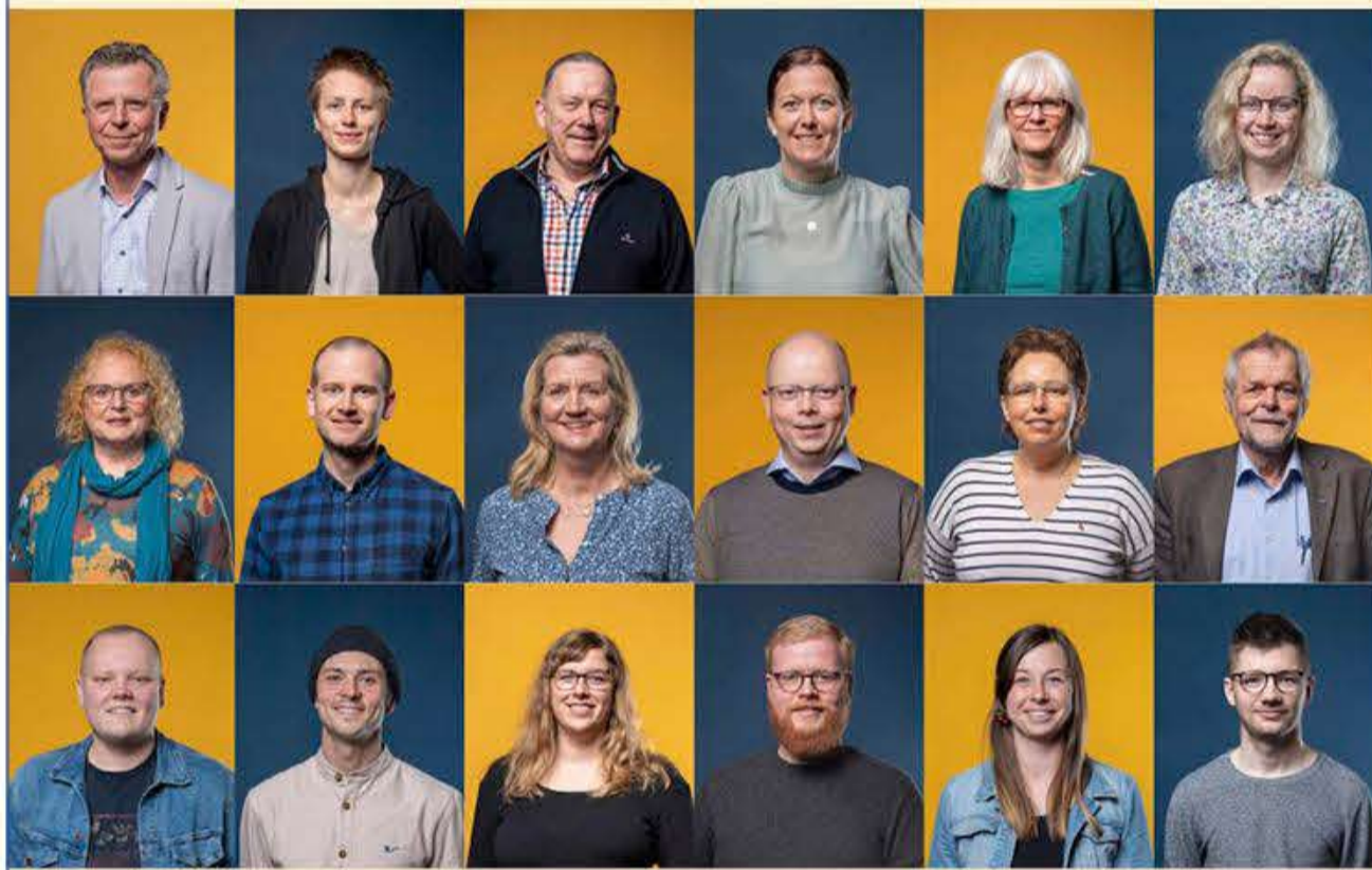
De første billeder er allerede taget. Her nogle af deltagerne i projektet »Et mindretals ansigter«.