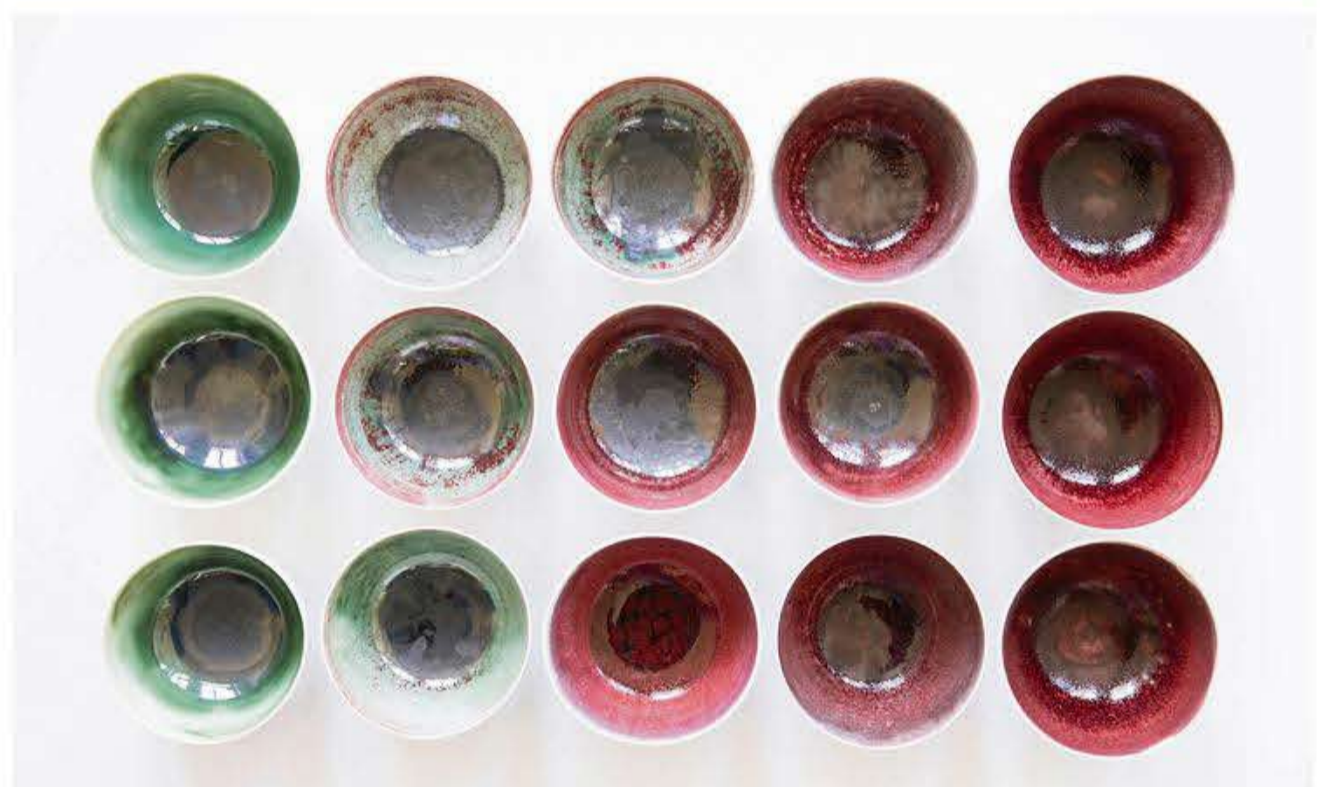
Lena Kaapke: Ofentopografie 2019.