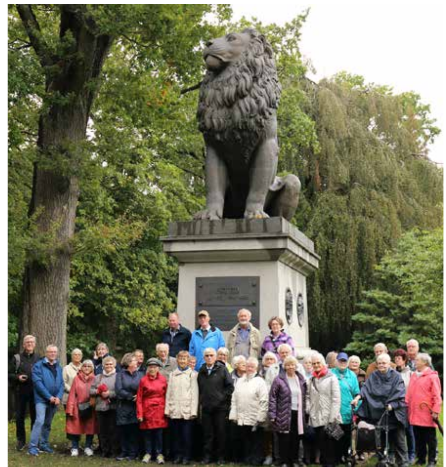
Gæster og værter foran den monumentale Istedløve.