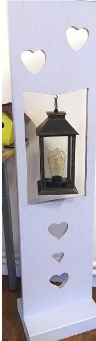
Der er rigtig store ting.