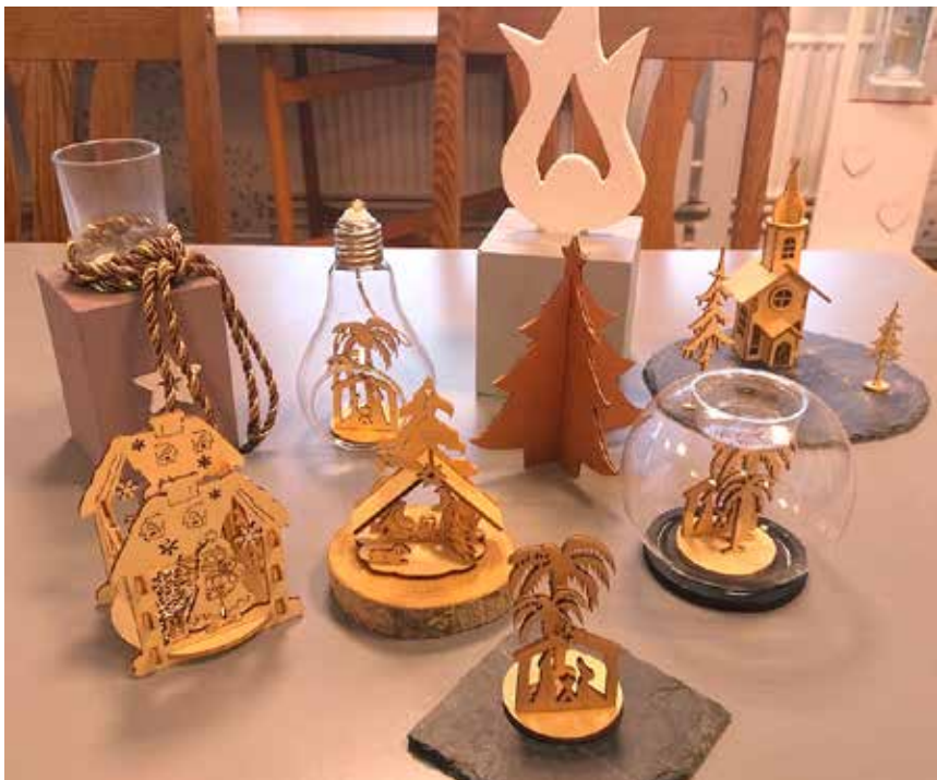
Og der er de mere finurlige ting.