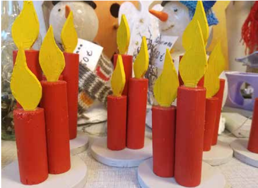
Der er dem ind imellem.