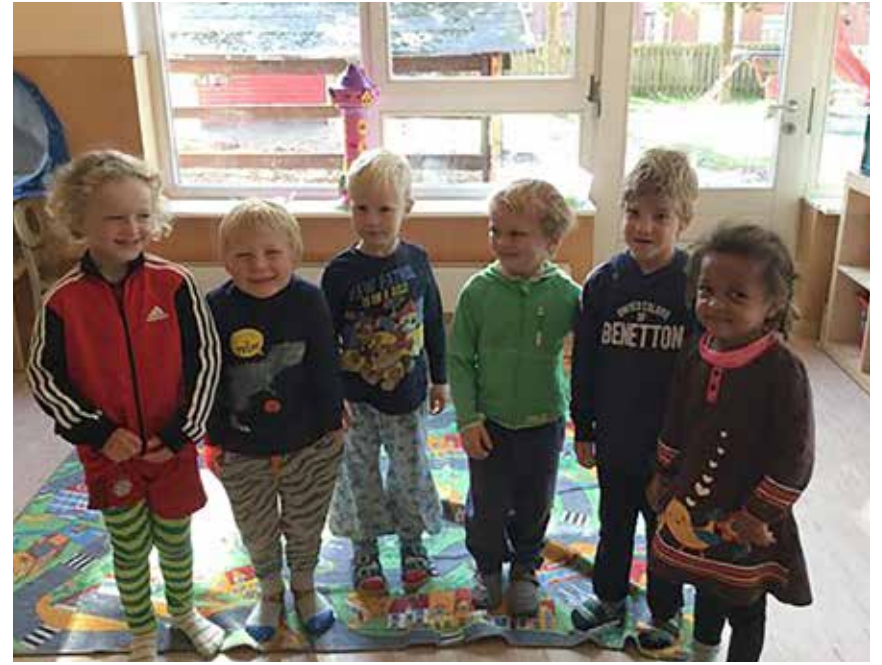
Førskolegruppen i Egernførde Børnehave vandt den ene del af optogsplakat-konkurrencen.